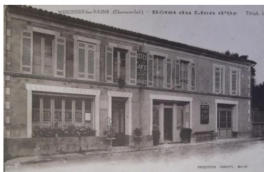
L'hôtel du Lion d'Or, carte postale du début du 20e siècle.