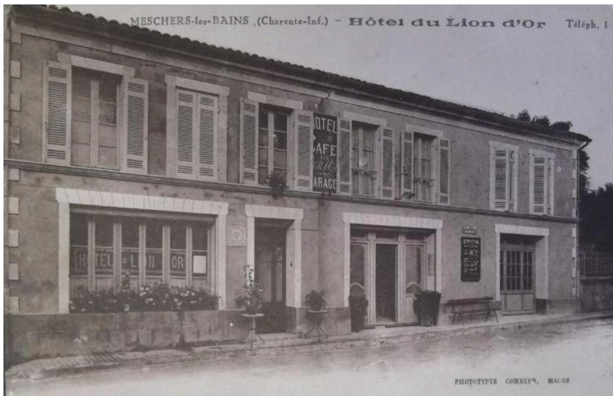
L'hôtel du Lion d'Or, carte postale du début du 20e siècle.