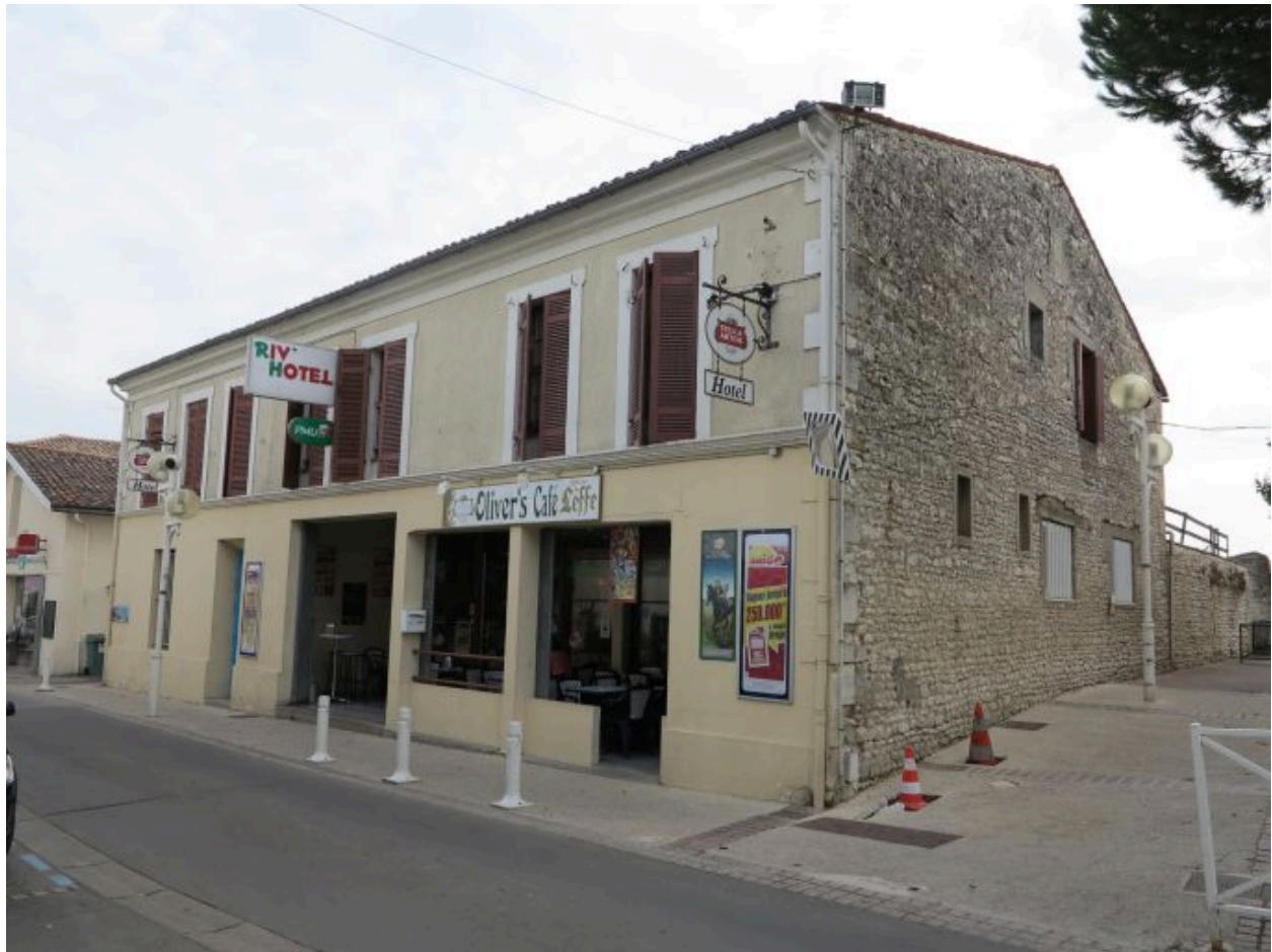
L'ancien hôtel du Lion d'Or vu depuis le nord.