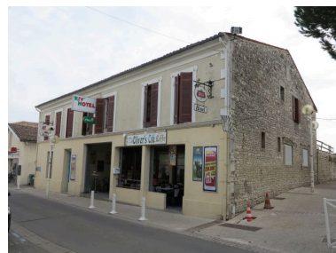
L'ancien hôtel du Lion d'Or vu depuis le nord. IVR54_20131708320NUCA