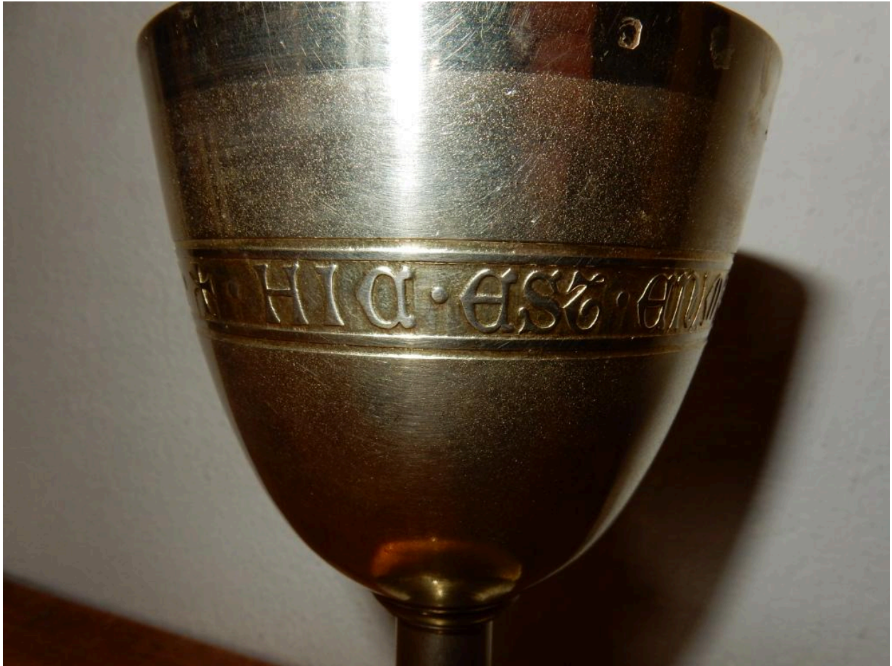
Détail des inscriptions sur la coupe.