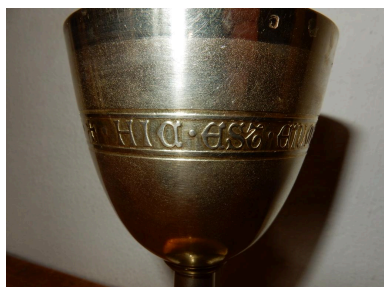
Détail des inscriptions sur la coupe.