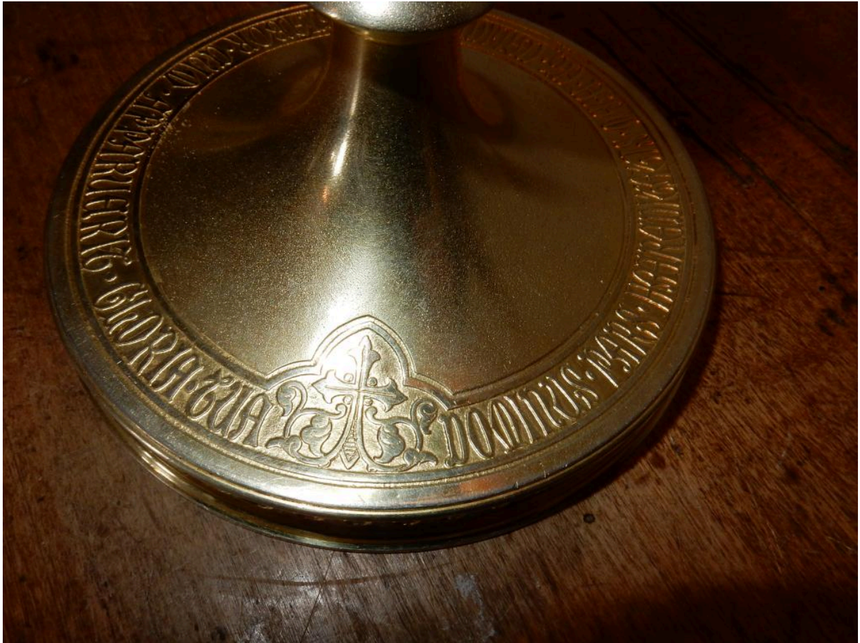
Détail des inscriptions sur le pied.