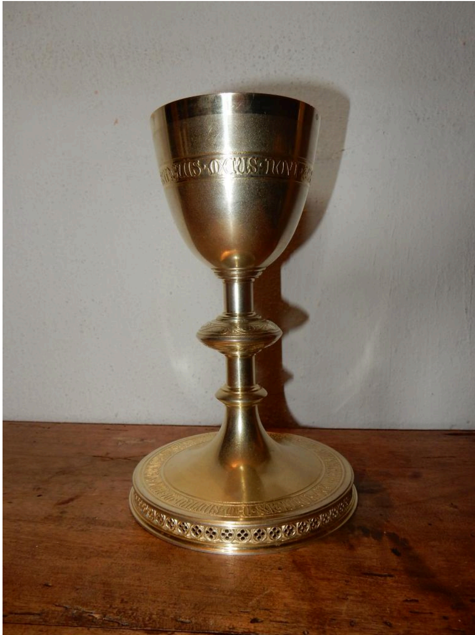
Vue d'ensemble du calice.