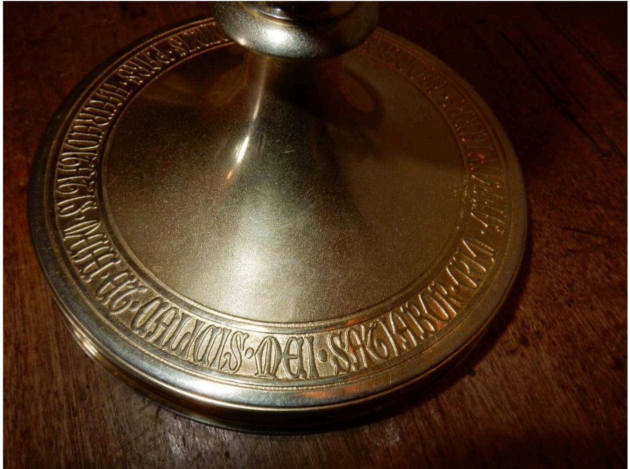
Détail des inscriptions sur le pied.