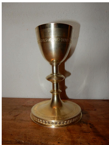
Vue d'ensemble du calice. IVR75_20228602050NUCA