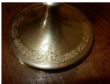
Détail des inscriptions sur le pied. IVR75_20228602051NUCA