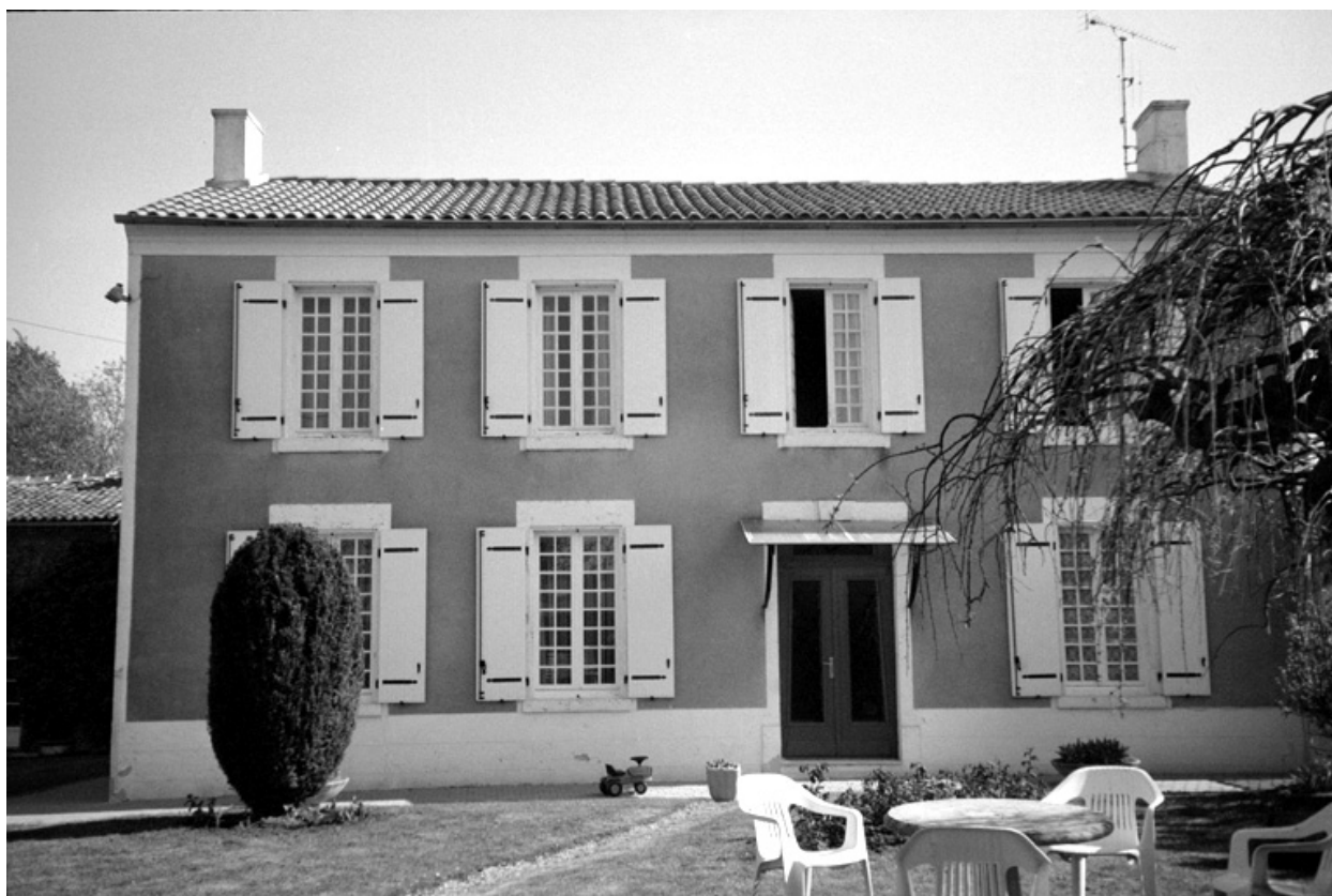
Le logement de la ferme.