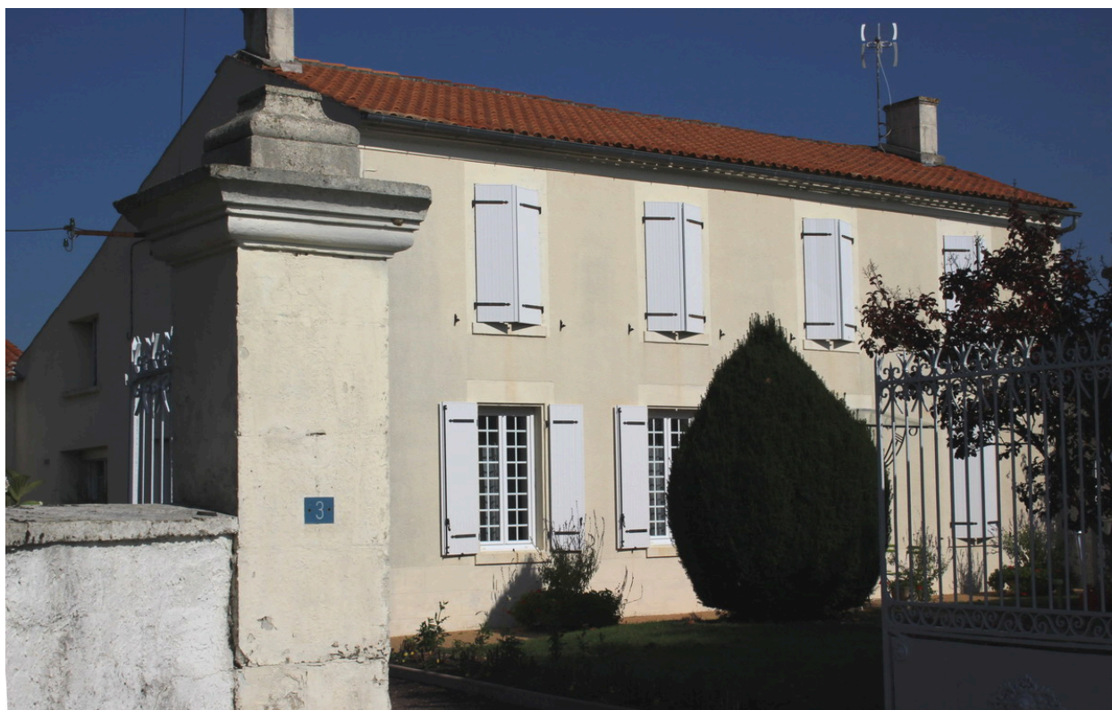
Une vue du logement de l'ancienne ferme, depuis le sud-ouest.