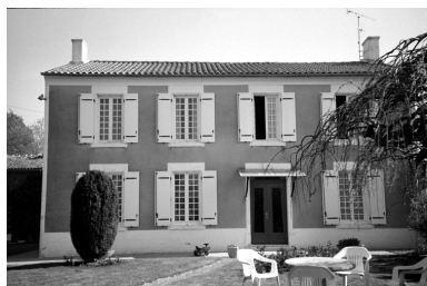
Le logement de la ferme. IVR54_20001705496Z