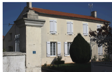
Une vue du logement de l'ancienne ferme, depuis le sud-ouest. IVR75_20181703291NUCA