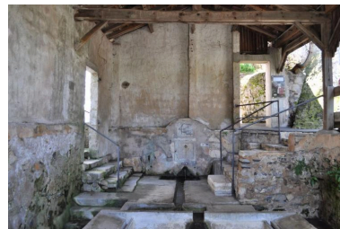
Vue de la fontaine depuis le bassin de lavage.