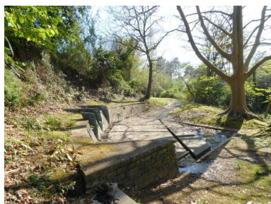
Vue de la fontaine et de la promenade.