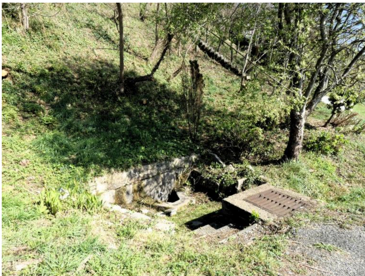
Vue d'ensemble depuis le chemin.