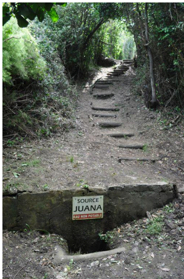
Vue de la source Juana depuis le chemin du littoral. IVR72_20186402001NUC2A