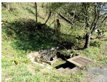
Vue d'ensemble depuis le chemin.