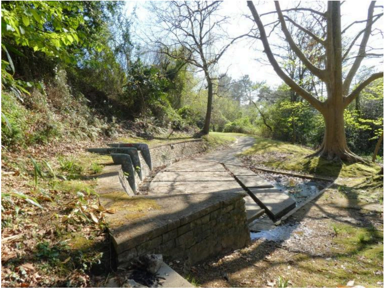
Vue de la fontaine et de la promenade.