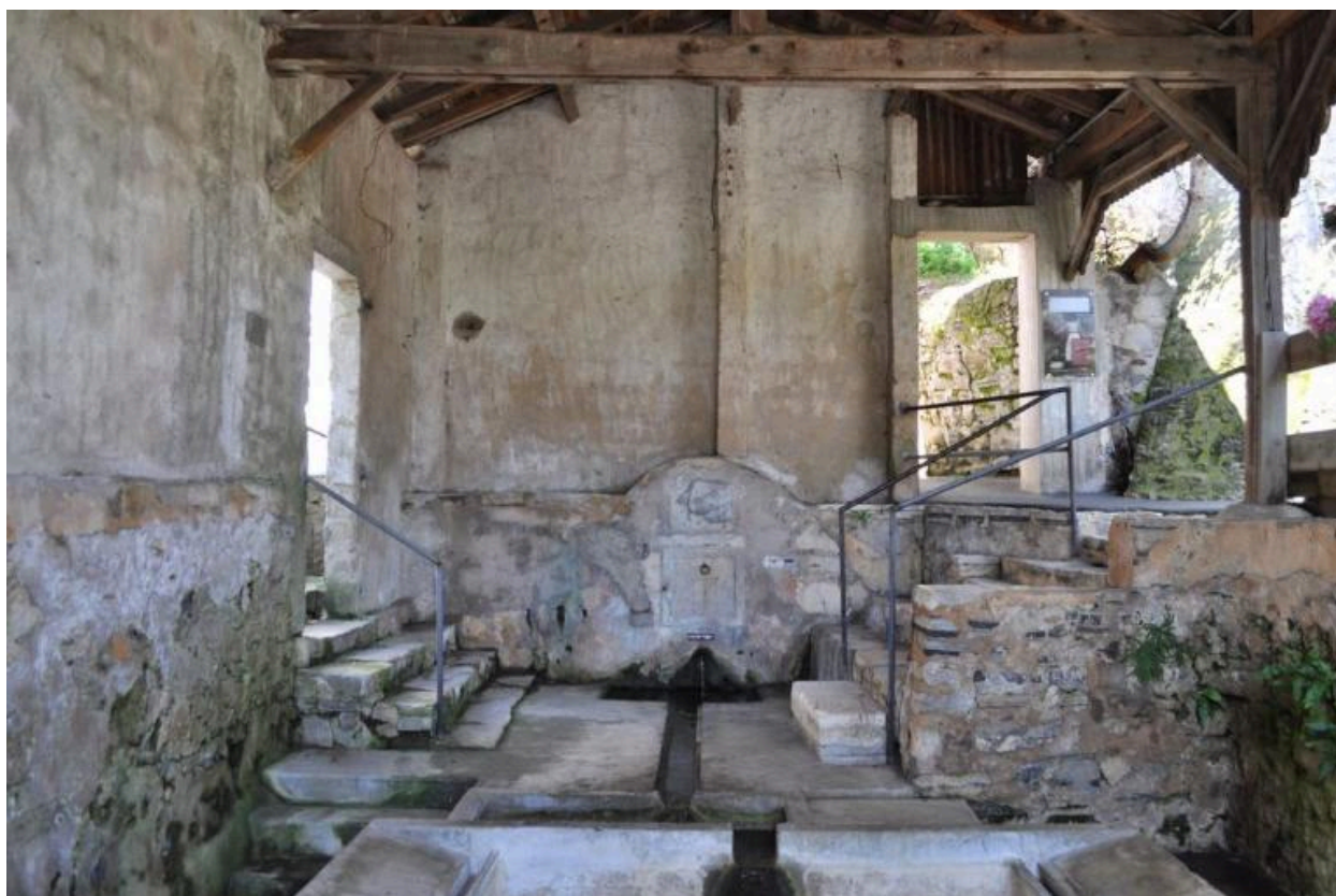
Vue de la fontaine depuis le bassin de lavage.