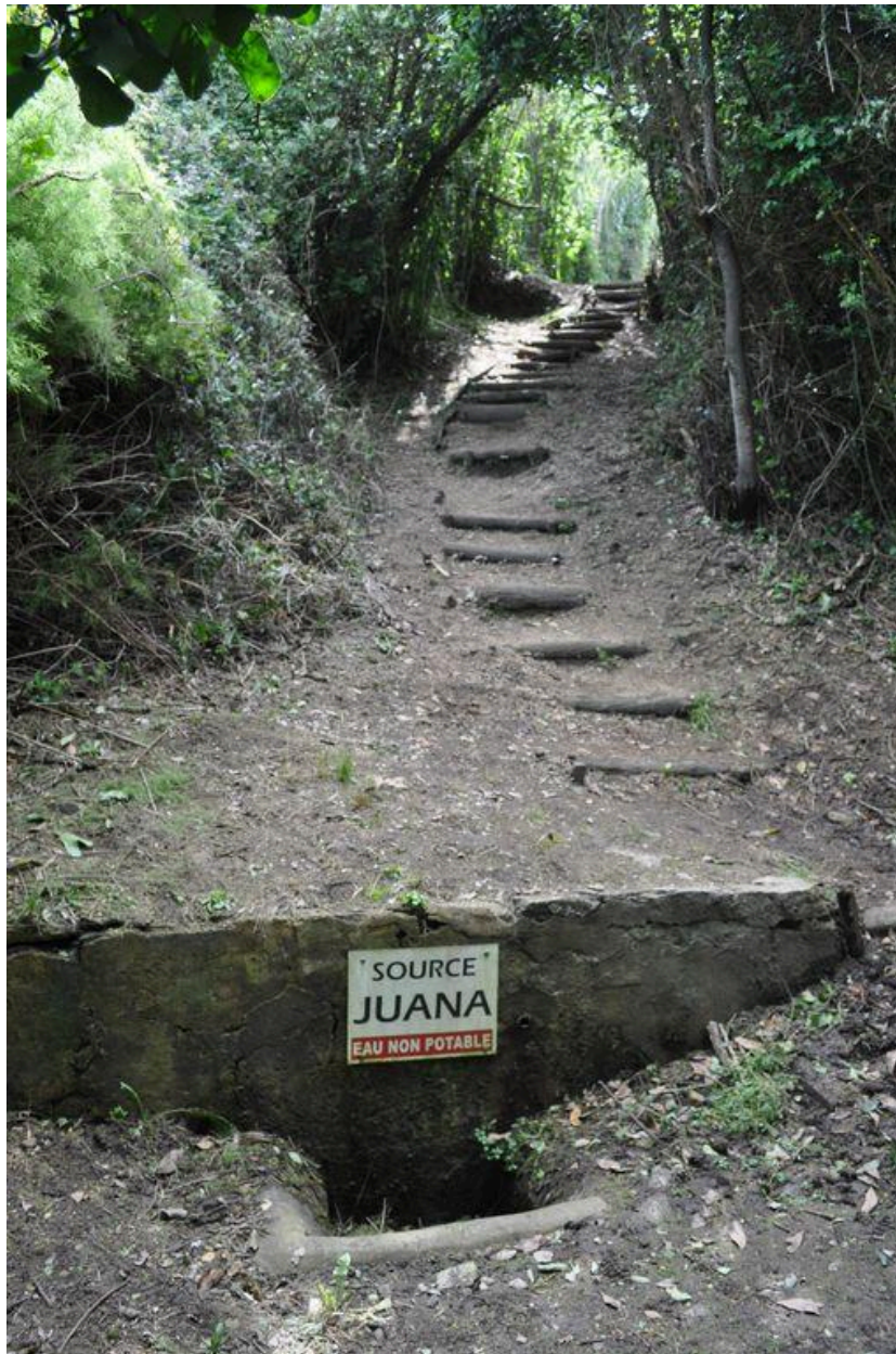
Vue de la source Juana depuis le chemin du littoral.