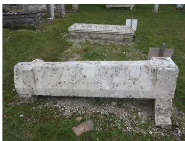
La pierre tombale d'Alexis Gaborit.