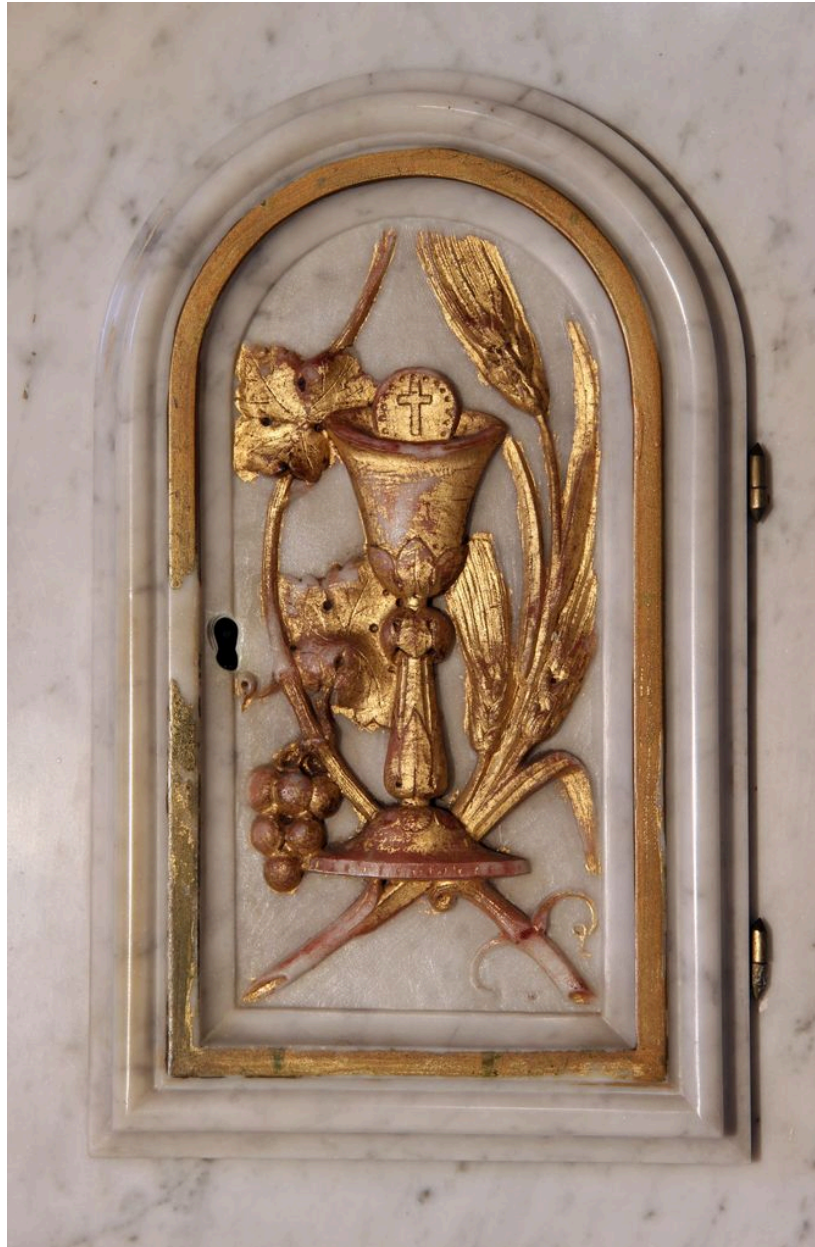
Détail du tabernacle : porte.