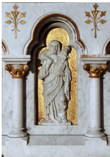
Détail du tombeau d'autel : relief du Bon Pasteur.