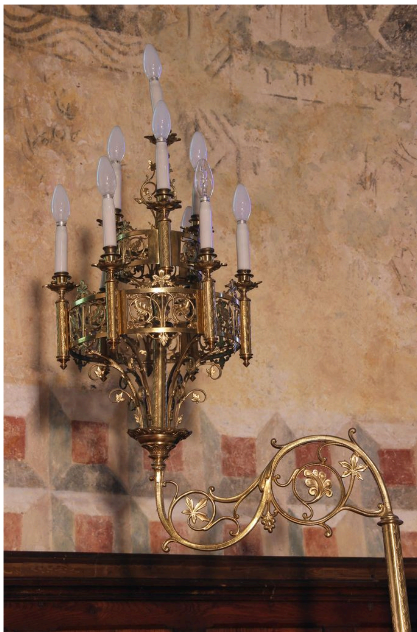
Détail : couronne de lumière.