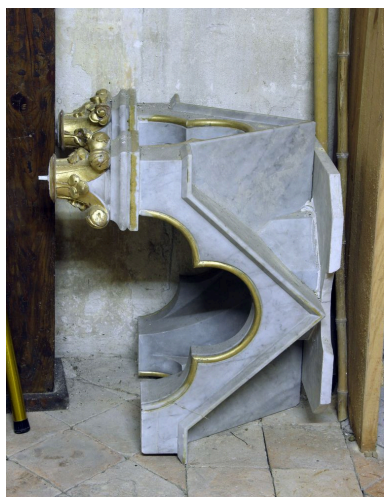
Détail : élément du dais d'exposition déposé. IVR72_20194001186NUC2A