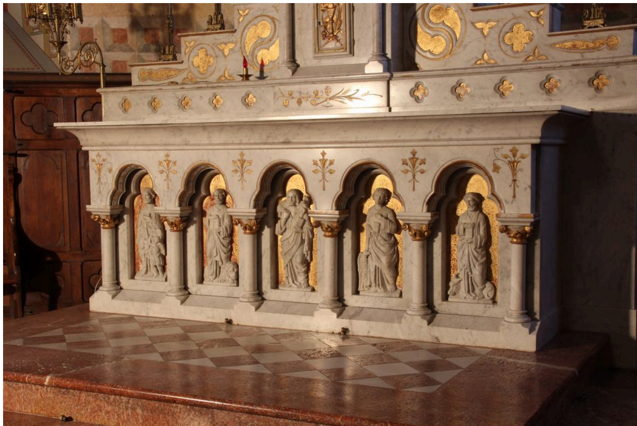
Détail : tombeau d'autel.