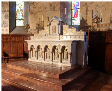
Ensemble. IVR72_20194001181NUC2A