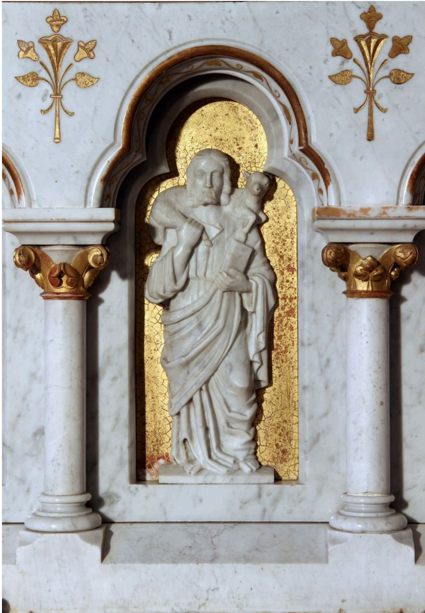
Détail du tombeau d'autel : relief du Bon Pasteur.