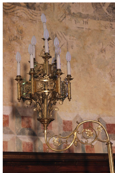
Détail : couronne de lumière. IVR72_20194001185NUC2A