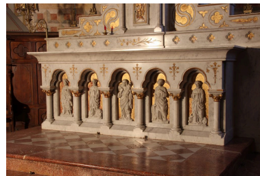
Détail : tombeau d'autel.