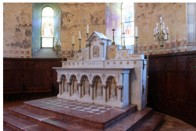
Ensemble. IVR72_20194001180NUC2A