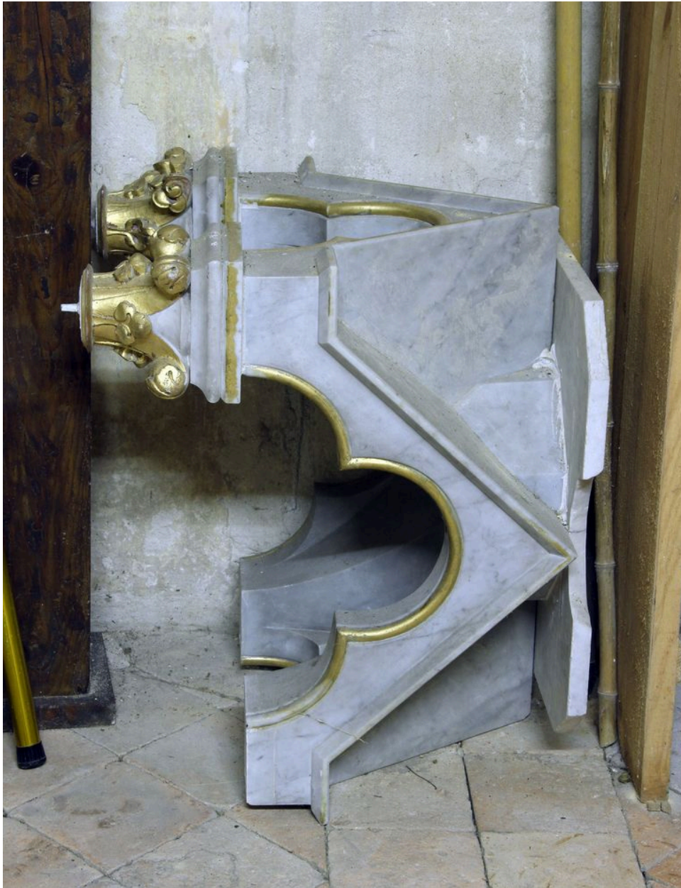
Détail : élément du dais d'exposition déposé.