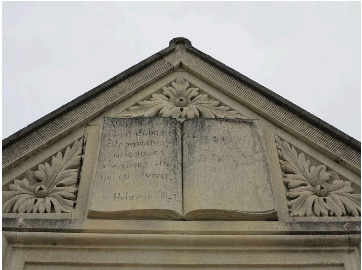
Détail du fronton.