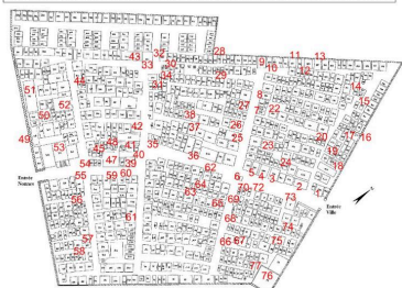
Schéma de répartition des tombeaux recensés dans le cimetière de Meschers. IVR54_20141706385NUCA