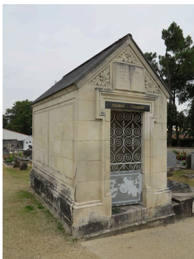
La chapelle funéraire.