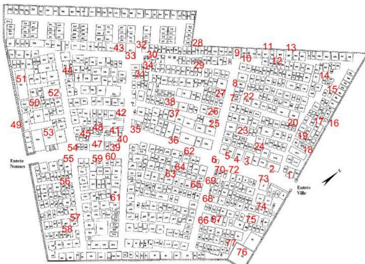
Schéma de répartition des tombeaux recensés dans le cimetière de Meschers.