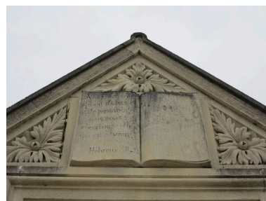
Détail du fronton.