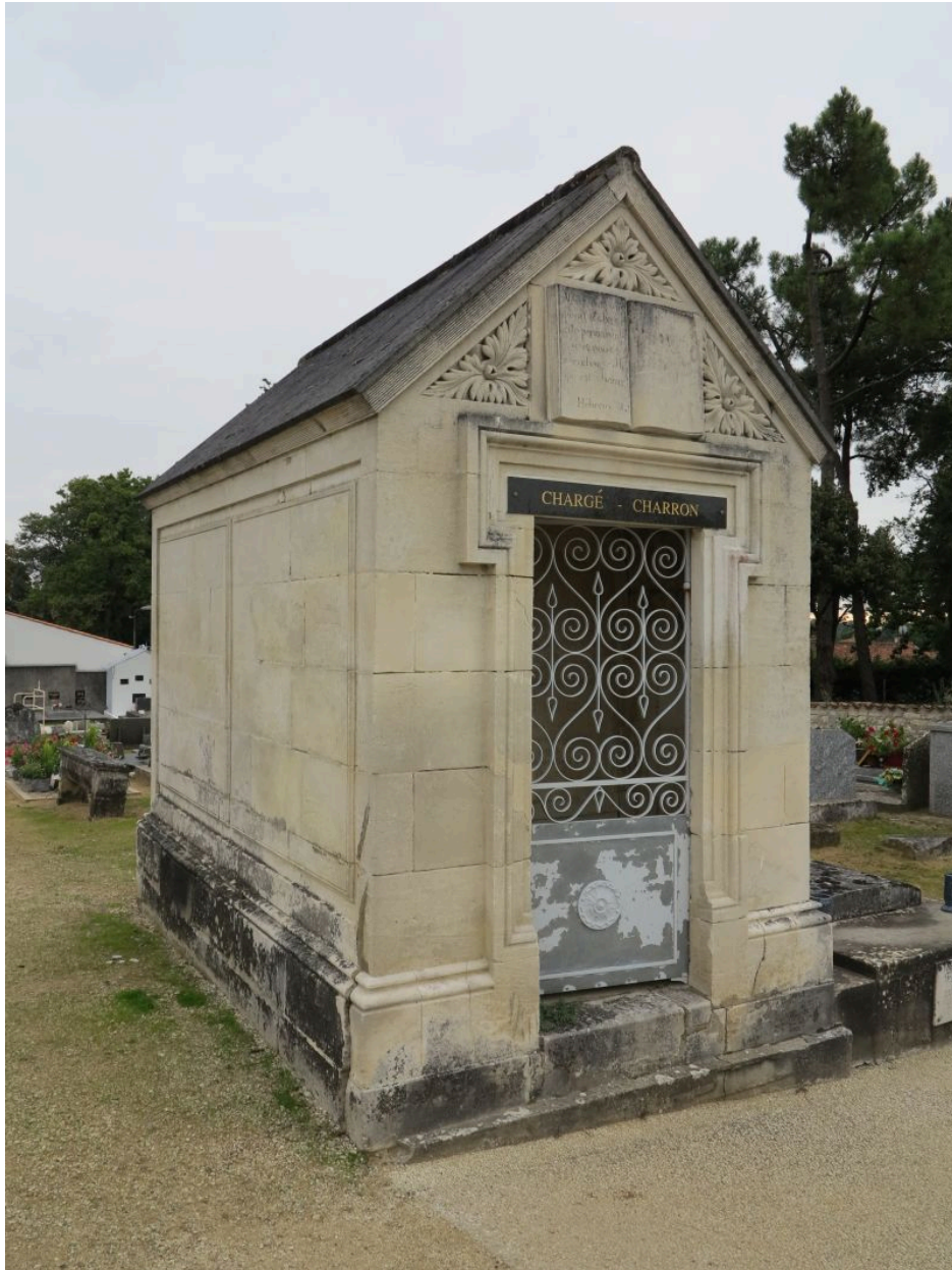
La chapelle funéraire.