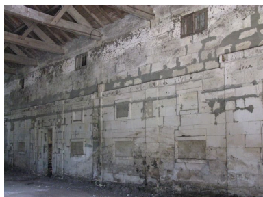
Mur intérieur est du bâtiment principal. IVR54_20121704916NUCA