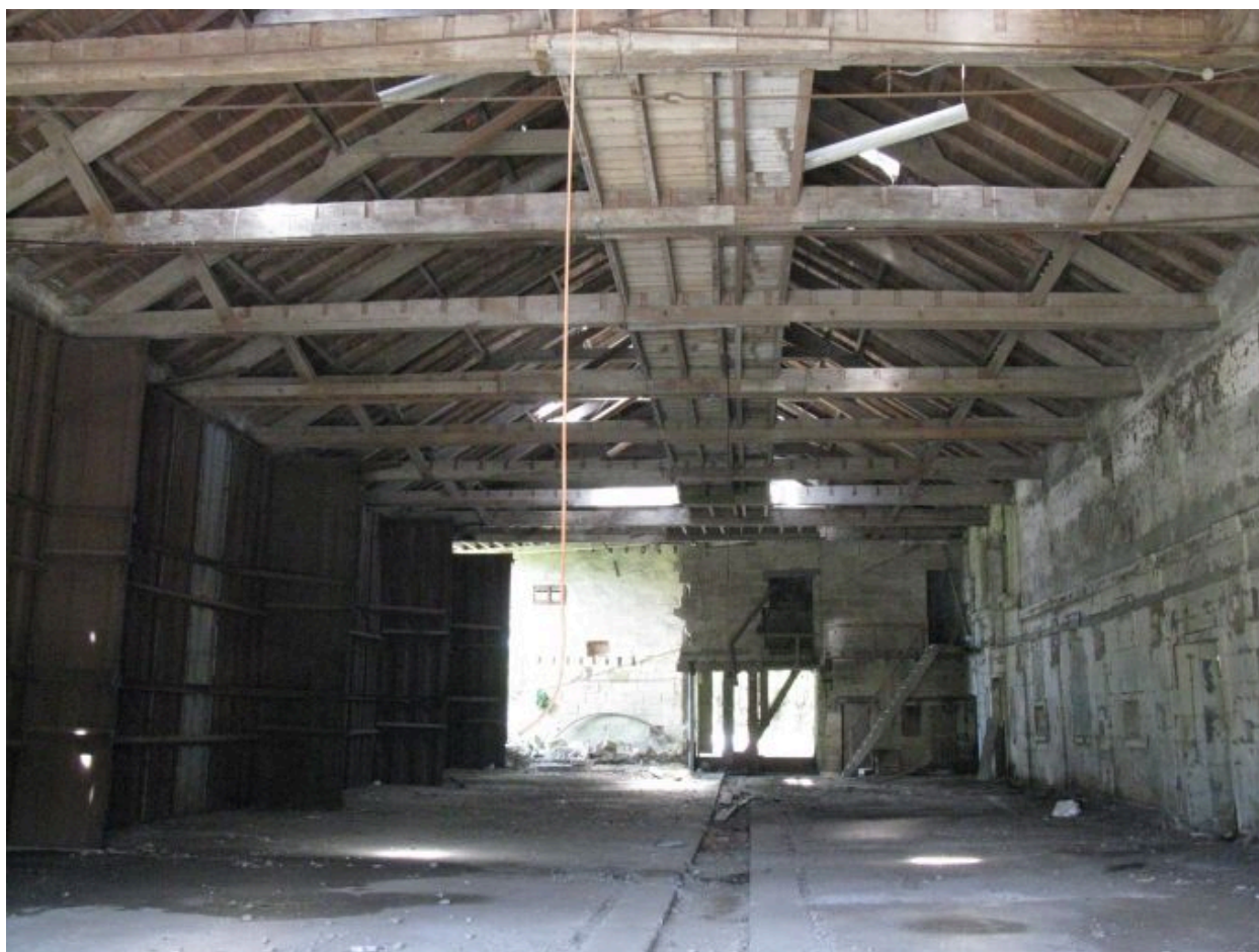
Intérieur du bâtiment principal.