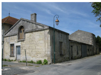
Les bâtiments le long de la rue de l'Uzet.