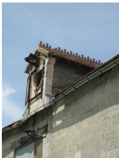
La lucarne. IVR54_20121704913NUCA