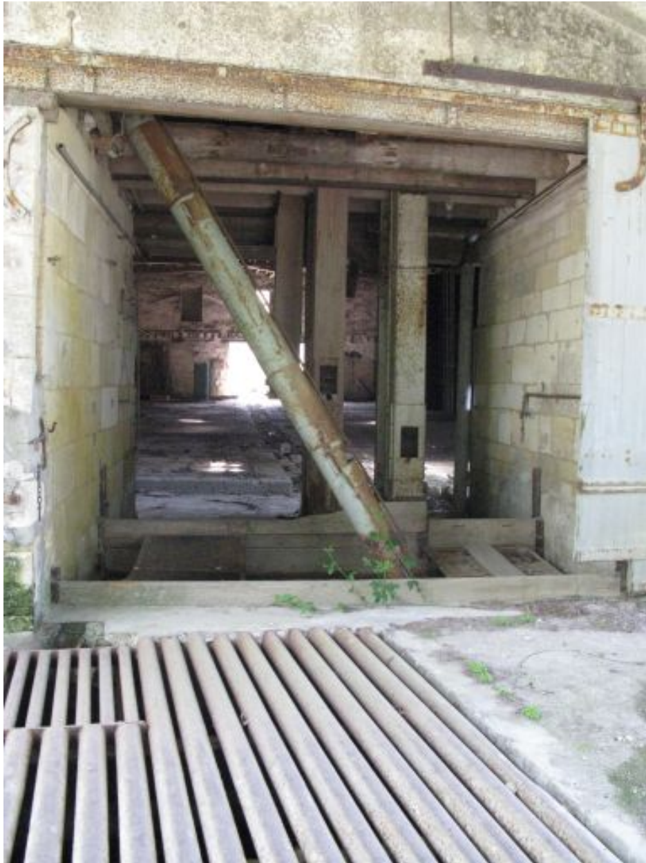
Vue depuis le hangar au nord.