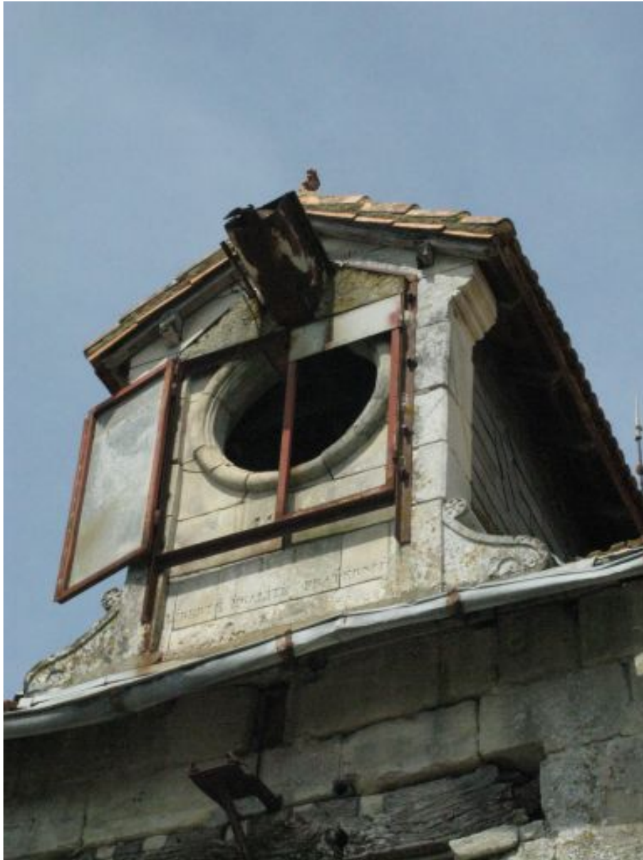
La lucarne et ses inscriptions.