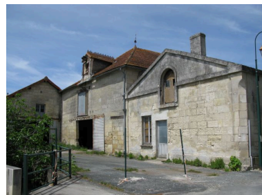
L'ancienne usine devenue entrepôt, vue depuis le sud-est.