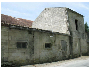
Les bâtiments le long de la rue de l'Uzet.