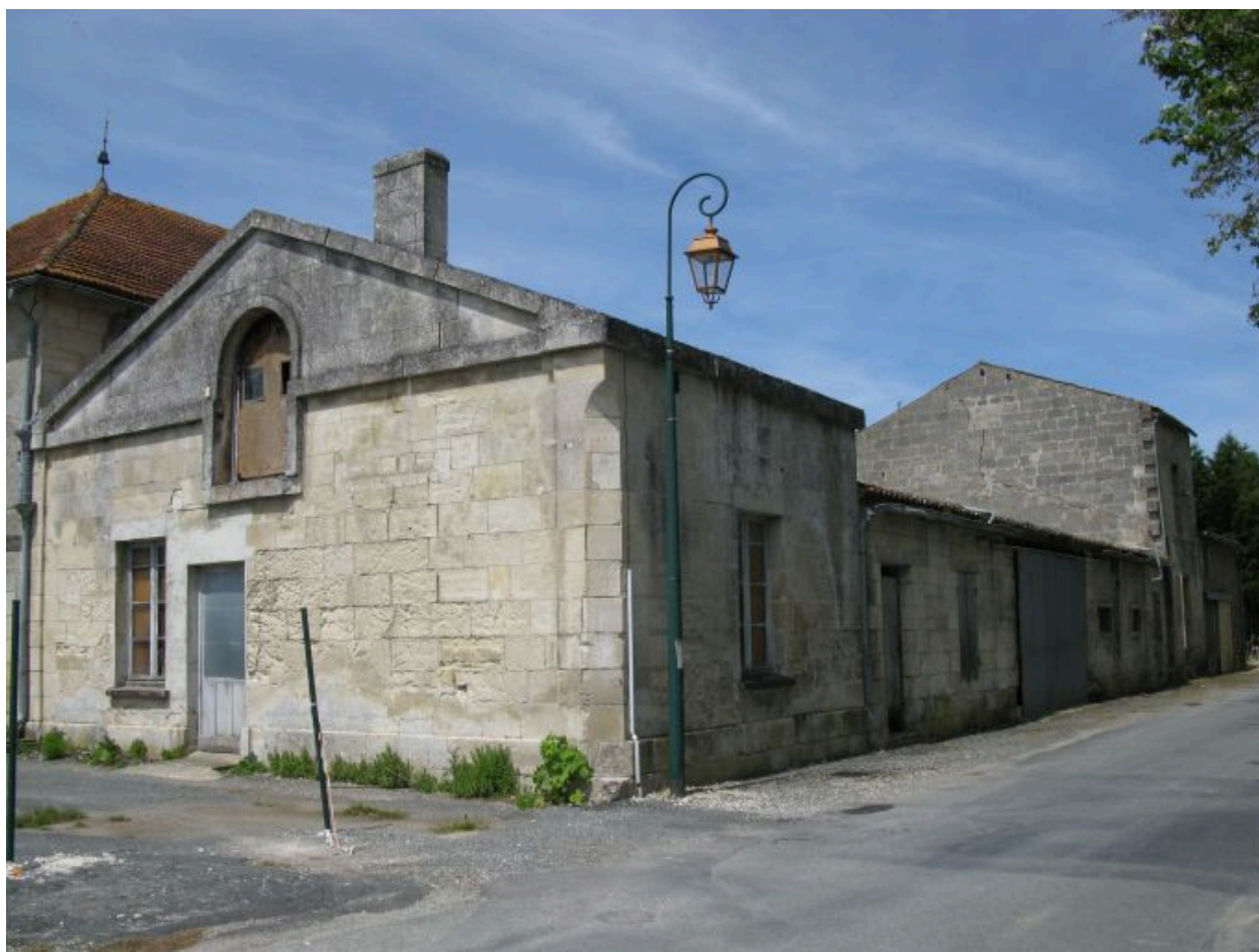
Les bâtiments le long de la rue de l'Uzet.