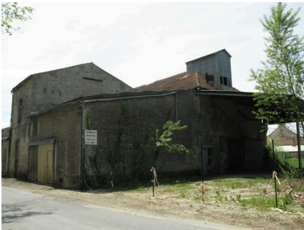
Les bâtiments vus depuis le nord-est.