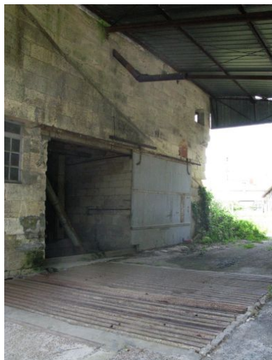
Entrée des grains sous le hangar au nord.