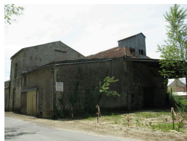
Les bâtiments vus depuis le nord-est.