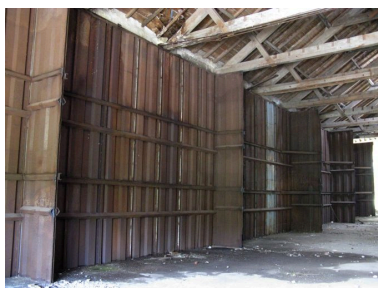
Restes de silos en métal à l'intérieur du bâtiment principal.