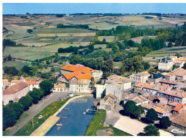
L'entrepôt, ancienne usine, au centre, sur une vue aérienne vers 1960.