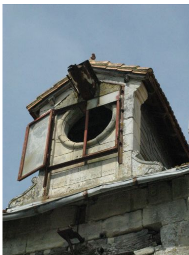
La lucarne et ses inscriptions.