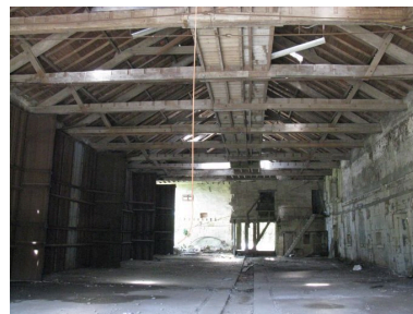
Intérieur du bâtiment principal.