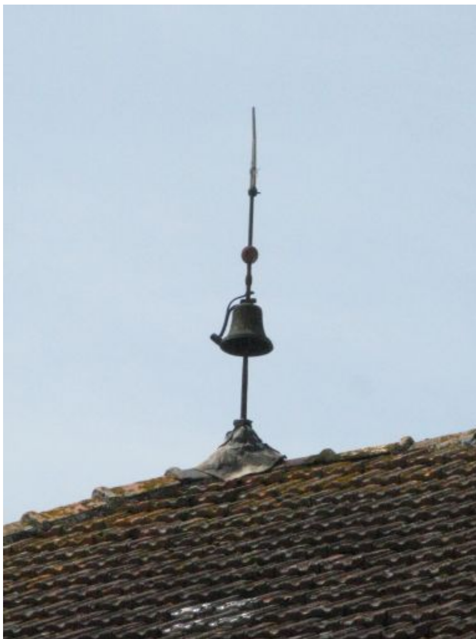
La cloche au-dessus de la croupe de toit sud.