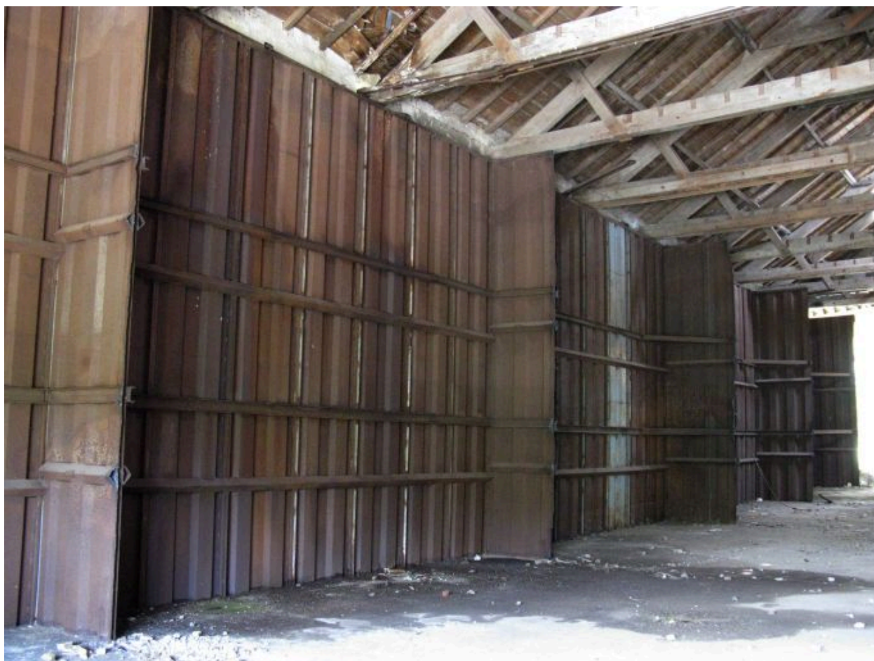
Restes de silos en métal à l'intérieur du bâtiment principal.