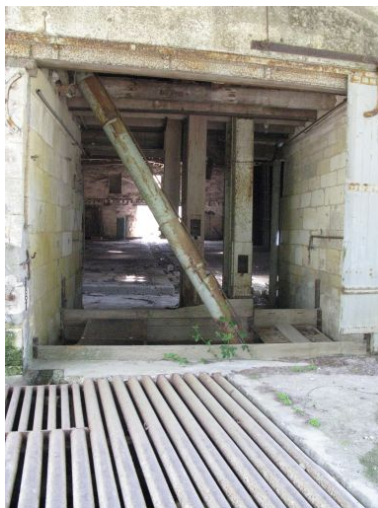
Vue depuis le hangar au nord. IVR54_20121704907NUCA