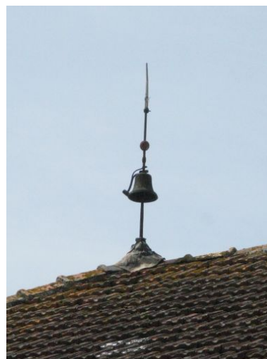
La cloche au-dessus de la croupe de toit sud.