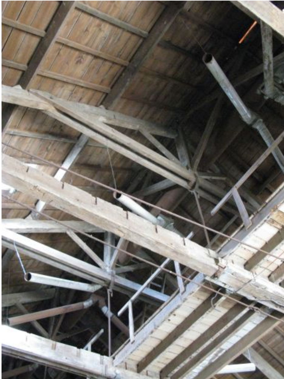
Vis sans fin et tuyaux au faîtage du bâtiment principal.