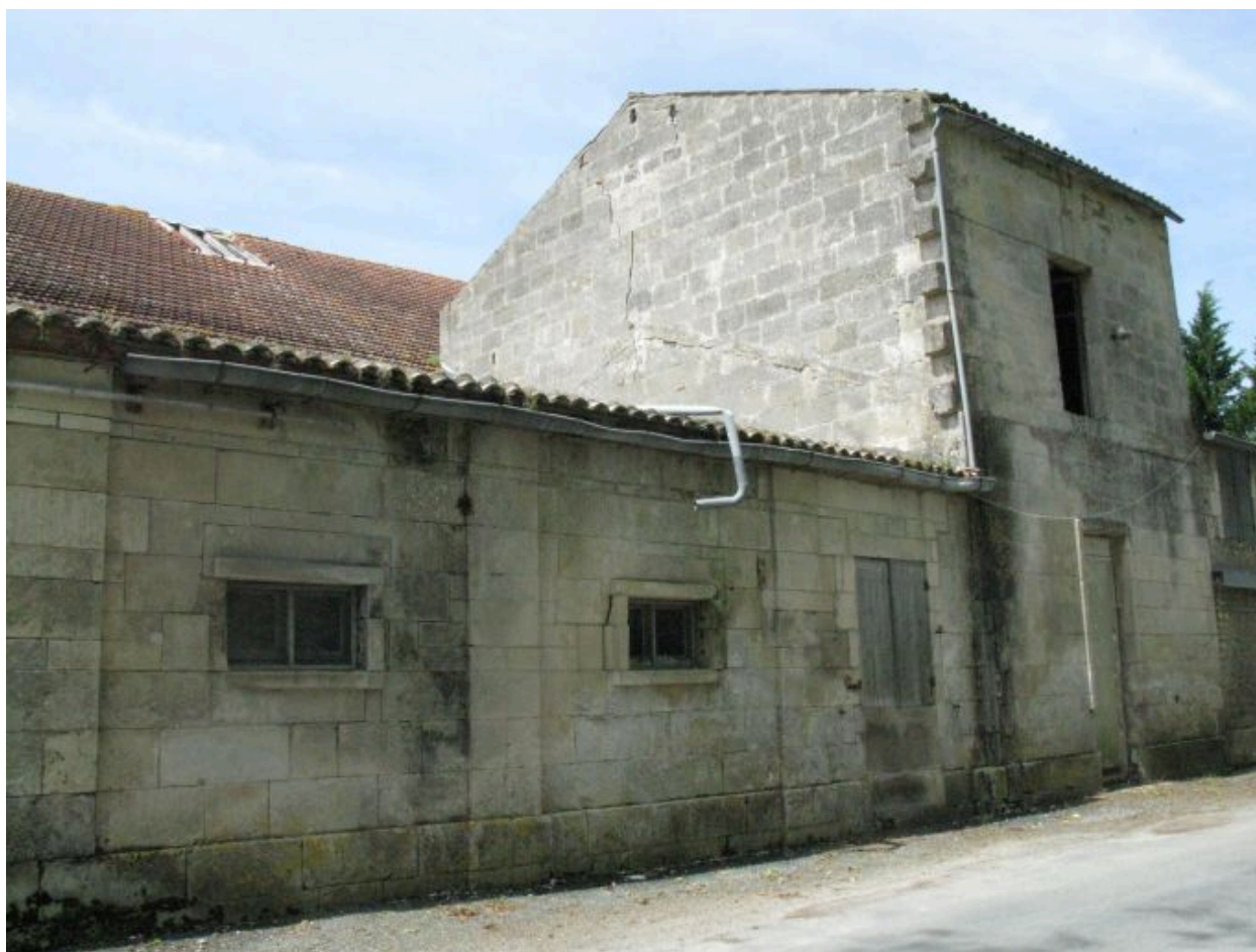
Les bâtiments le long de la rue de l'Uzet.