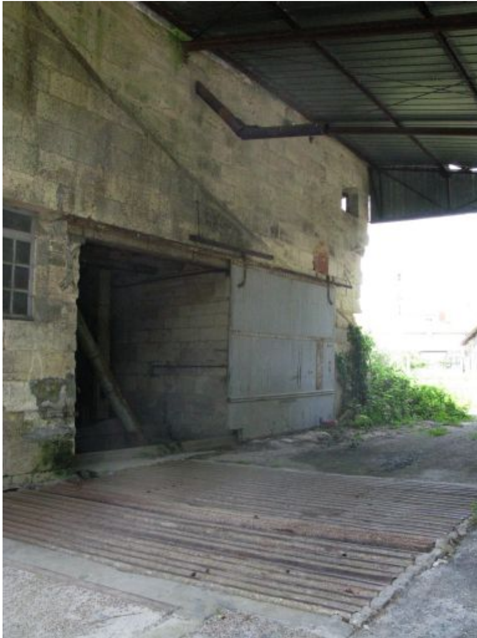
Entrée des grains sous le hangar au nord.