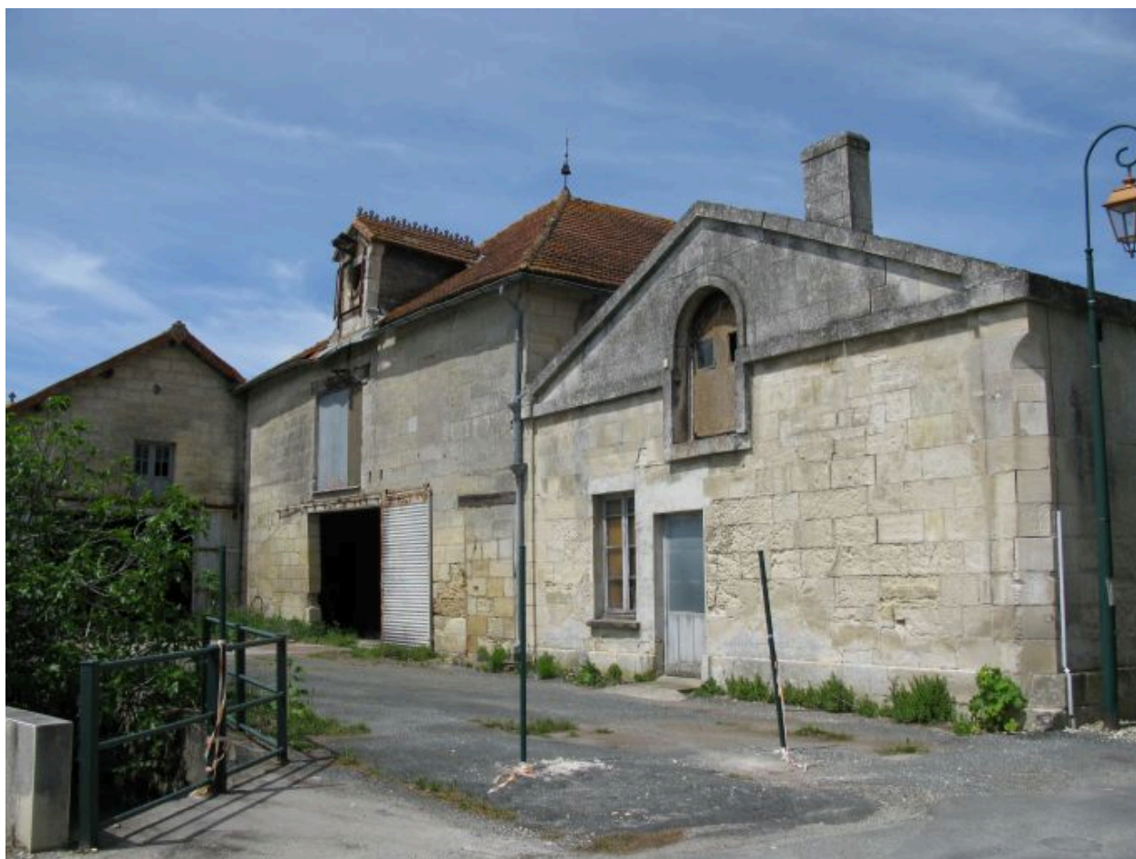
L'ancienne usine devenue entrepôt, vue depuis le sud-est.