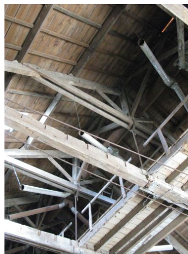
Vis sans fin et tuyaux au faitage du bâtiment principal. IVR54_20121704981NUCA