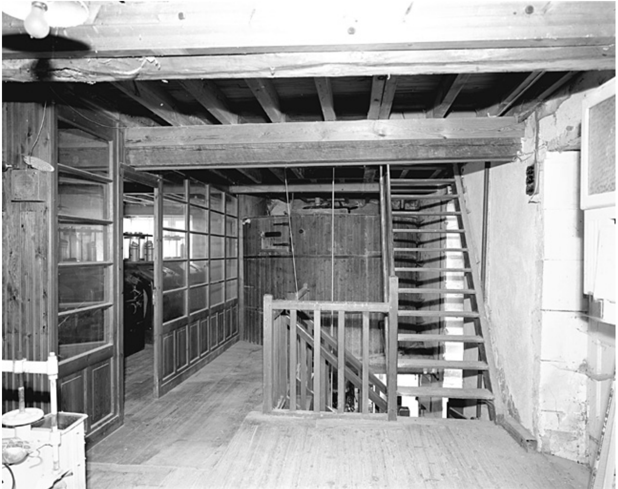
Premier étage de l'atelier de fabrication.