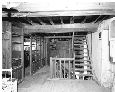
Premier étage de l'atelier de fabrication. IVR54_19991701707V