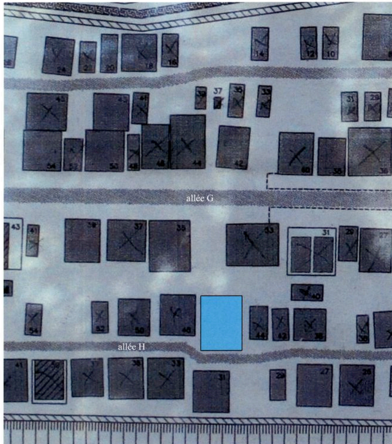
Plan de situation (ensemble et détail).