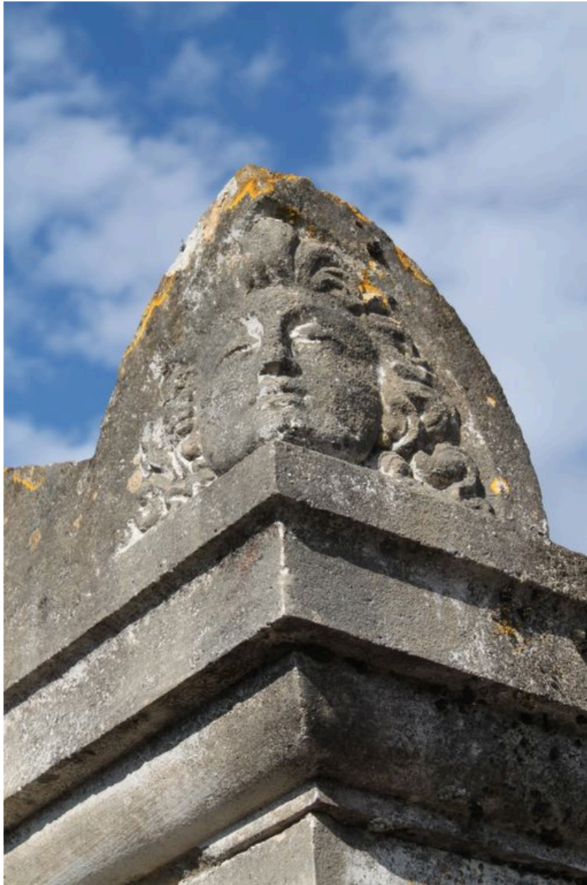
Masque en acrotère.