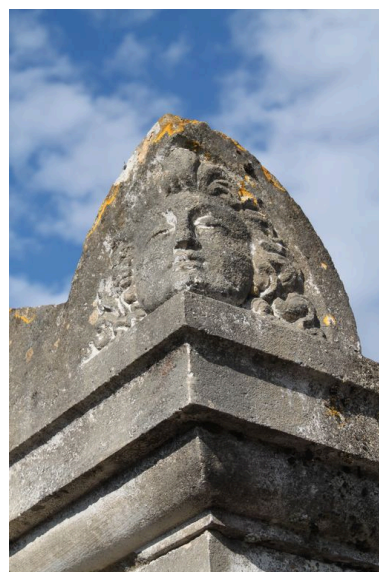
Masque en acrotère.

IVR72_20124000624NUC2A