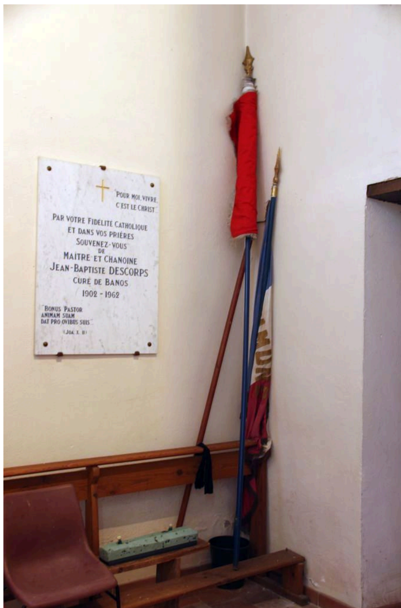
Drapeaux tricolores près de la plaque commémorative du chanoine Descorps à proximité du tableau commémoratif des morts, à l'entrée de l'église.