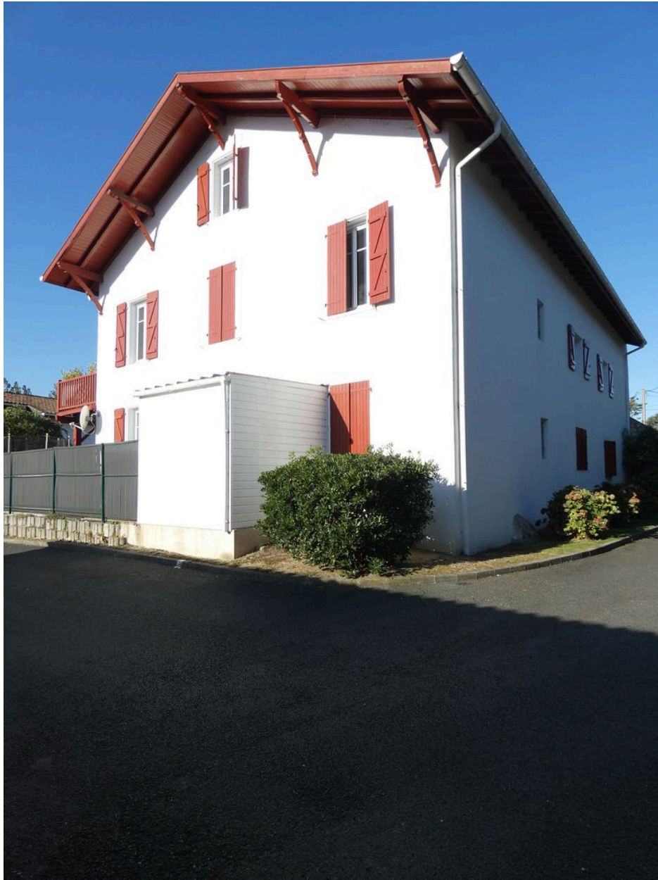
Maison Jauregia, aujourd'hui immeuble à logements.