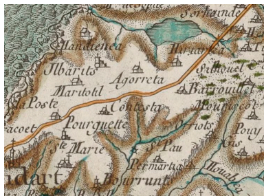
Détail de la carte de Cassini.