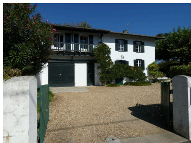
Maison Dendabarats IVR72_20196403269NUC2A