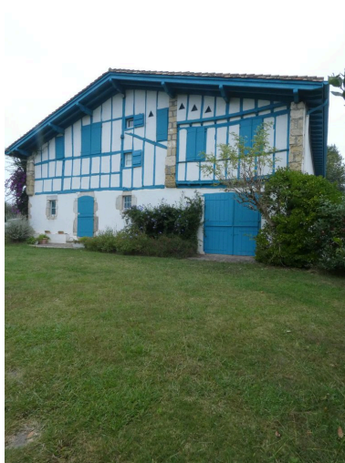
Maison Hirigoiena IVR72_20196403062NUC2A