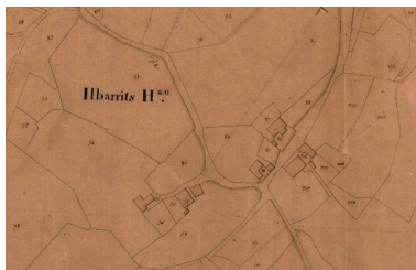
Plan cadastral de 1831, détail, section A.