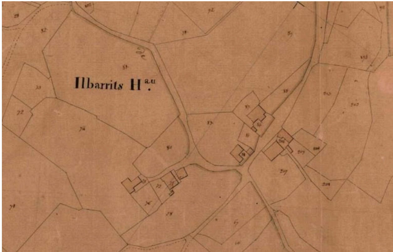
Plan cadastral de 1831, détail, section A.