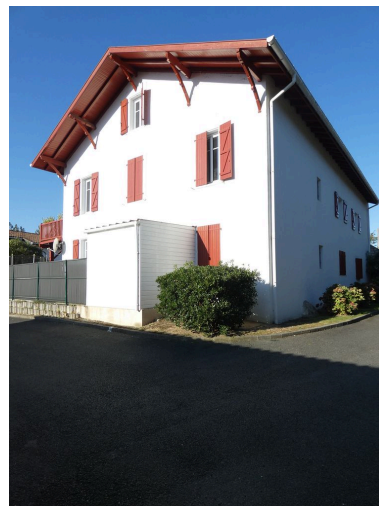
Maison Jauregia, aujourd'hui immeuble à logements. IVR72_20196403905NUC2A