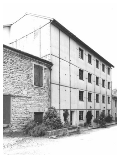
Vue de l'atelier de fabrication prise du sud-ouest. IVR54_19991701711V