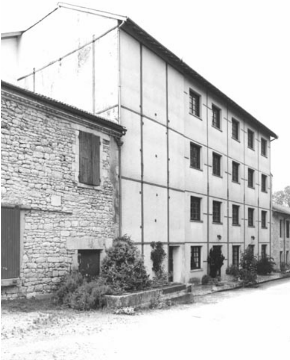
Vue de l'atelier de fabrication prise du sud-ouest.