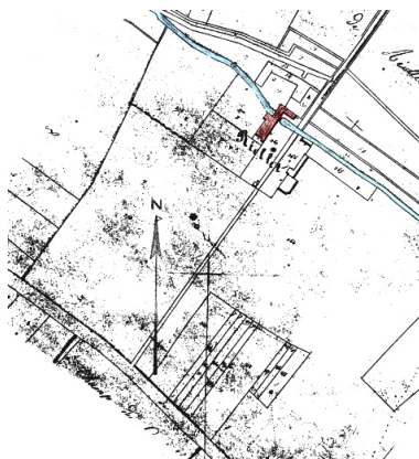
Plan masse d'après le plan cadastral de 1836, section A1, éch. 1/2500. IVR54_20061710111NUDA