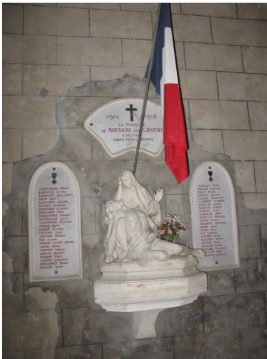
Vue d'ensemble du tableau commémoratif.