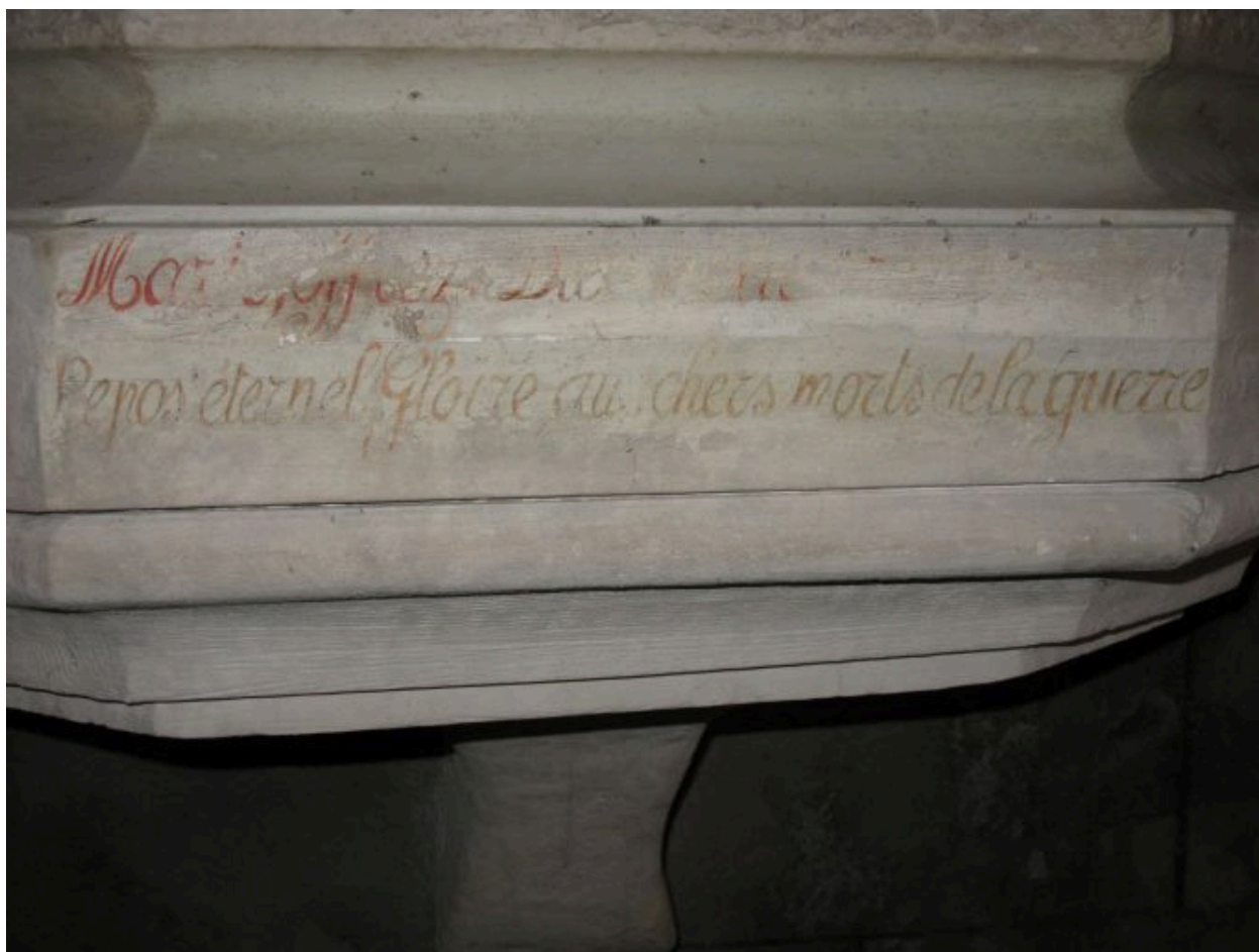
Inscription sur le socle de la statue.