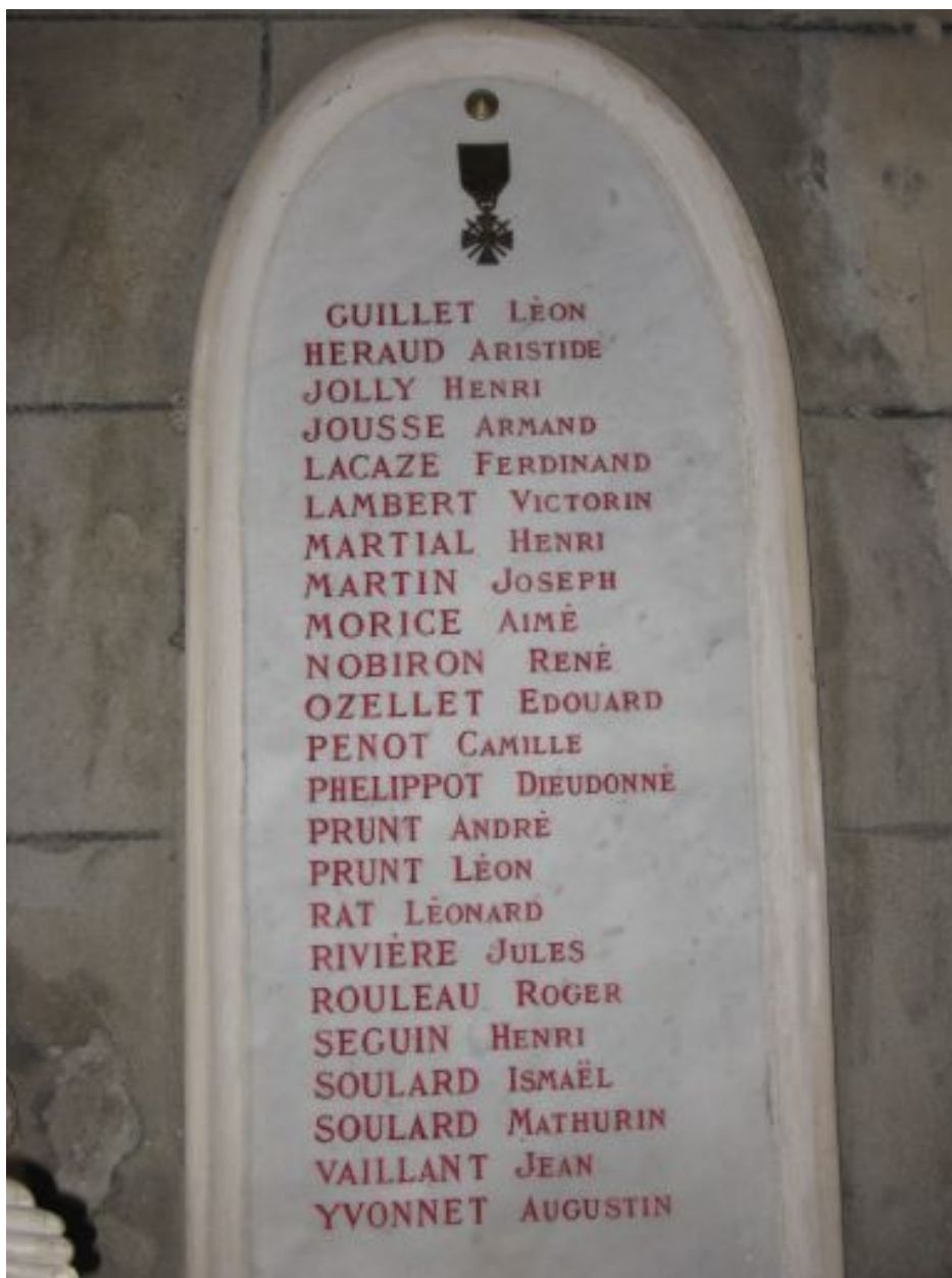
Panneau de droite.