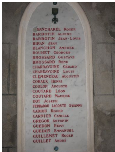
Panneau de gauche.