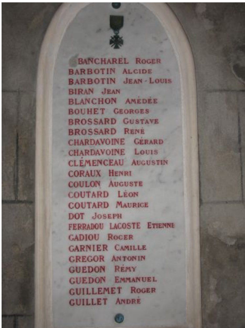
Panneau de gauche.