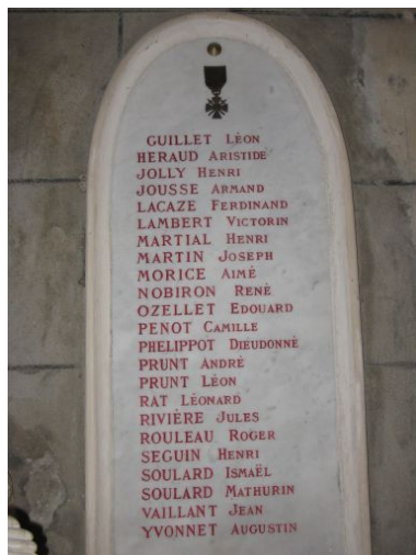
Panneau de droite.