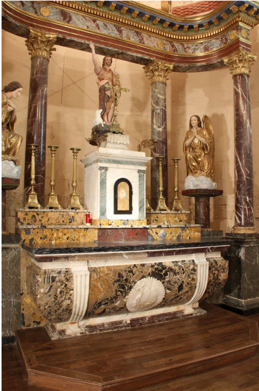
Ensemble (sur le maître-autel).