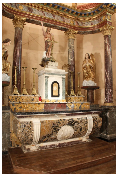
Ensemble (sur le maître-autel). IVR72_20144001661NUC2A