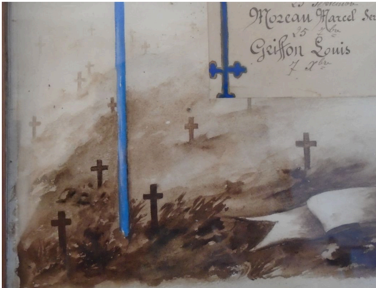
Détail du décor : tombes.