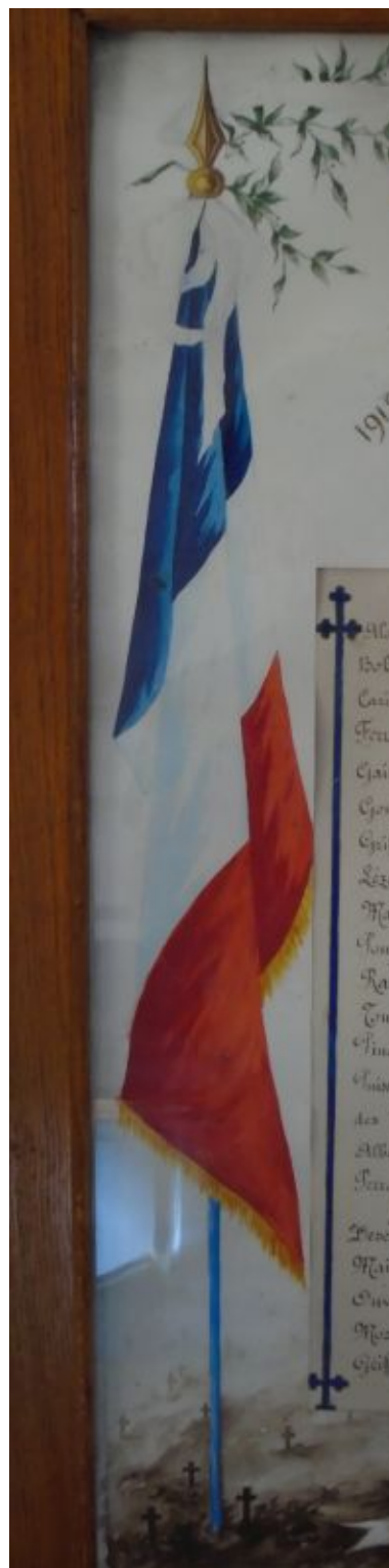
Détail du décor : drapeau. IVR54_20178602760NUCA