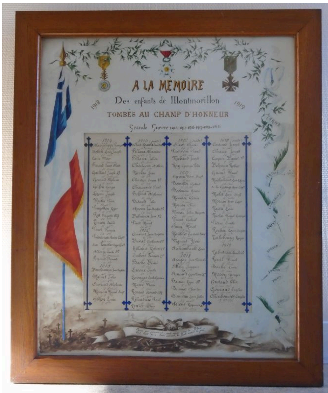
Tableau des morts peint, provenant de l'église Saint-Martial.