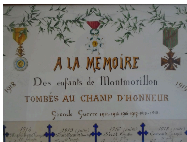
Détail du décor : dédicace et médailles militaires.