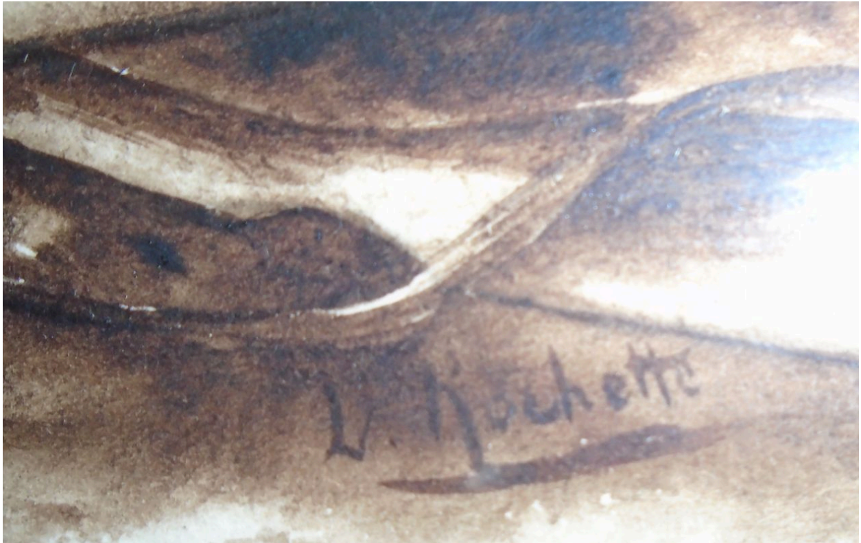
Signature L. Rochette.