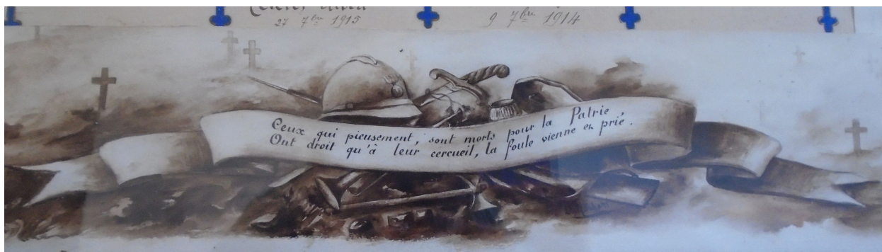
Détail du décor : phylactère en bas du tableau.