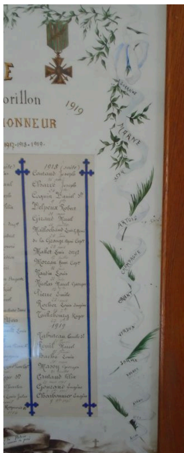
Détail du décor : noms de batailles intercalés avec des palmes et des rameaux. IVR54_20178602759NUCA