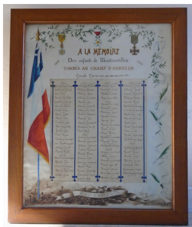
Tableau des morts peint, provenant de l'église Saint-Martial.