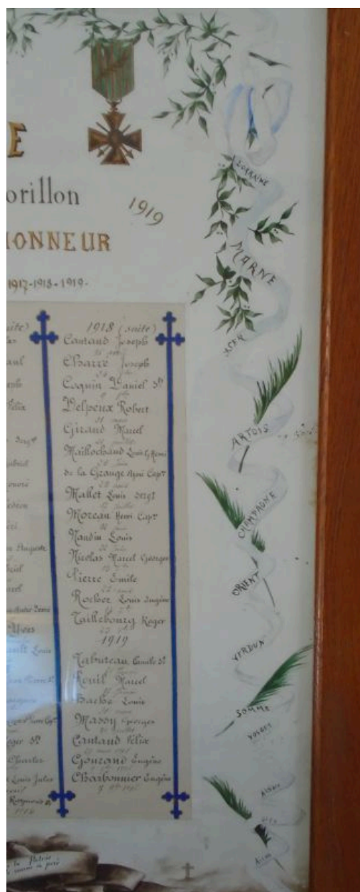
Détail du décor : noms de batailles intercalés avec des des palmes et des rameaux.