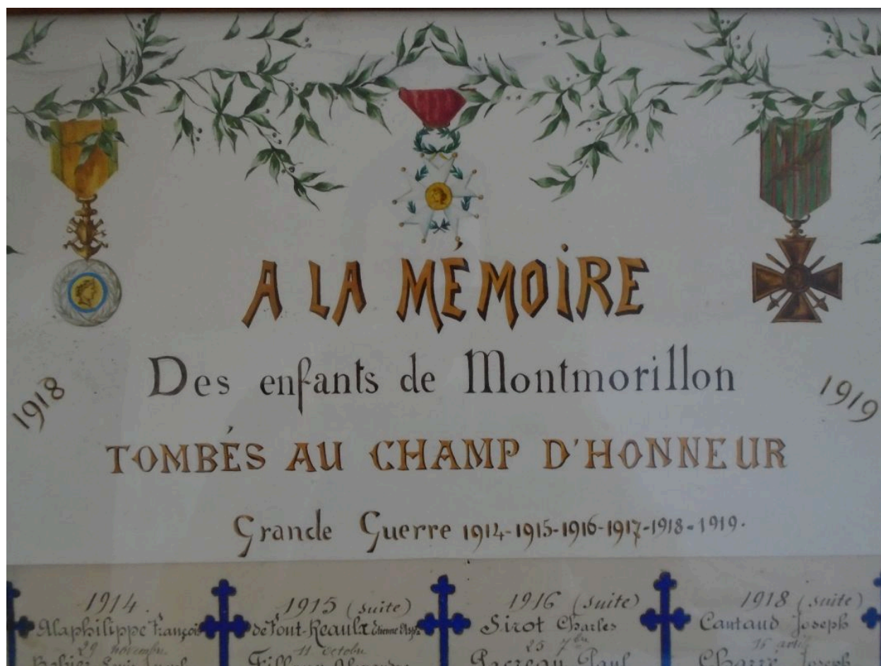
Détail du décor : dédicace et médailles militaires.