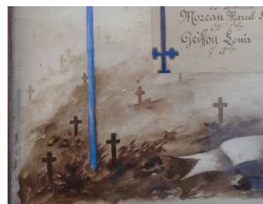
Détail du décor : tombes. IVR54_20178602758NUCA