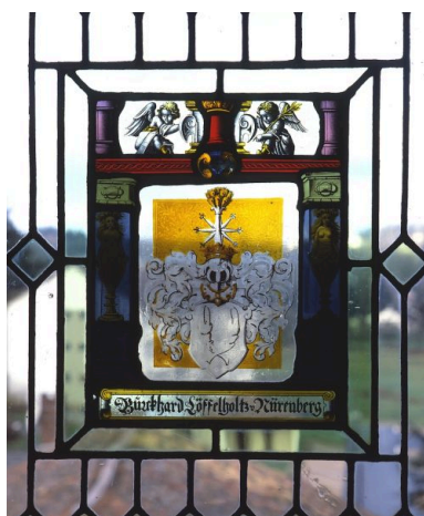
Panneau inférieur gauche : panneau héraldique.