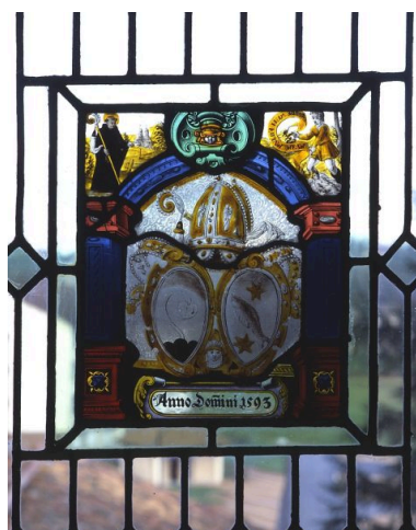
Panneau inférieur droit : panneau héraldique.