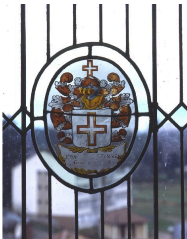
Panneau supérieur droit : rondel héraldique.