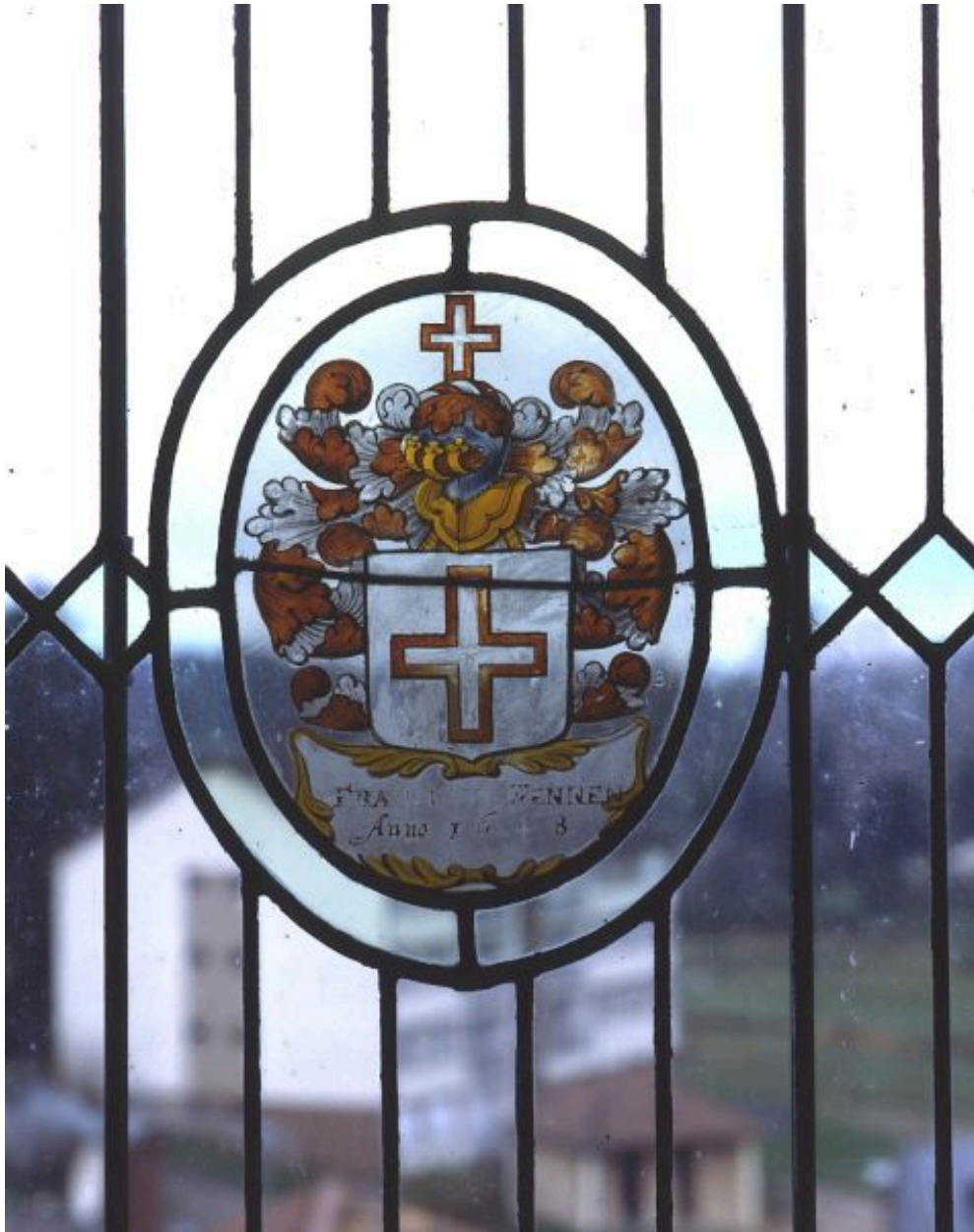
Panneau supérieur droit : rondel héraldique.