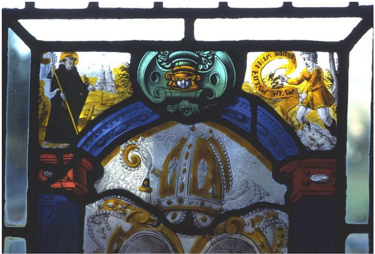
Panneau inférieur droit : détail de la résurrection de l'enfant.