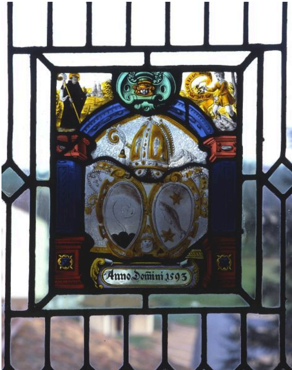
Panneau inférieur droit : panneau héraldique.