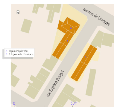
Plan masse, plan schématique des toitures. IVR54_20047905452NUDA