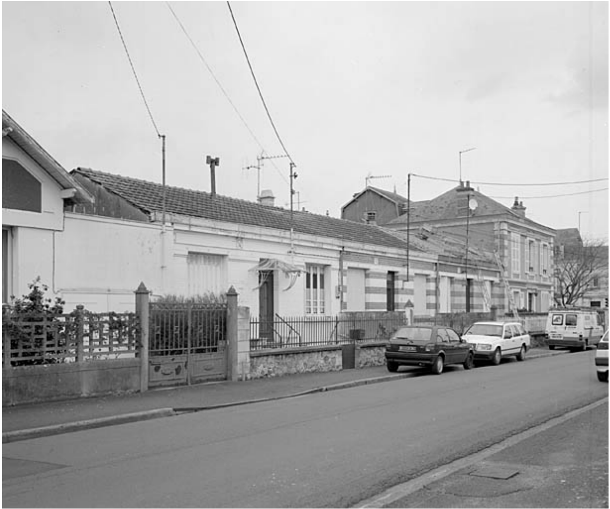
Logement patronal et logements d'ouvriers de la rue Baujet (côté ouest).