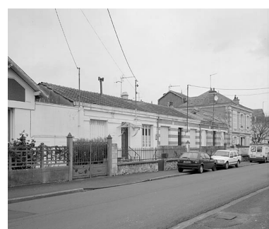
Logement patronal et logements d'ouvriers de la rue Baujet (côté ouest). IVR54_20017900908V