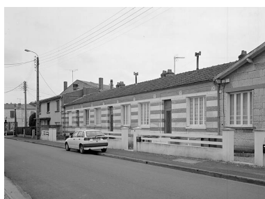
Logements d'ouvriers de la rue Baujet (côté est).