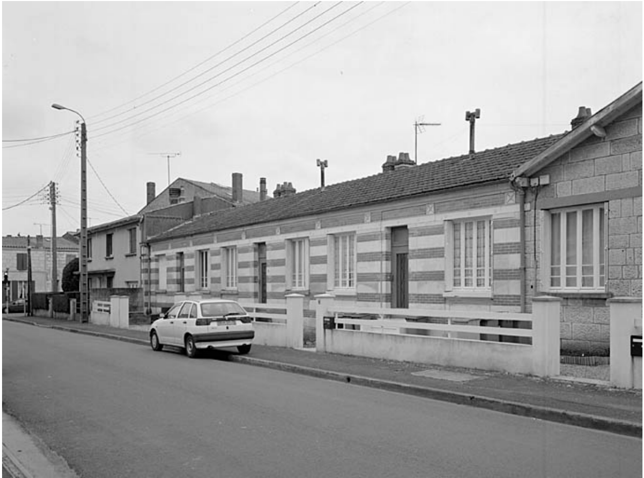
Logements d'ouvriers de la rue Baujet (côté est).