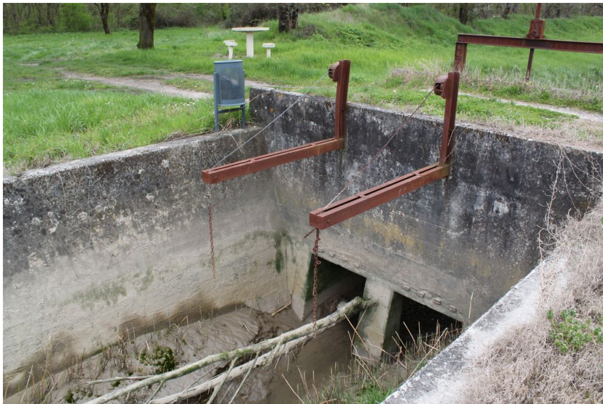
Détail des clapets.