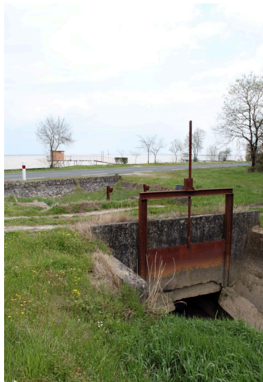
Détail de la pelle à crémaillère.