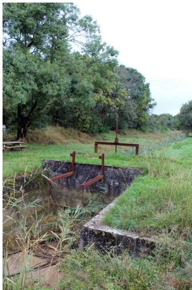
Vue d'ensemble. IVR72_20163301971NUC2A