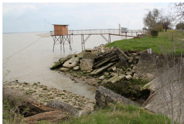
Débouché du ruisseau dans l'estuaire. IVR72_20163301974NUC2A