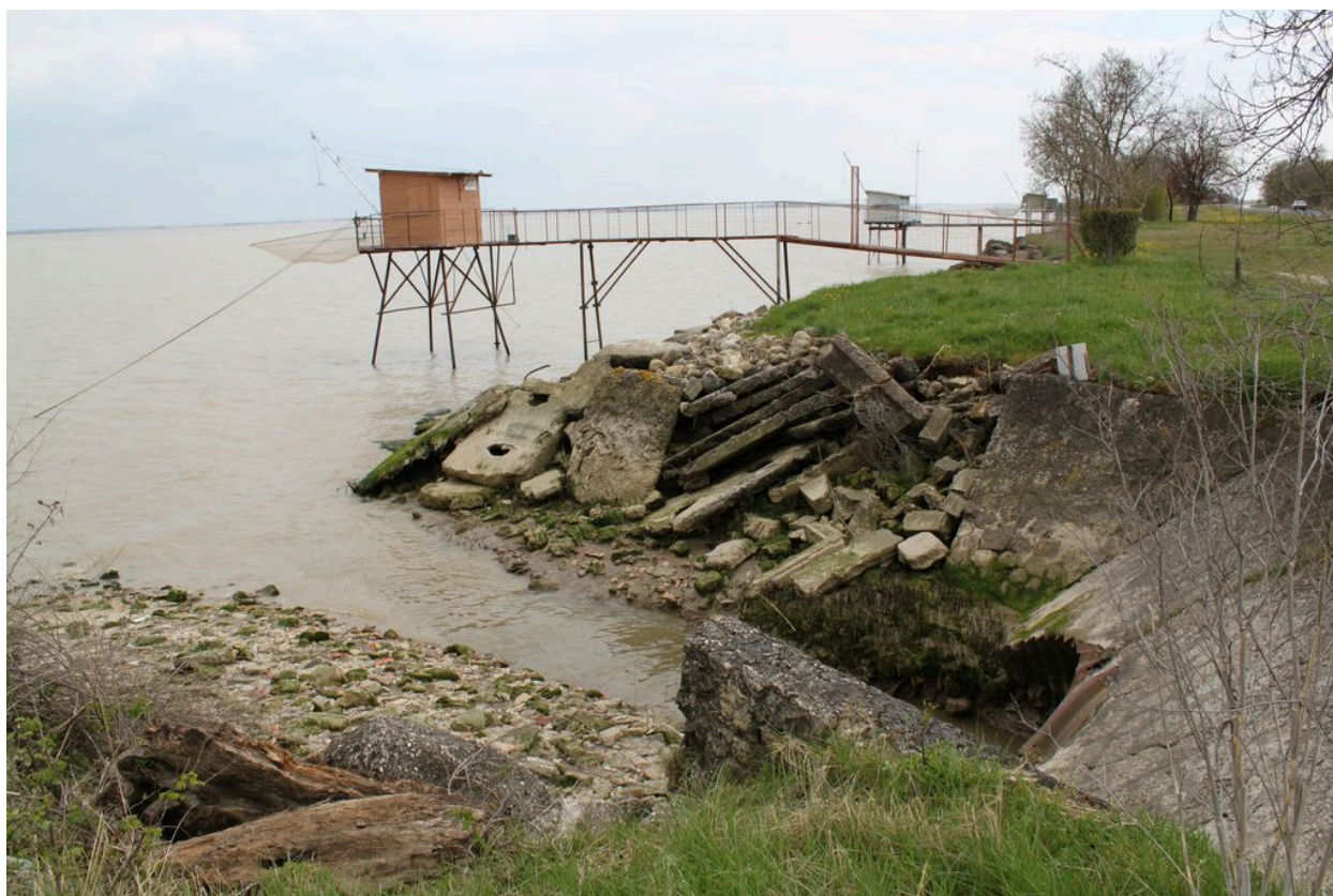
Débouché du ruisseau dans l'estuaire.