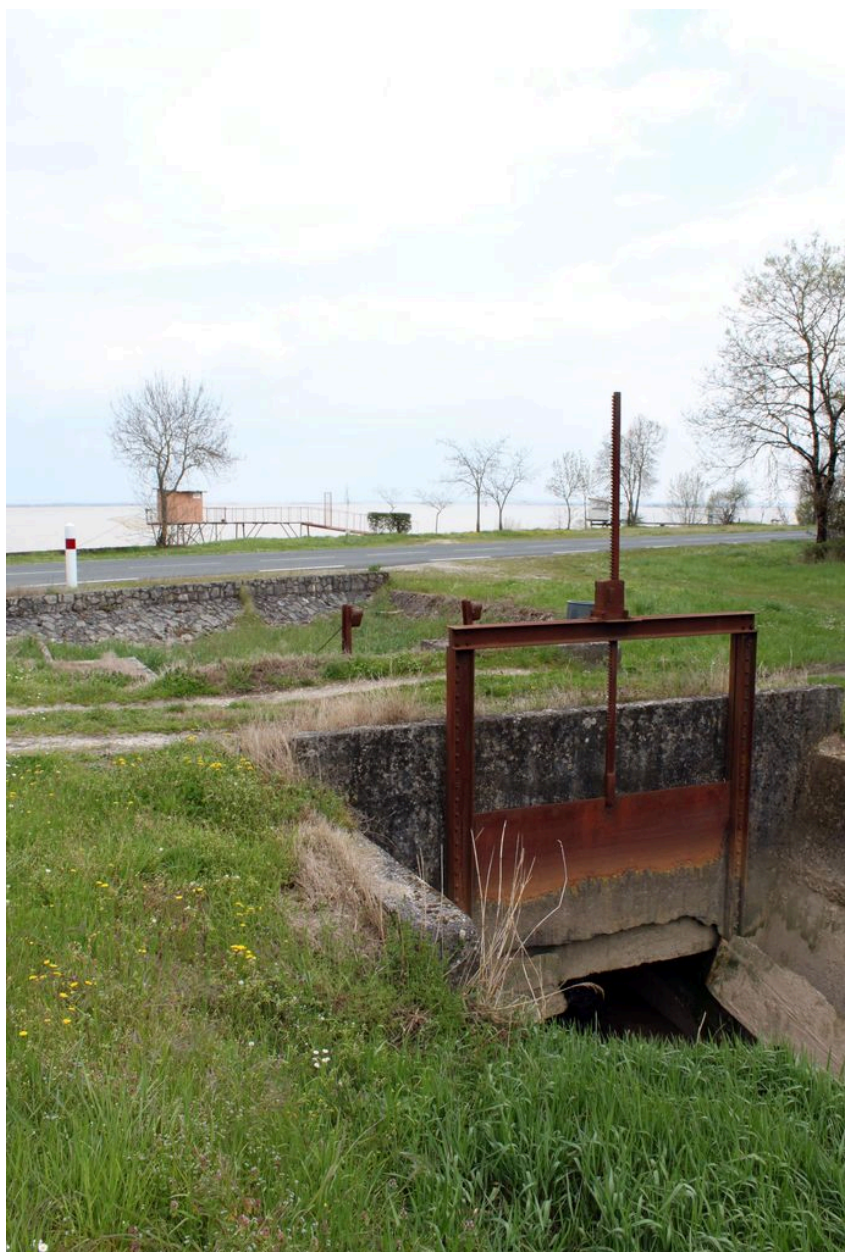
Détail de la pelle à crémaillère.