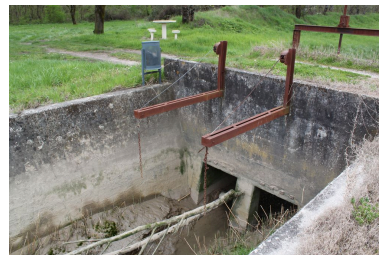
Détail des clapets.