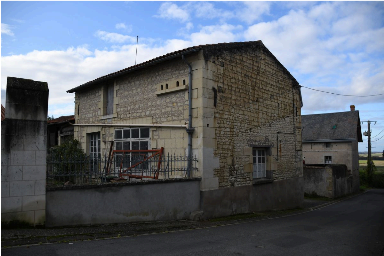
Vue de la façade principale de l'atelier du charron.