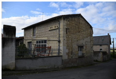
Vue de la façade principale de l'atelier du charron.

(Reproduction) Douski , Phot. Denise IVR75_20197903194NUCA