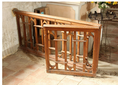
Détail du portillon de la chapelle de la Vierge.

Phot. Jean-Philippe Maisonnave IVR72_20144000929NUC2A