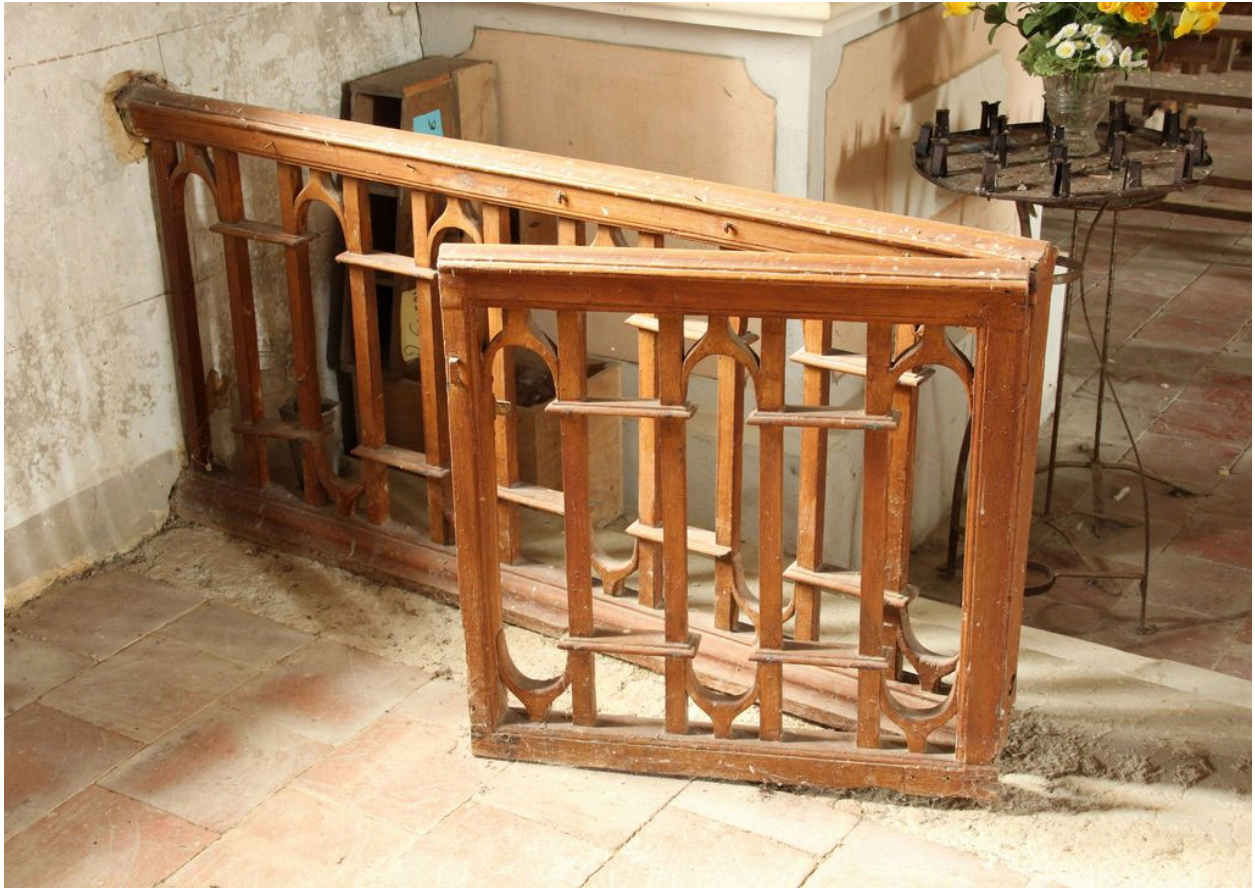
Détail du portillon de la chapelle de la Vierge.