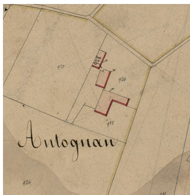
Extrait du plan cadastral de 1831, section A2 : parcelles 926, 928.