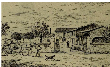
Lithographie extraite de l'édition de 1949 de l'ouvrage de Cocks et Féret, publiée dès 1898.

départementales de la Gironde IVR72_20153300631NUC1A