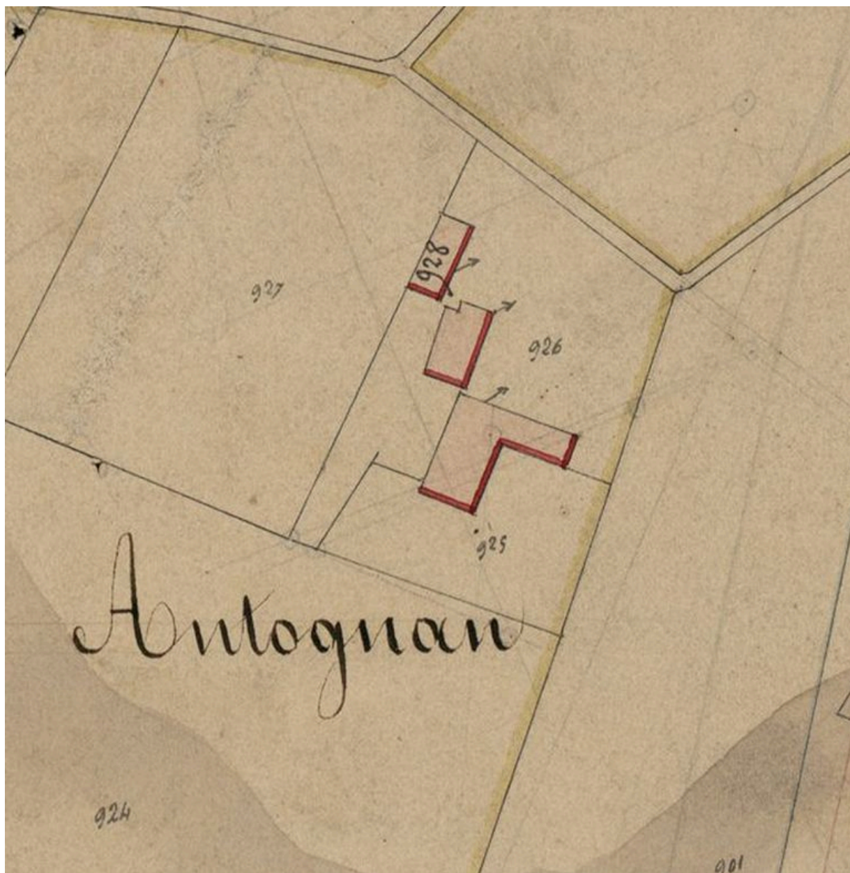
Extrait du plan cadastral de 1831, section A2 : parcelles 926, 928.