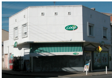
Façade.