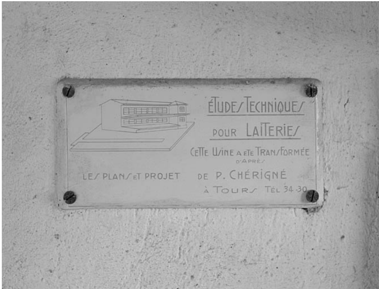
Plaque attribuant les travaux de rénovation des années 1950 à P. Chérigné.