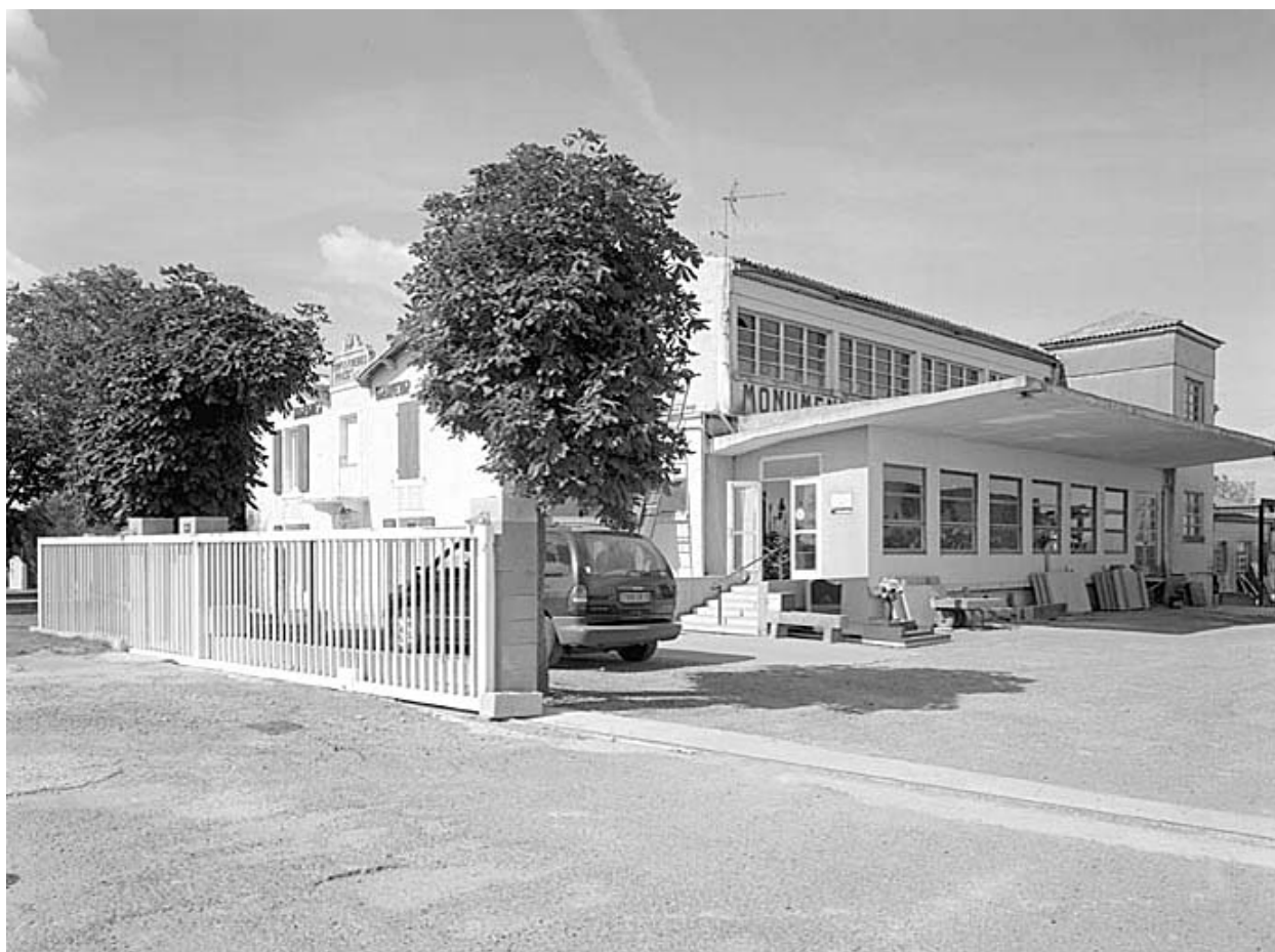
Vue prise de l'entrée.