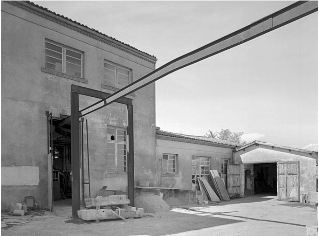
Partie nord des bâtiments.