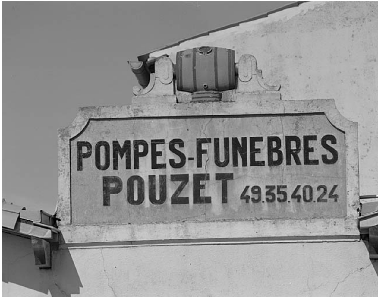
Détail du fronton surmonté d'une baratte.