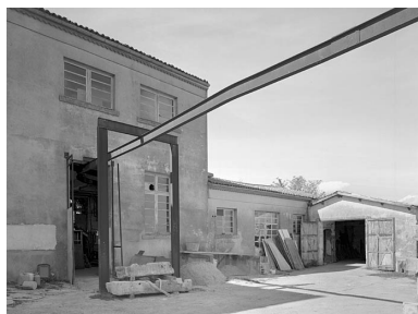
Partie nord des bâtiments. IVR54_20017902229V