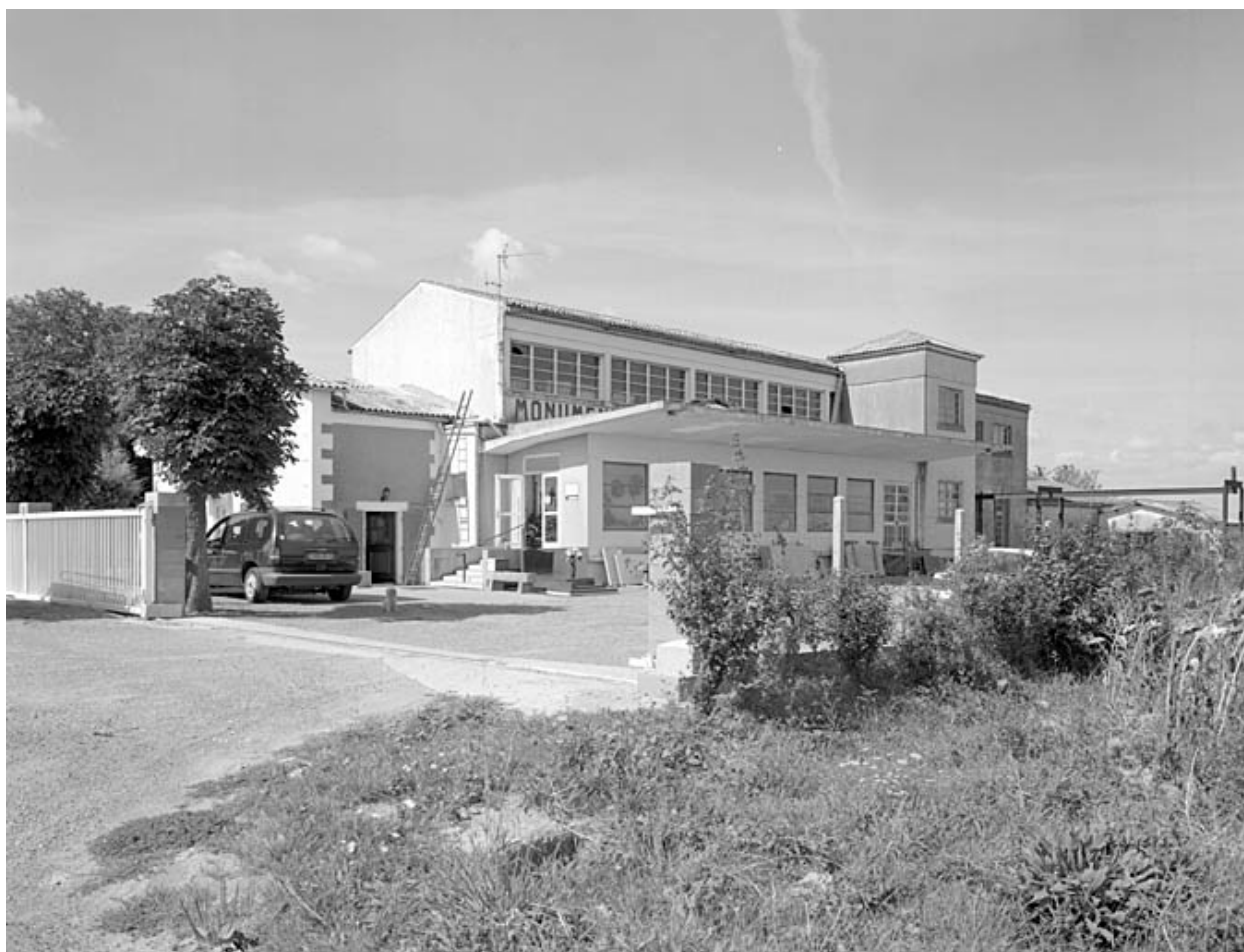
Vue générale prise du sud.