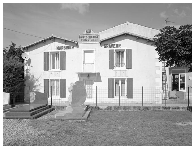
Logement vu du sud. IVR54_20017902226V