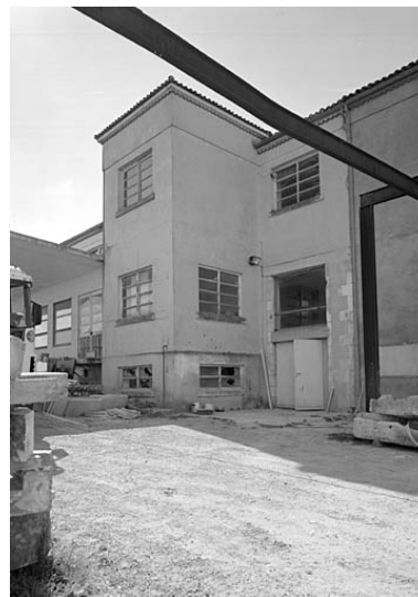
Partie nord du quai de réception et pavillon du laboratoire. IVR54_20017902228V