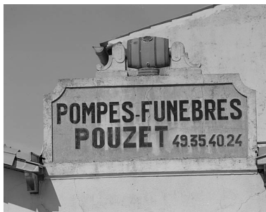
Détail du fronton surmonté d'une baratte.