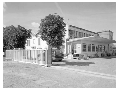
Vue prise de l'entrée. IVR54_20017902225V