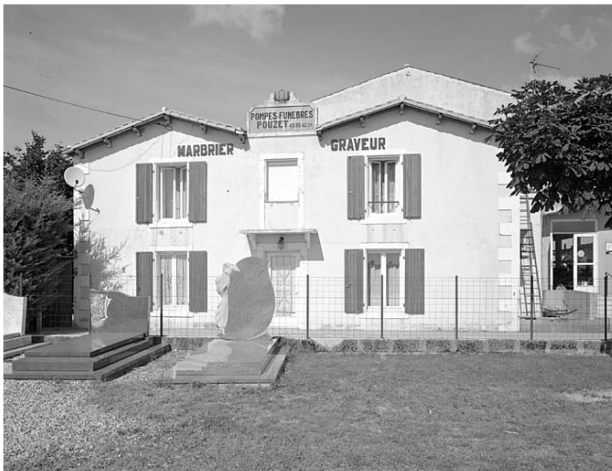
Logement vu du sud.