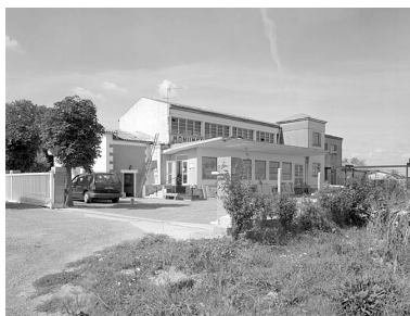
Vue générale prise du sud. IVR54_20017902224V