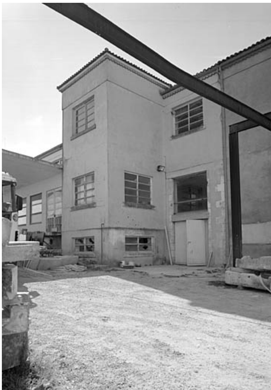
Partie nord du quai de réception et pavillon du laboratoire.