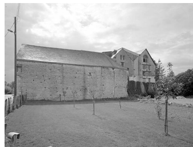
Vue prise du nord-est. IVR54_20017902195V