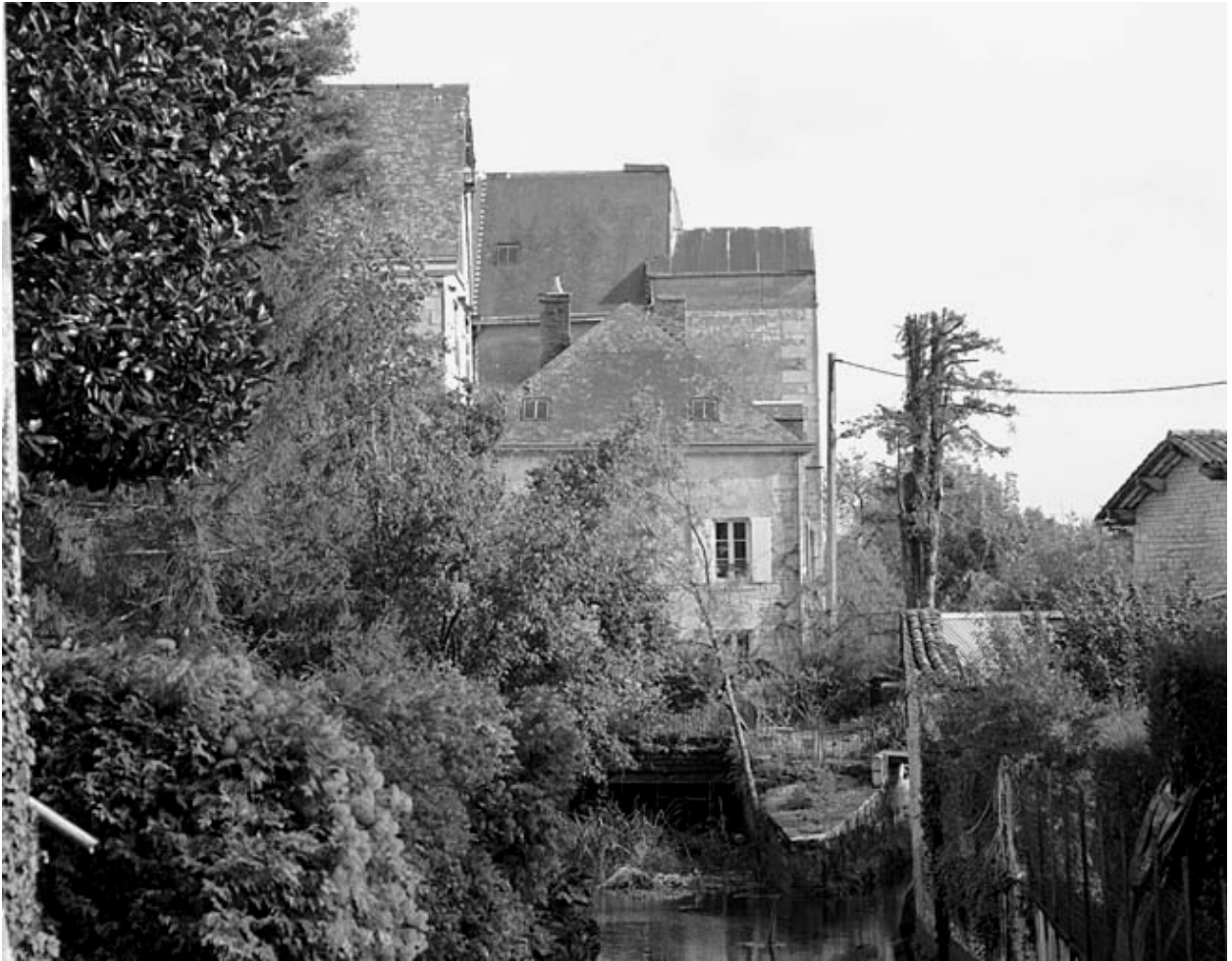
Vue prise du nord-ouest.