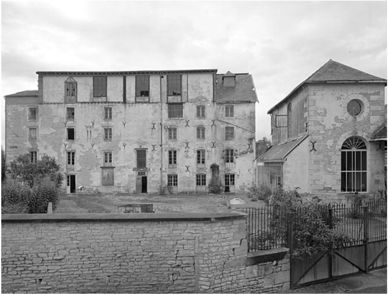
Vue prise du sud-est.