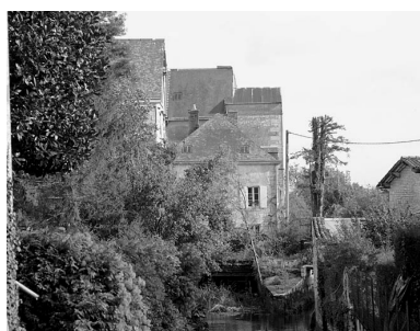
Vue prise du nord-ouest. IVR54_20017902494X