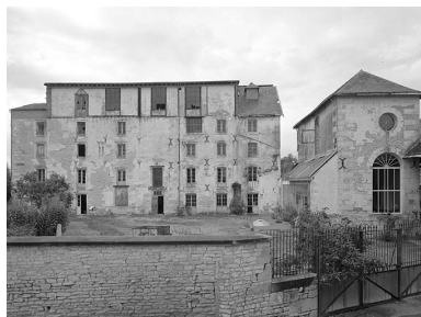
Vue prise du sud-est. IVR54_20017902193V