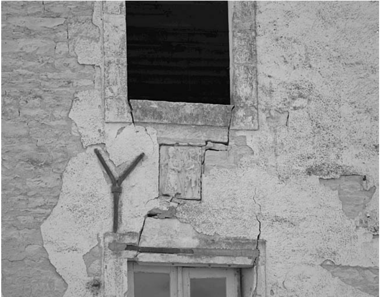
Détail d'une pierre sculptée insérée dans la façade principale de la minoterie.