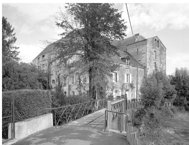
Vue prise du sud. IVR54_20017902194V