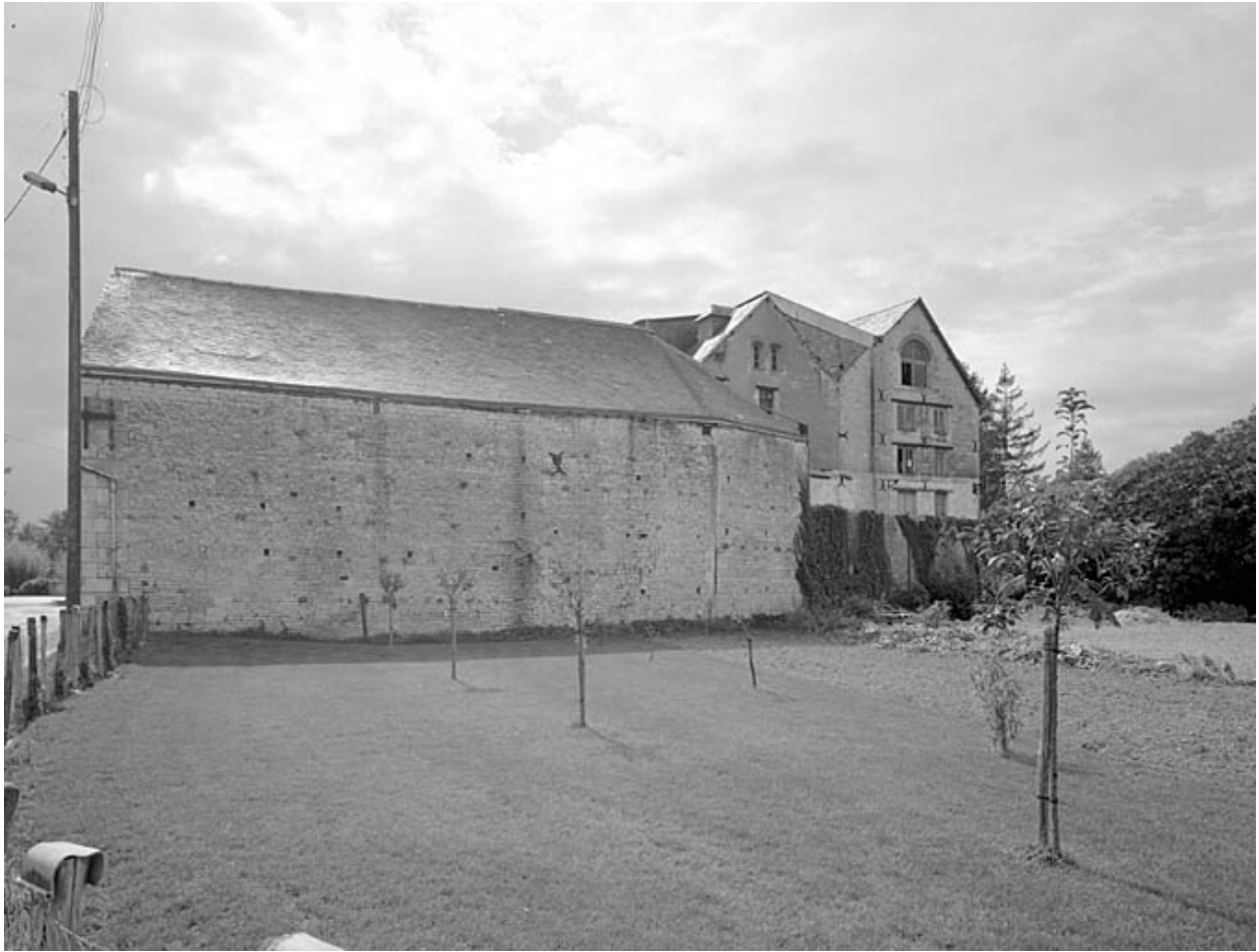
Vue prise du nord-est.