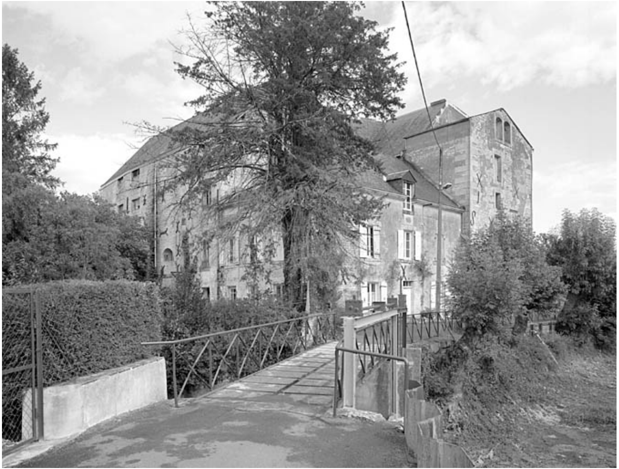
Vue prise du sud.