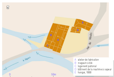
Plan masse, plan schématisé des toitures.