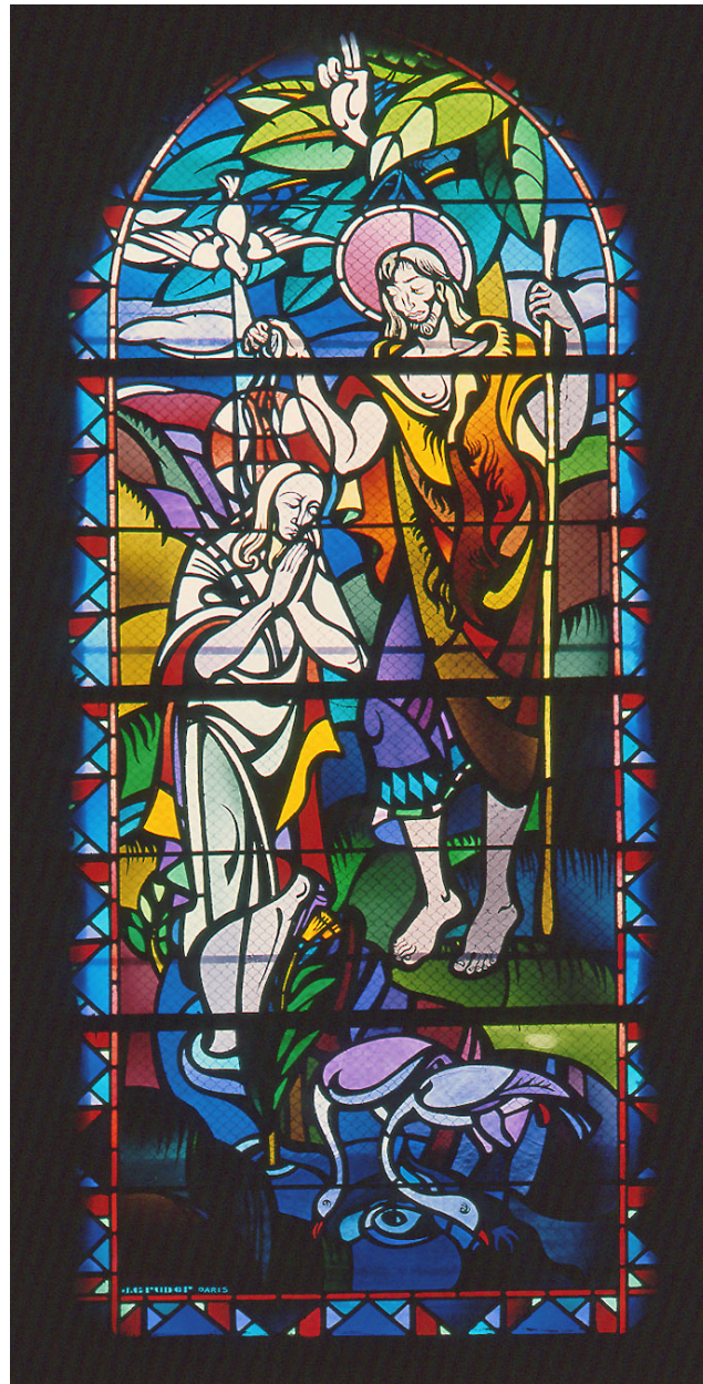
Baie 2 : le Baptême du Christ par Saint-Jean-Baptiste.