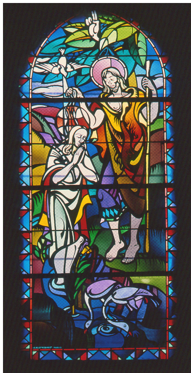
Baie 2 : le Baptême du Christ par Saint-Jean-Baptiste.