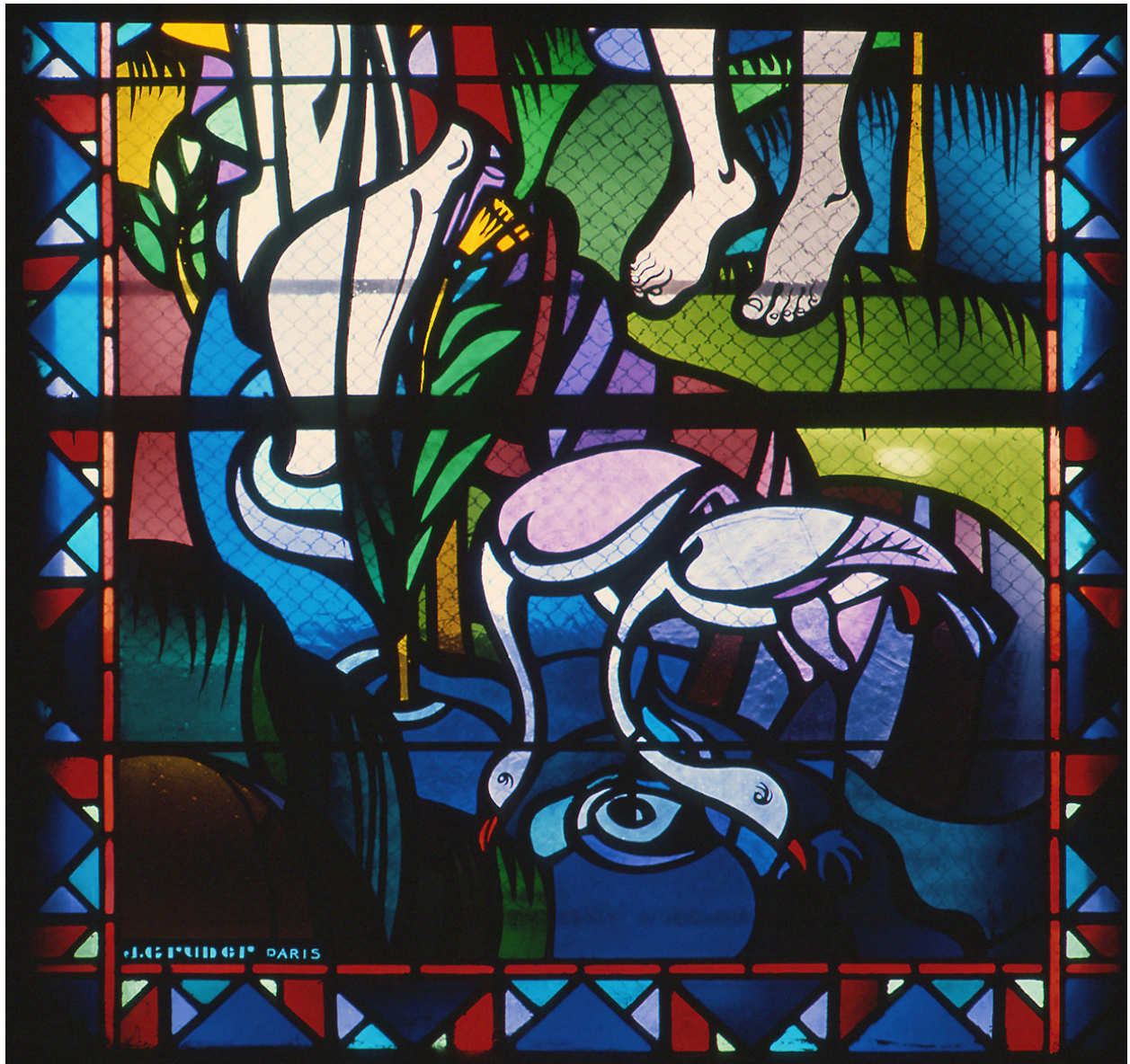
Baie 2 : détail de la signature.