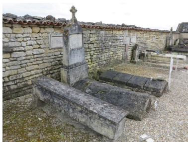
Le tombeau de la famille Beaud.