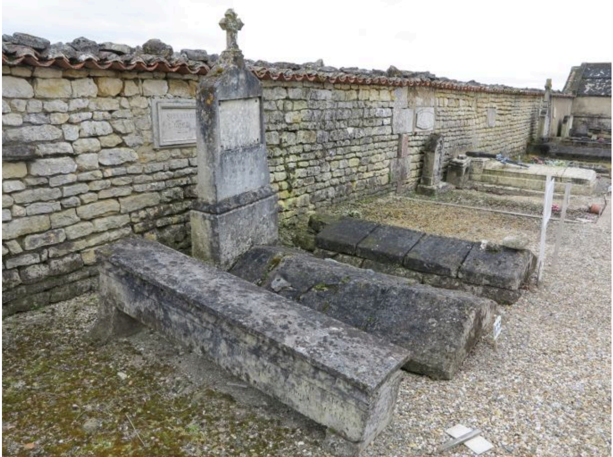
Le tombeau de la famille Beaud.