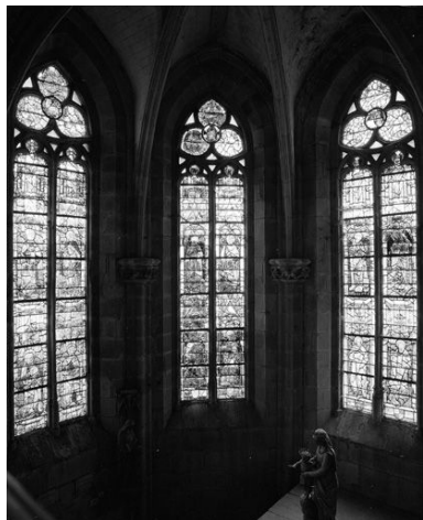
Vue générale de la baie 7 (au centre).