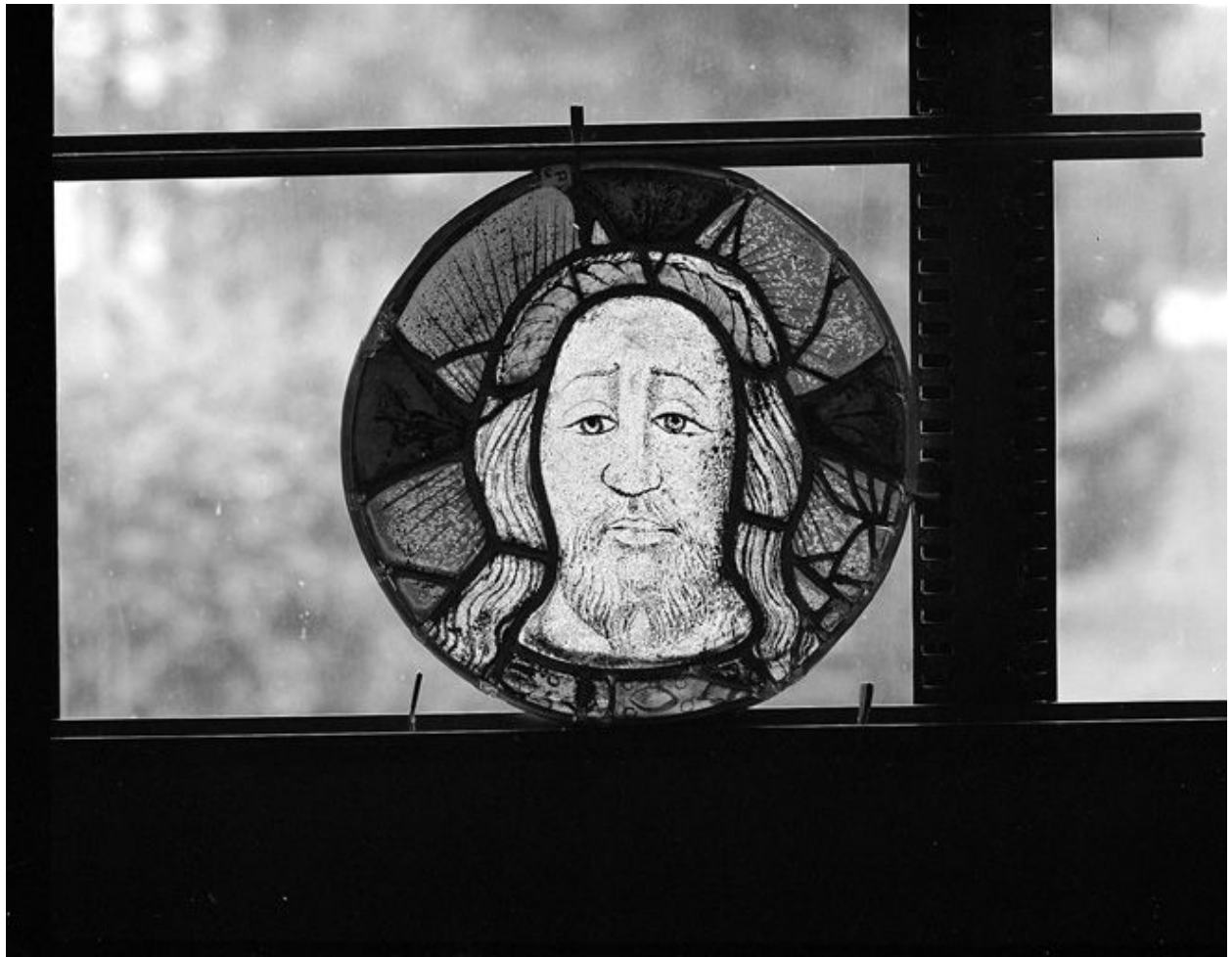
Baie 7 : Sainte Face.