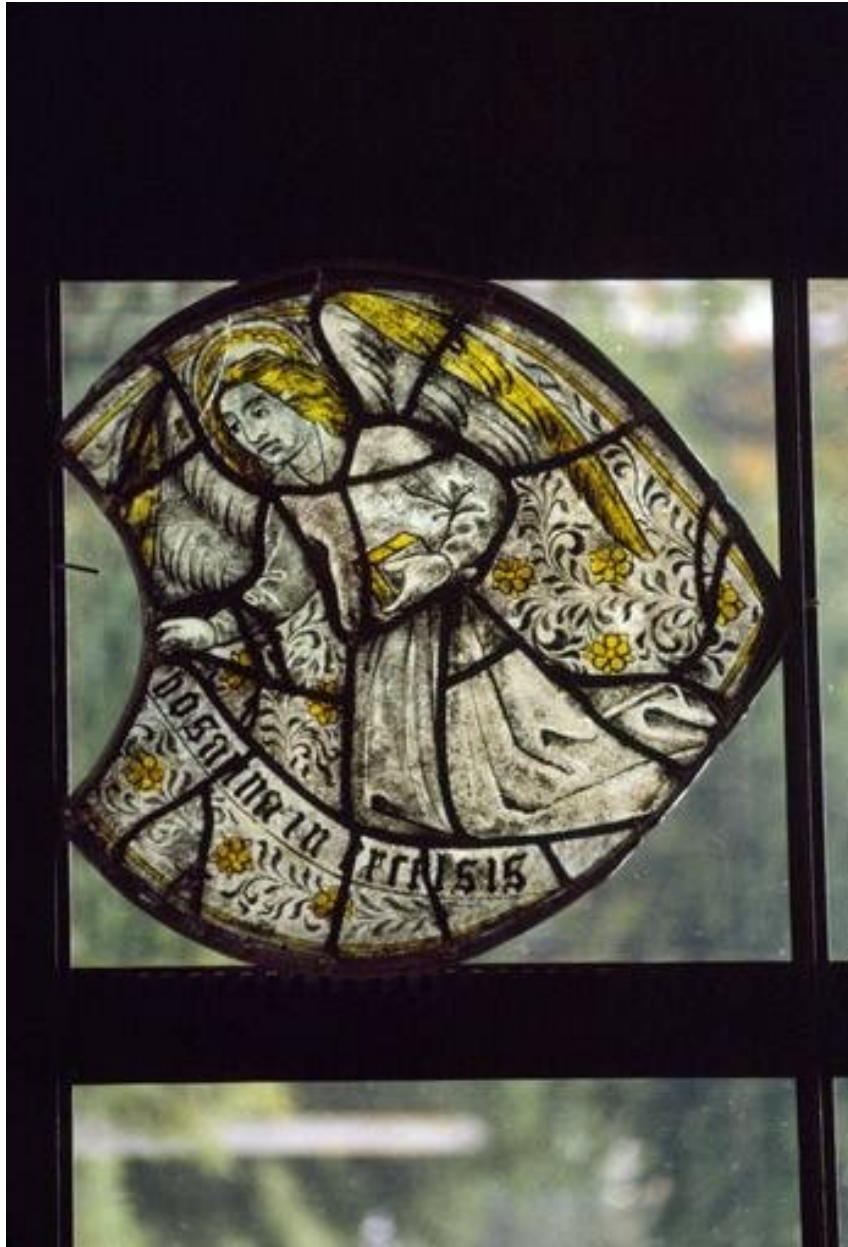
Baie 7 : ange portant un phylactère, lobe droit au tympan.