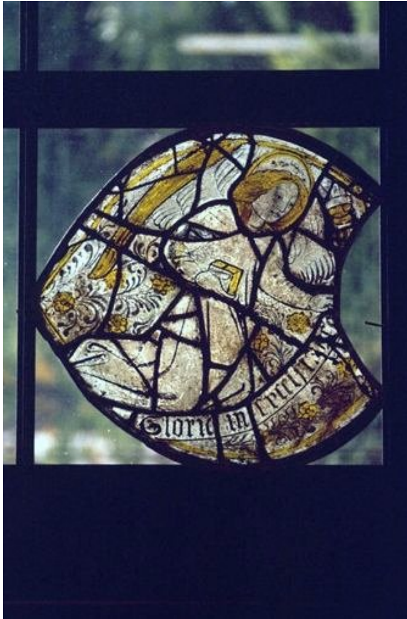
Baie 7 : ange portant un phylactère, lobe gauche au tympan.