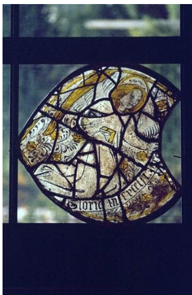
Baie 7 : ange portant un phylactère, lobe gauche au tympan. IVR74_19828701795ZA