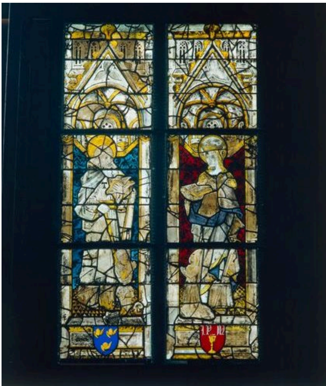
Baie 7 : saint Antoine et sainte Catherine d'Alexandrie avec des donateurs.