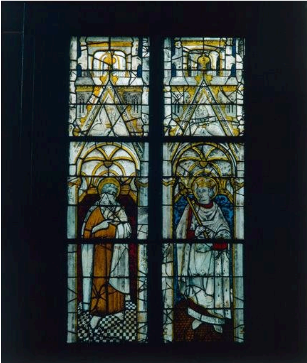
Baie 7 : saint Jean-Baptiste et saint Louis.