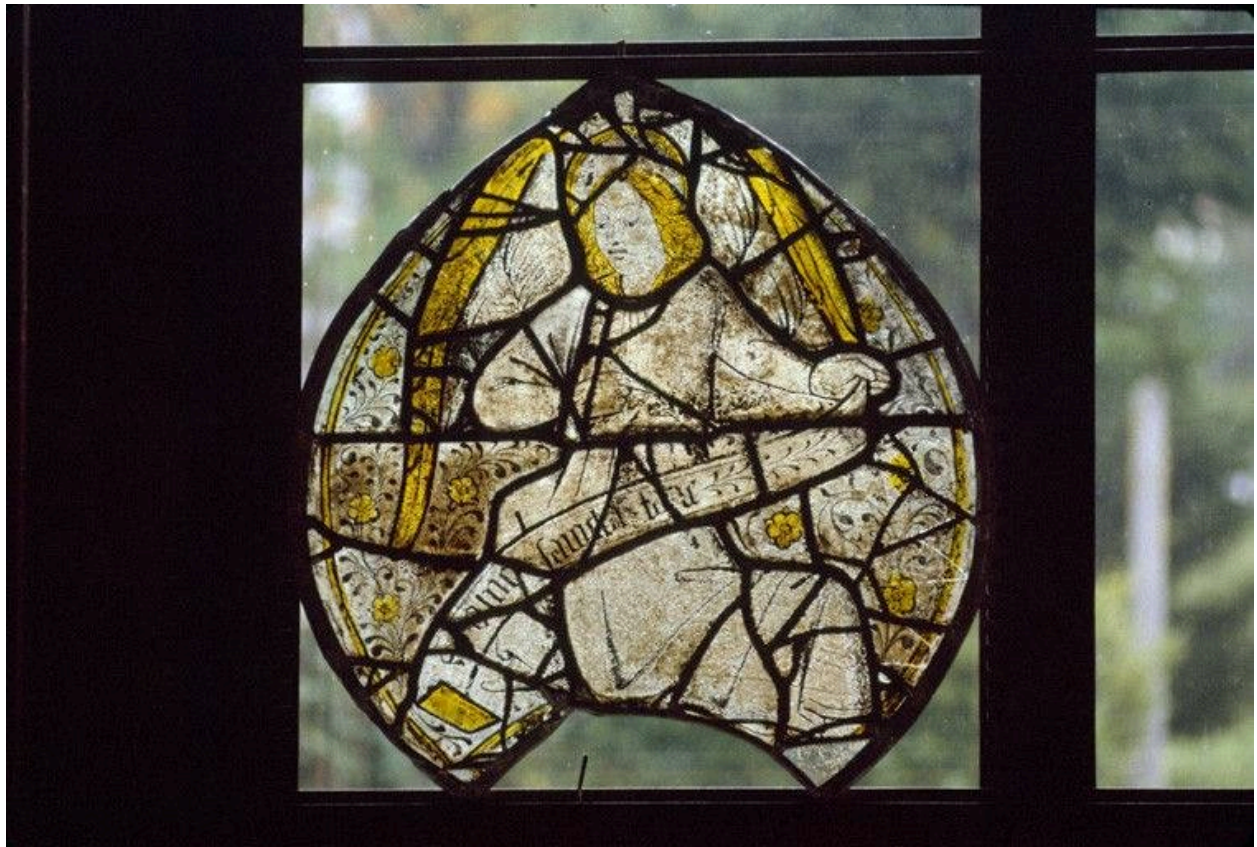
Baie 7 : ange portant un phylactère, lobe supérieur au tympan.