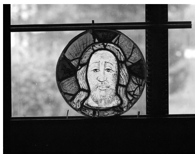
Baie 7 : Sainte Face.