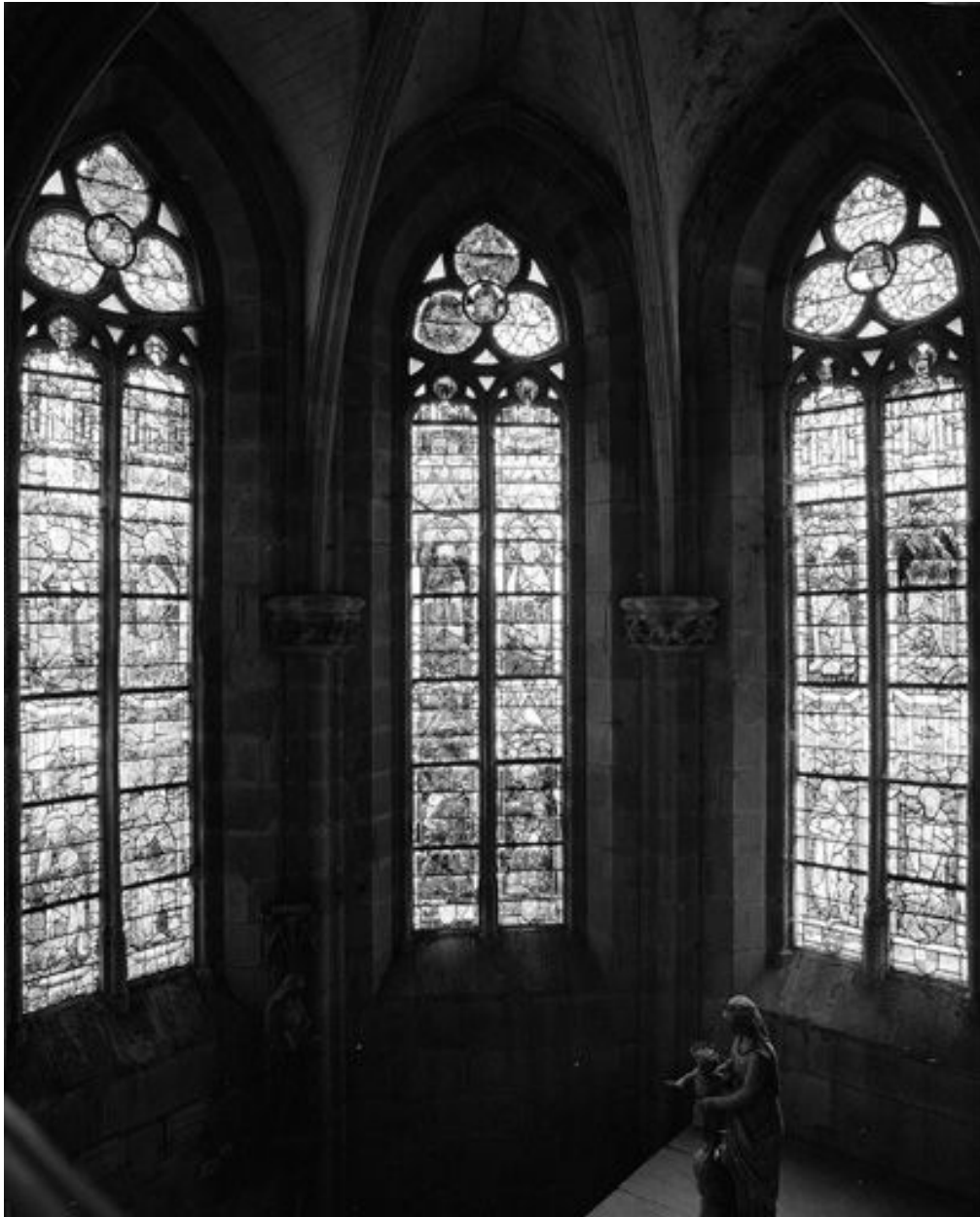
Vue générale de la baie 7 (au centre).