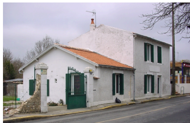
Vue générale. IVR54_20061702442NUCA