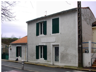
Autre vue.