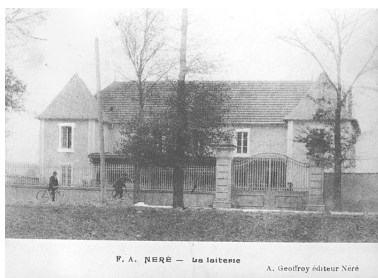
Elévation antérieure vue du nord est. IVR54_19971701166X