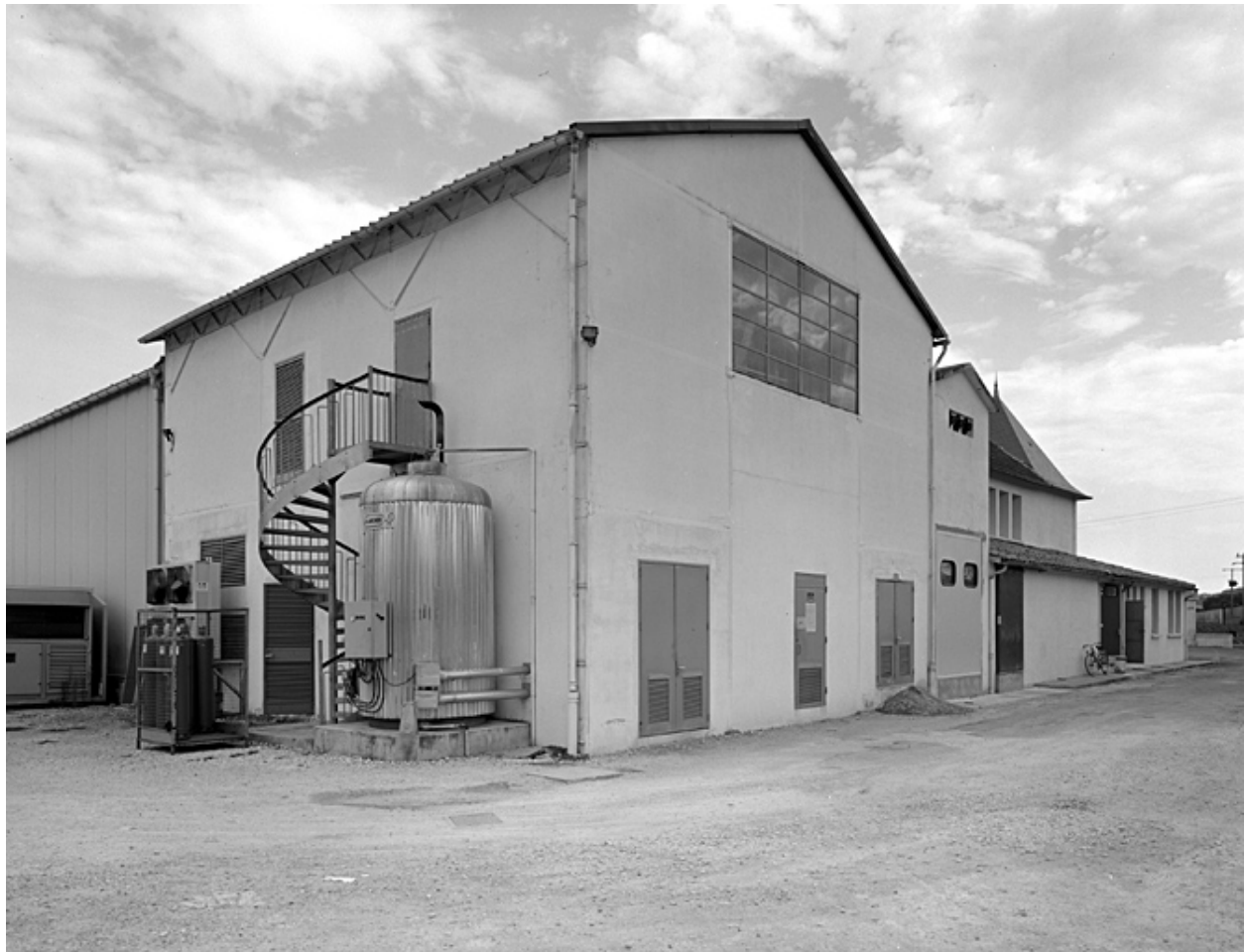
Chaufferie vue du sud.