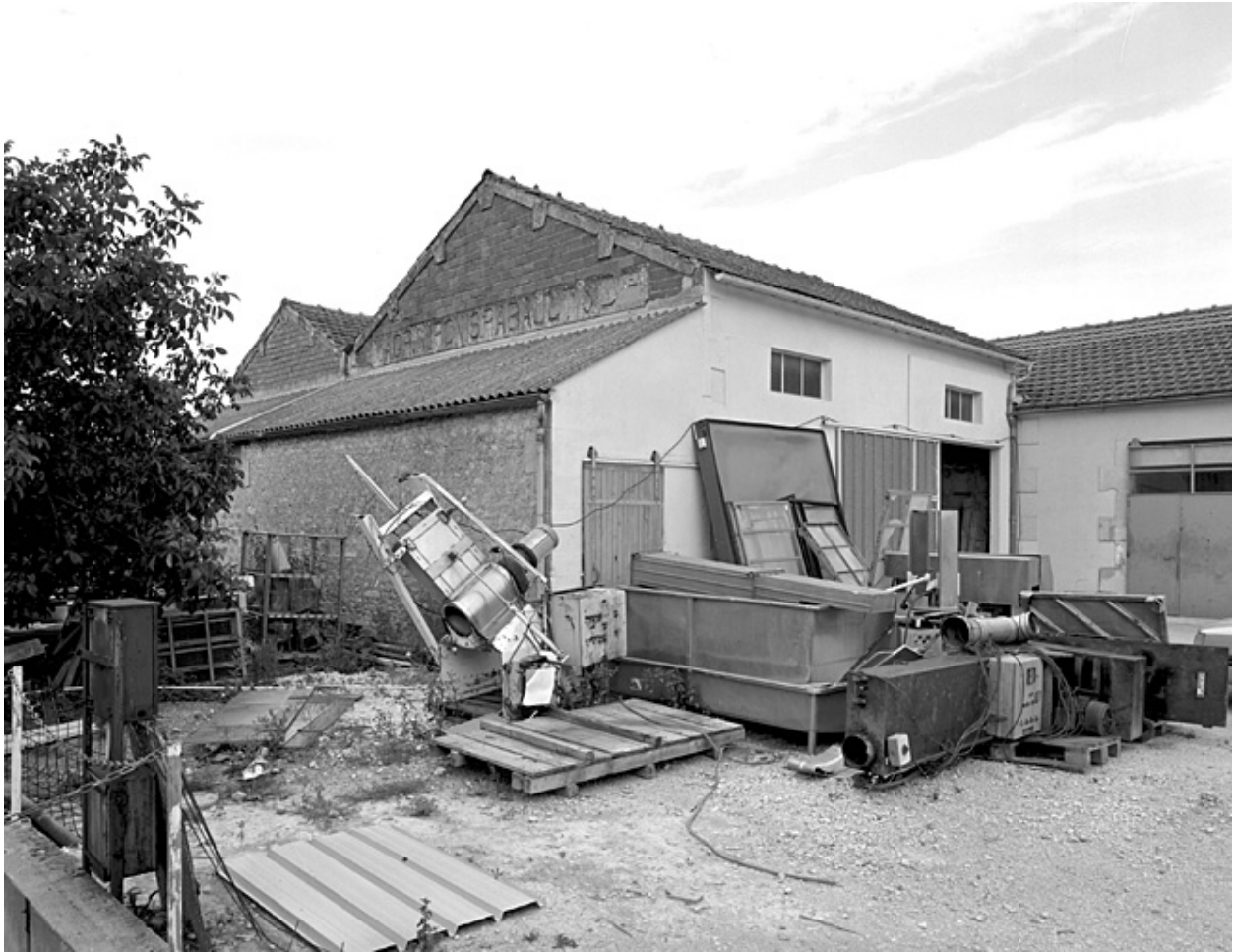
Caséinerie portant l'inscription Magrini, Ponis, Rabault et Cie vue du nord est.