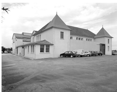
Vue prise de l'est. IVR54_19971701162V