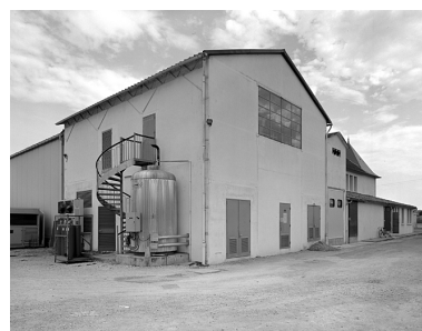
Chaufferie vue du sud. IVR54_19971701163V