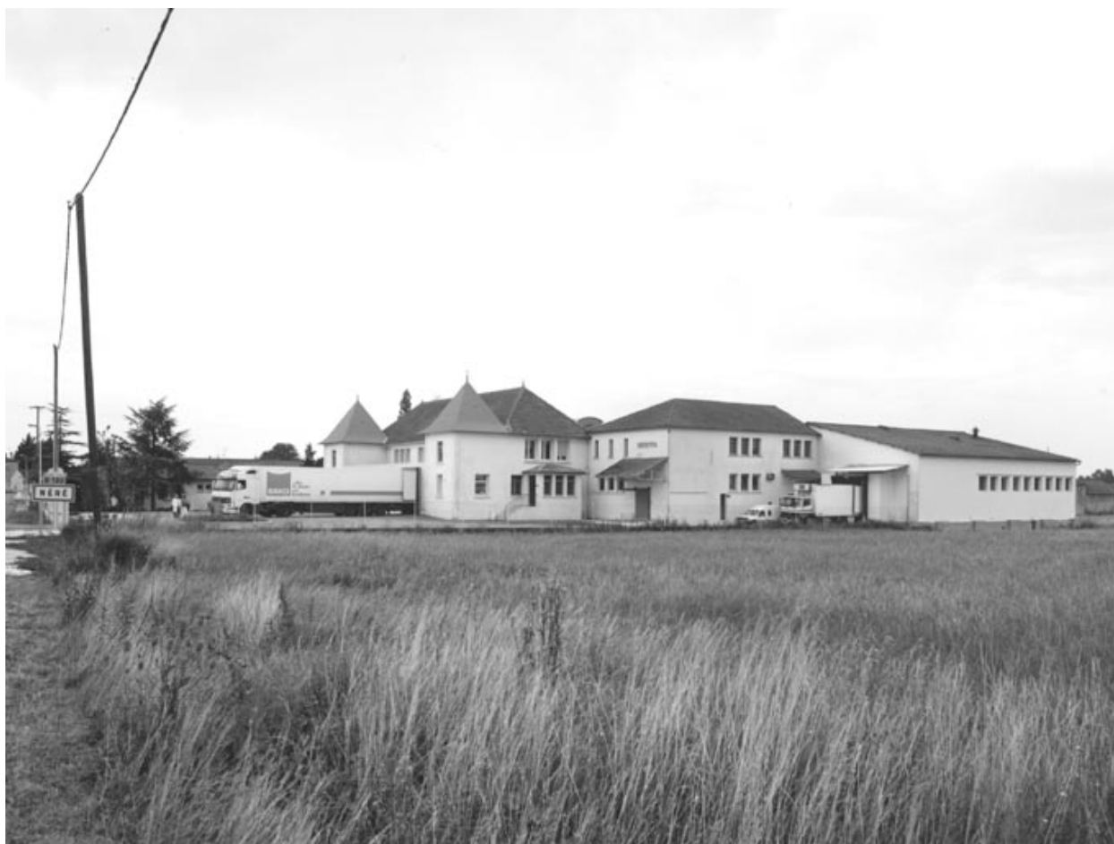
Vue générale prise du nord ouest.