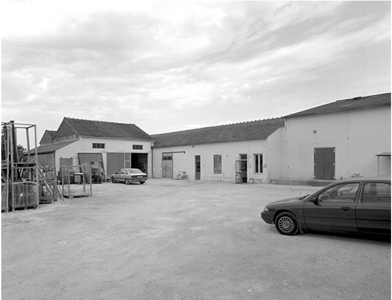
Logement et caséinerie vus du nord est.