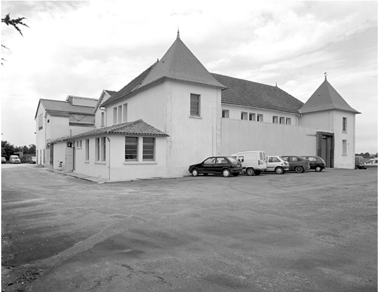
Vue prise de l'est.