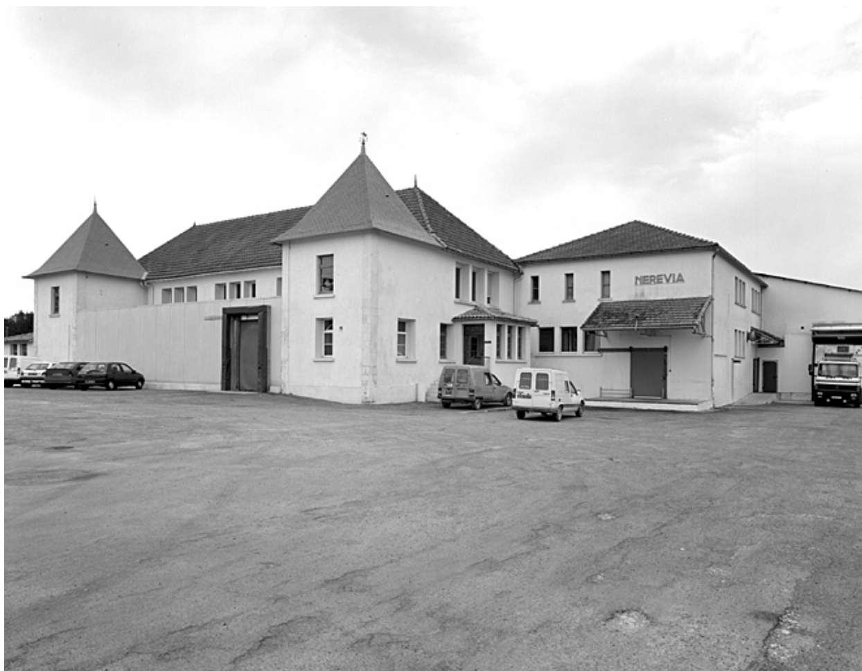
Vue prise du nord.