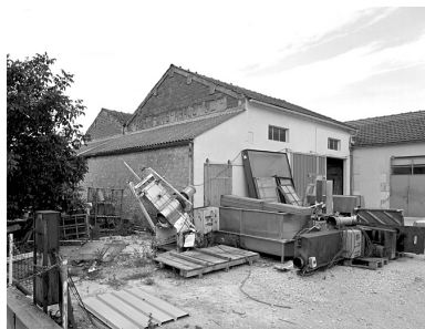
Caséinerie portant l'inscription Magrini, Ponis, Rabault et Cie vue du nord est.