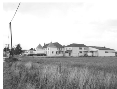
Vue générale prise du nord ouest. IVR54_19971701160V