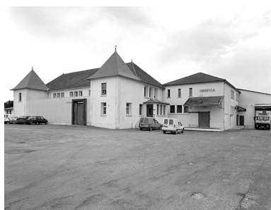
Vue prise du nord.