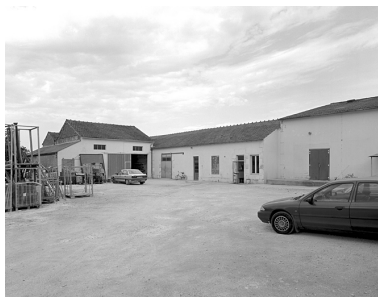
Logement et caséinerie vus du nord est.