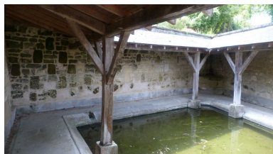
Vue intérieure du lavoir à impluvium.