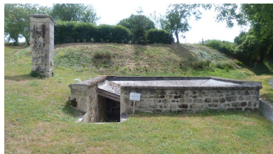
Vue générale du lavoir à impluvium. IVR75_20197903001NUCA