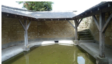
Vue de l'escalier permettant l'accès au bassin du lavoir. IVR75_20197903003NUCA