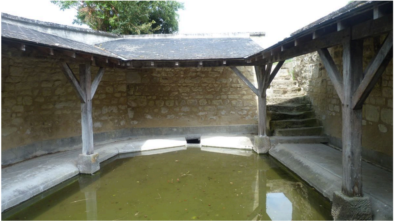
Vue de l'escalier permettant l'accès au bassin du lavoir.