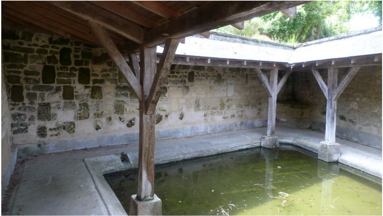
Vue intérieure du lavoir à impluvium.