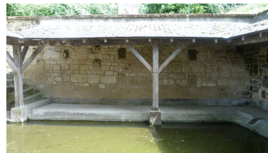
Vue intérieure du lavoir à impluvium.