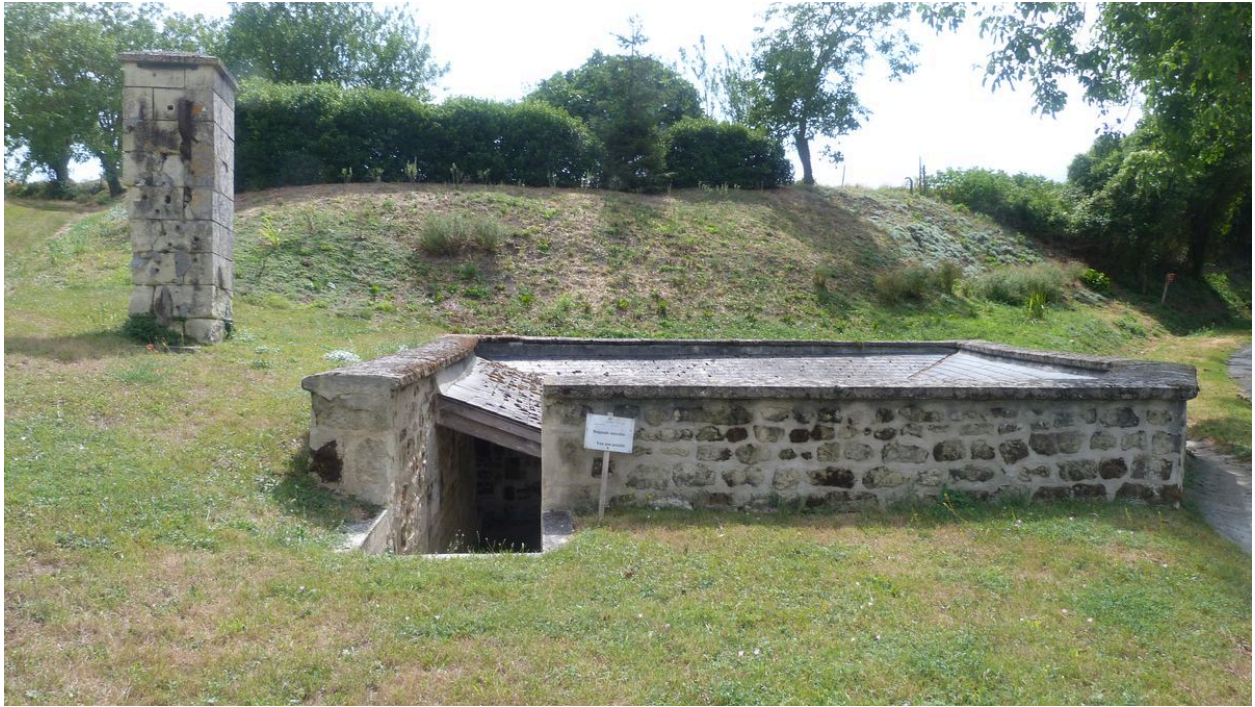
Vue générale du lavoir à impluvium.