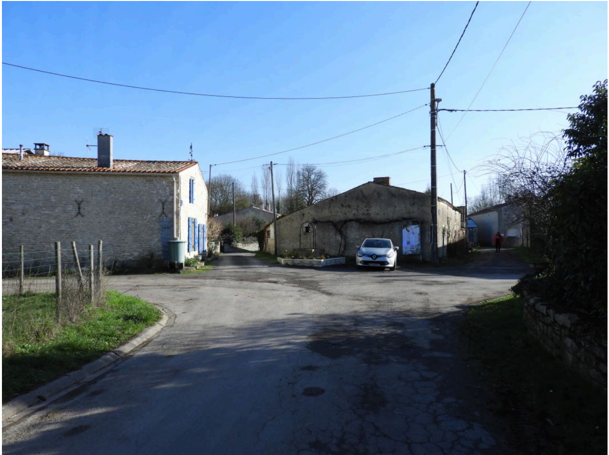
La place vue depuis l'ouest.