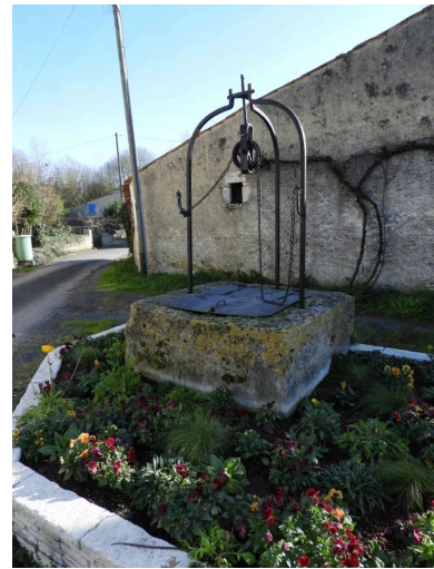
Le puits vu depuis l'ouest.