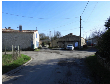
La place vue depuis l'ouest.