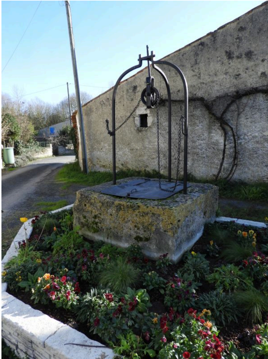
Le puits vu depuis l'ouest.