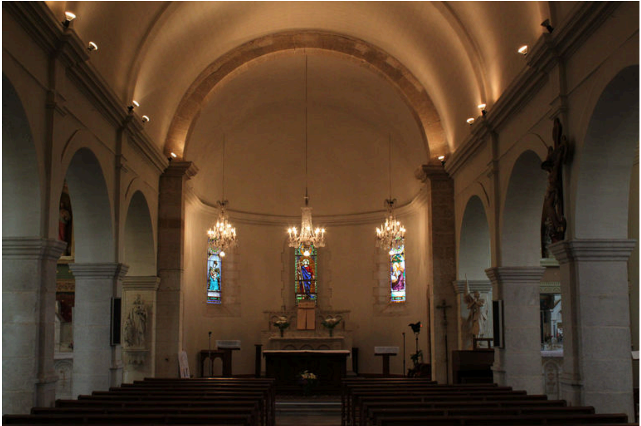
Vue intérieure : champ.