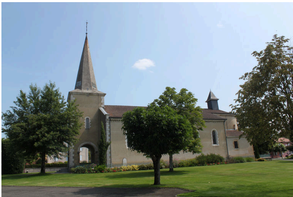
Ensemble depuis le sud.