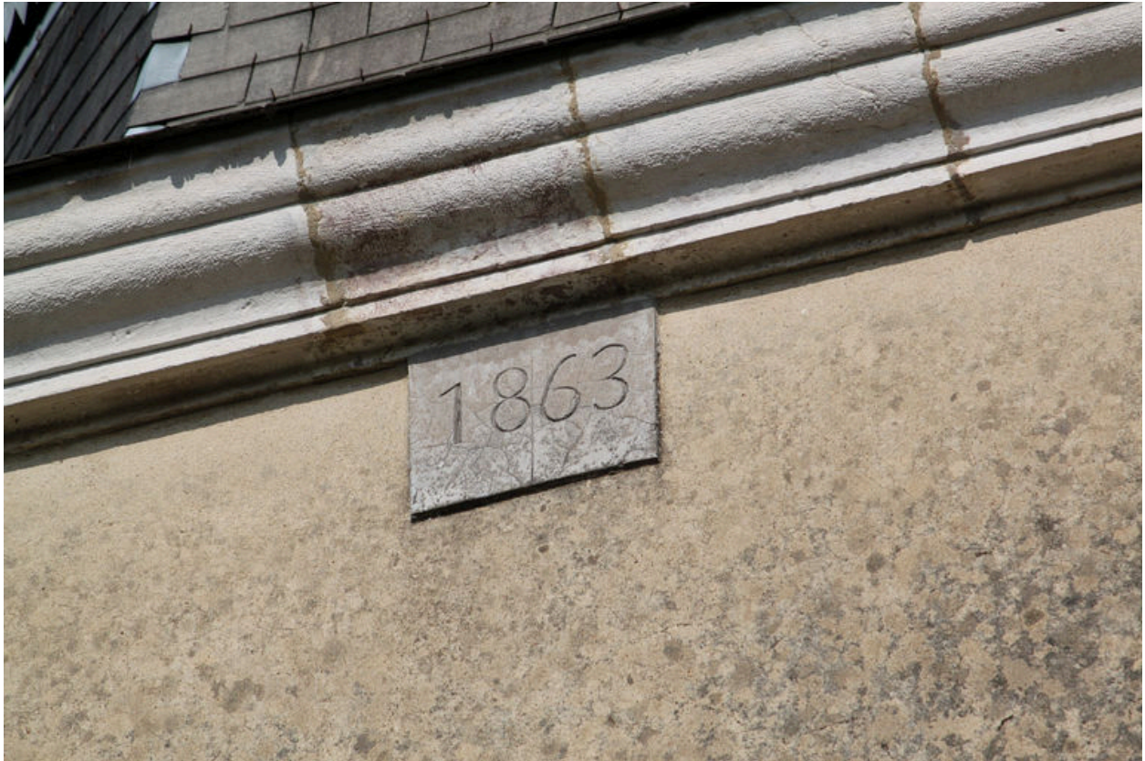
Date portée 1863 sur le clocher.