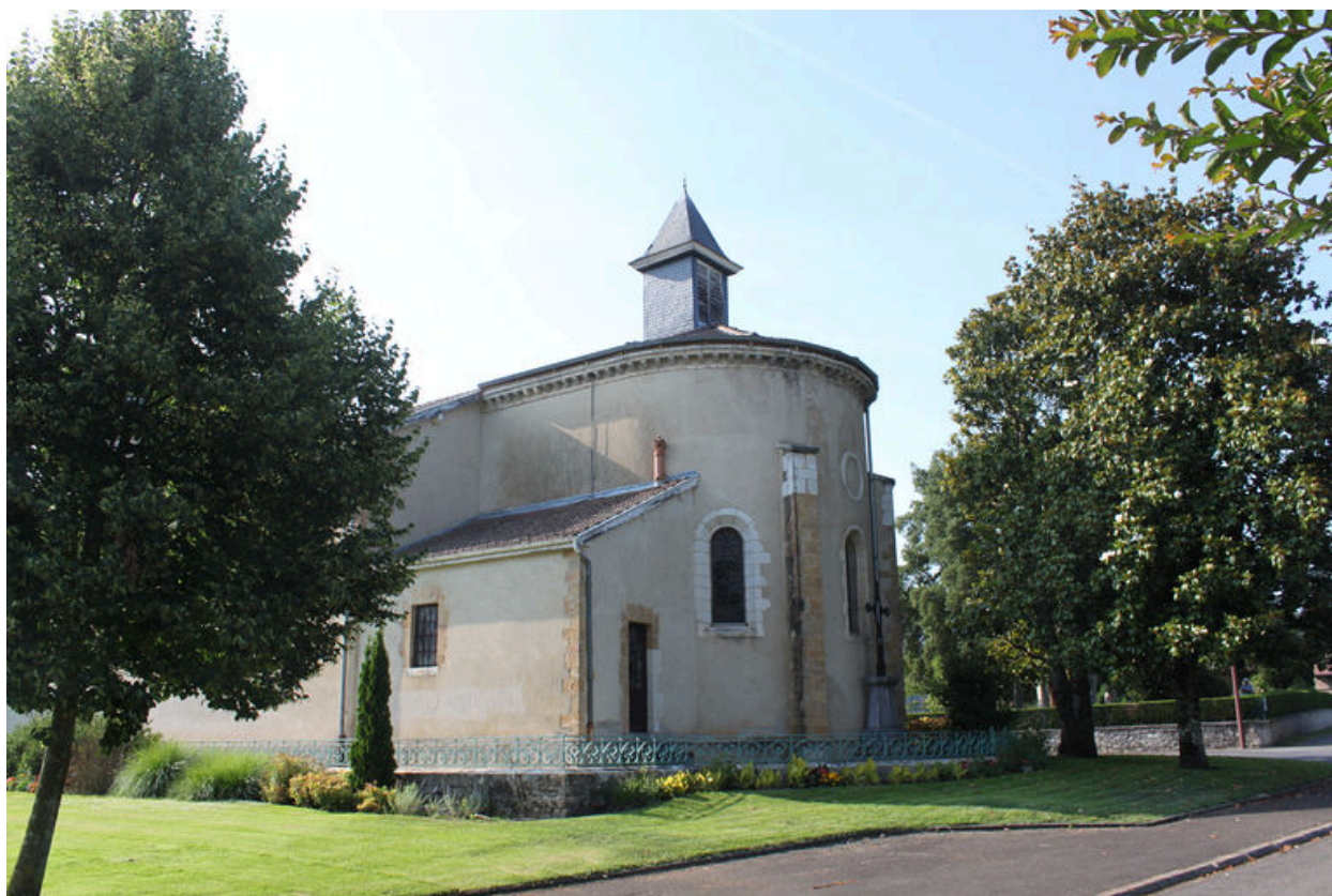
Chevet depuis le sud.