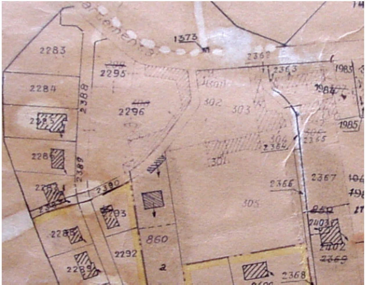
(1973) Cadastre ; état du bâti.