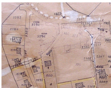
(1973) Cadastre ; état du bâti. IVR54_20051702923NUCA