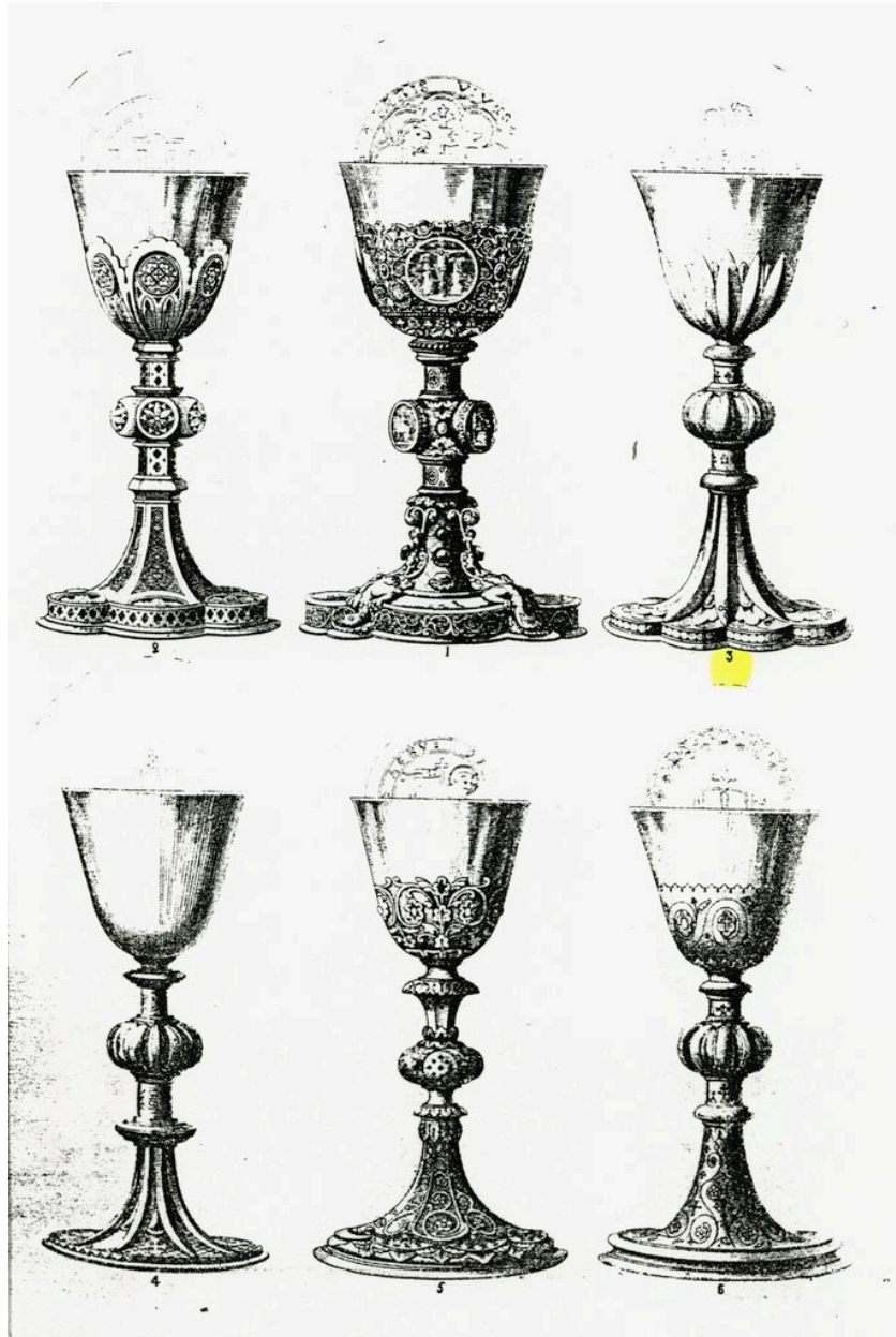
Extrait du catalogue de la maison Poussielgue-Usand, après 1880, p. 1 ("calices", modèle n° 3).