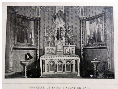
CHAPELLE DE SAINT VINCENT DE PAUL Chapelle de saint Vincent de Paul. Photographie publi é e dans : "Guide illustr é du p è lerin à Notre-Dame de Buglose" (entre 1911 et 1930). IVR72_20194000728NUC2Y