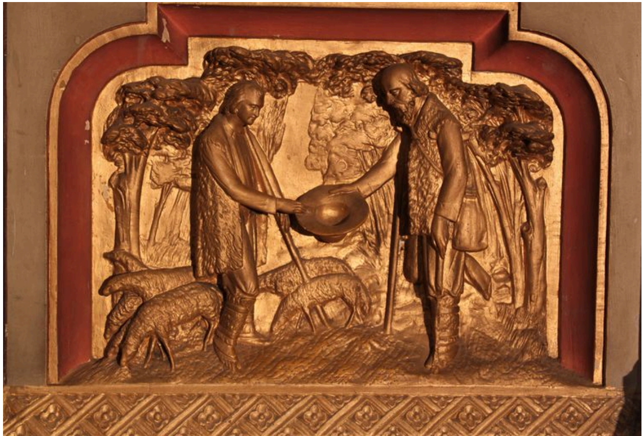
Aile gauche du reliquaire-tabernacle : charité de saint Vincent de Paul.