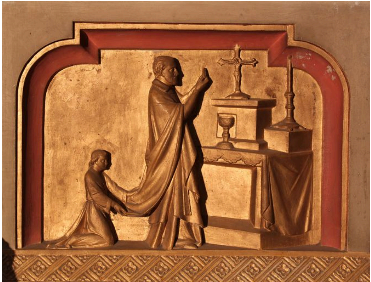
Aile droite du reliquaire-tabernacle : saint Vincent de Paul célébrant la messe.