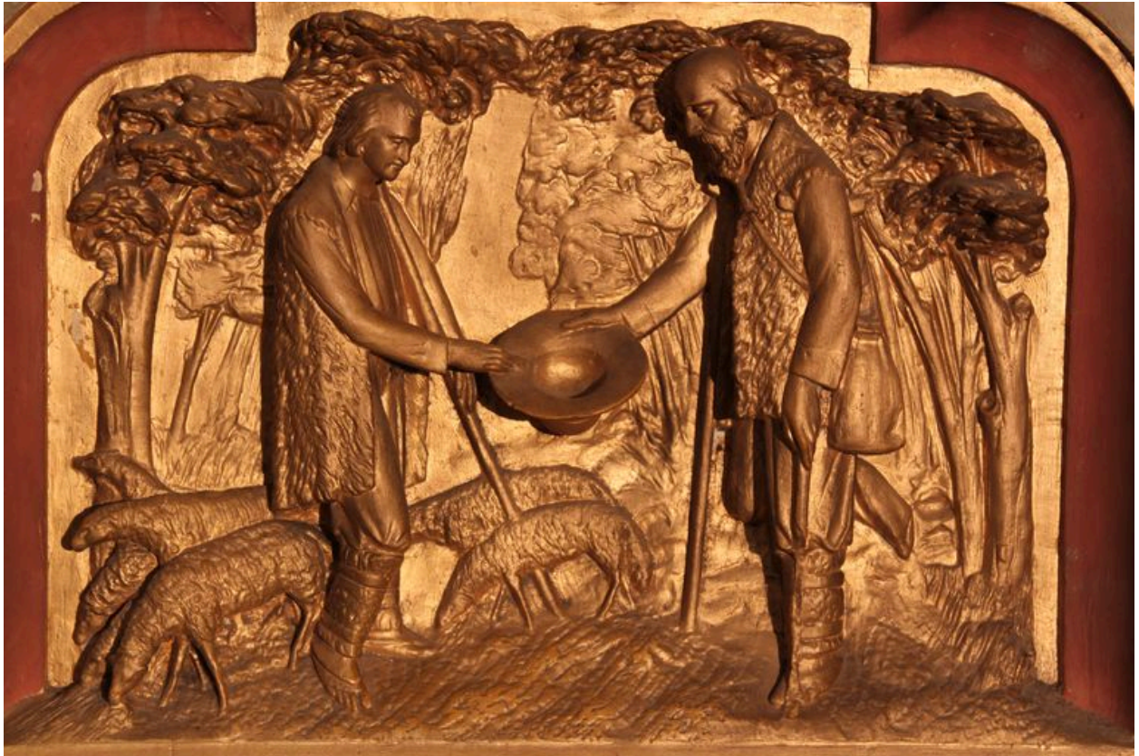
D etail de l'aile gauche du reliquaire-tabernacle : charit e de saint Vincent de Paul.