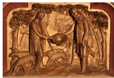
D é tail de l'aile gauche du reliquaire-tabernacle : charit é de saint Vincent de Paul. IVR72_20124000400NUC2A