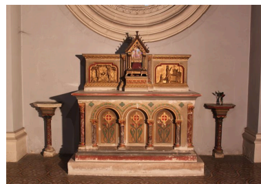
Ensemble. IVR72_20124000399NUC2A