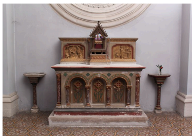
Ensemble. IVR72_20124000398NUC2A