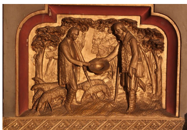
Aile gauche du reliquaire-tabernacle : charit é de saint Vincent de Paul. IVR72_20124000401NUC2A