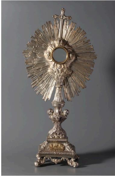
Ensemble (face). IVR72_20144001305NUC2A