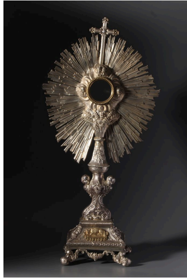
Ensemble. IVR72_20144001306NUC2A