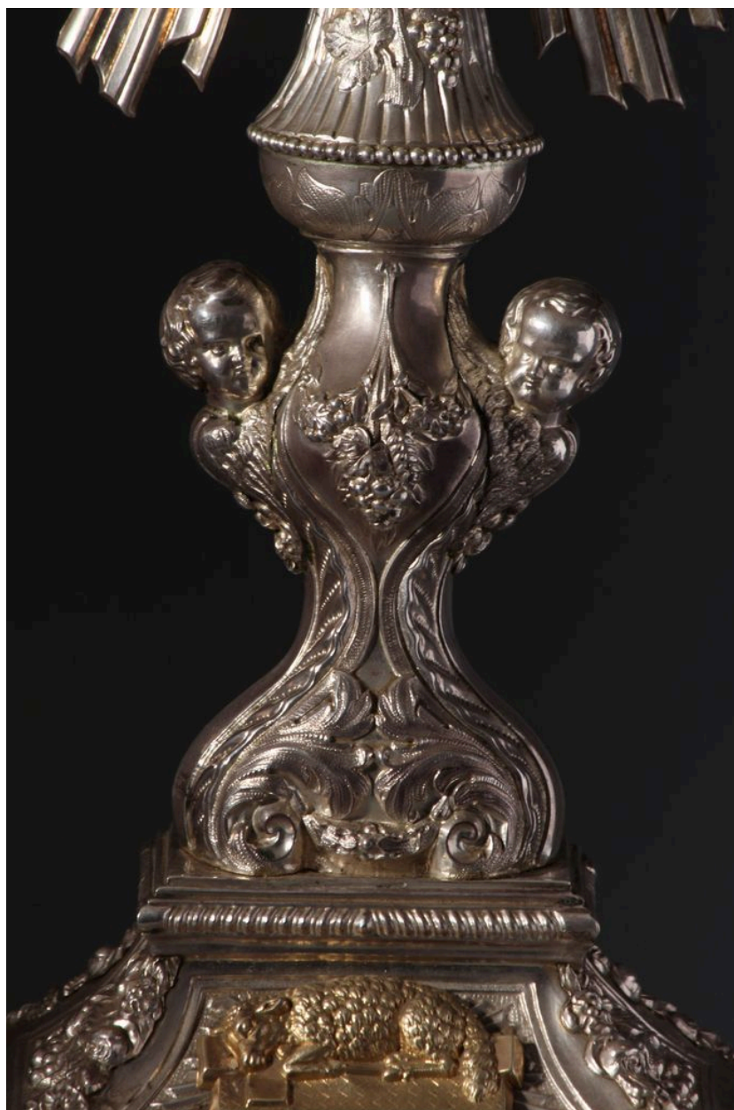
Détail de la tige.