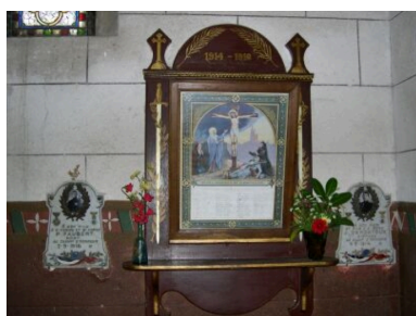
Monument aux morts et plaques commémoratives dans l'église d'Ansac-sur-Vienne.