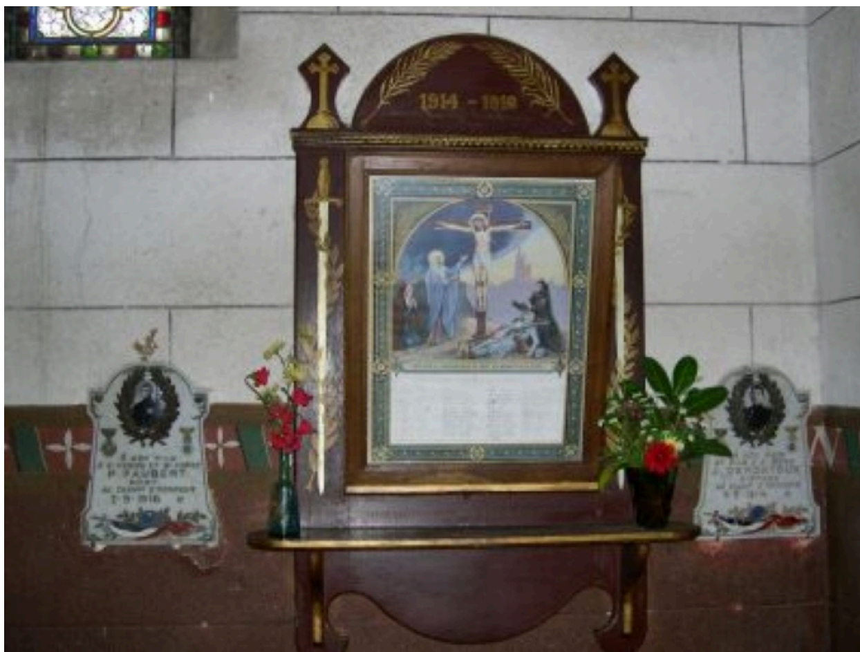
Monument aux morts et plaques commémoratives dans l'église d'Ansac-sur-Vienne.