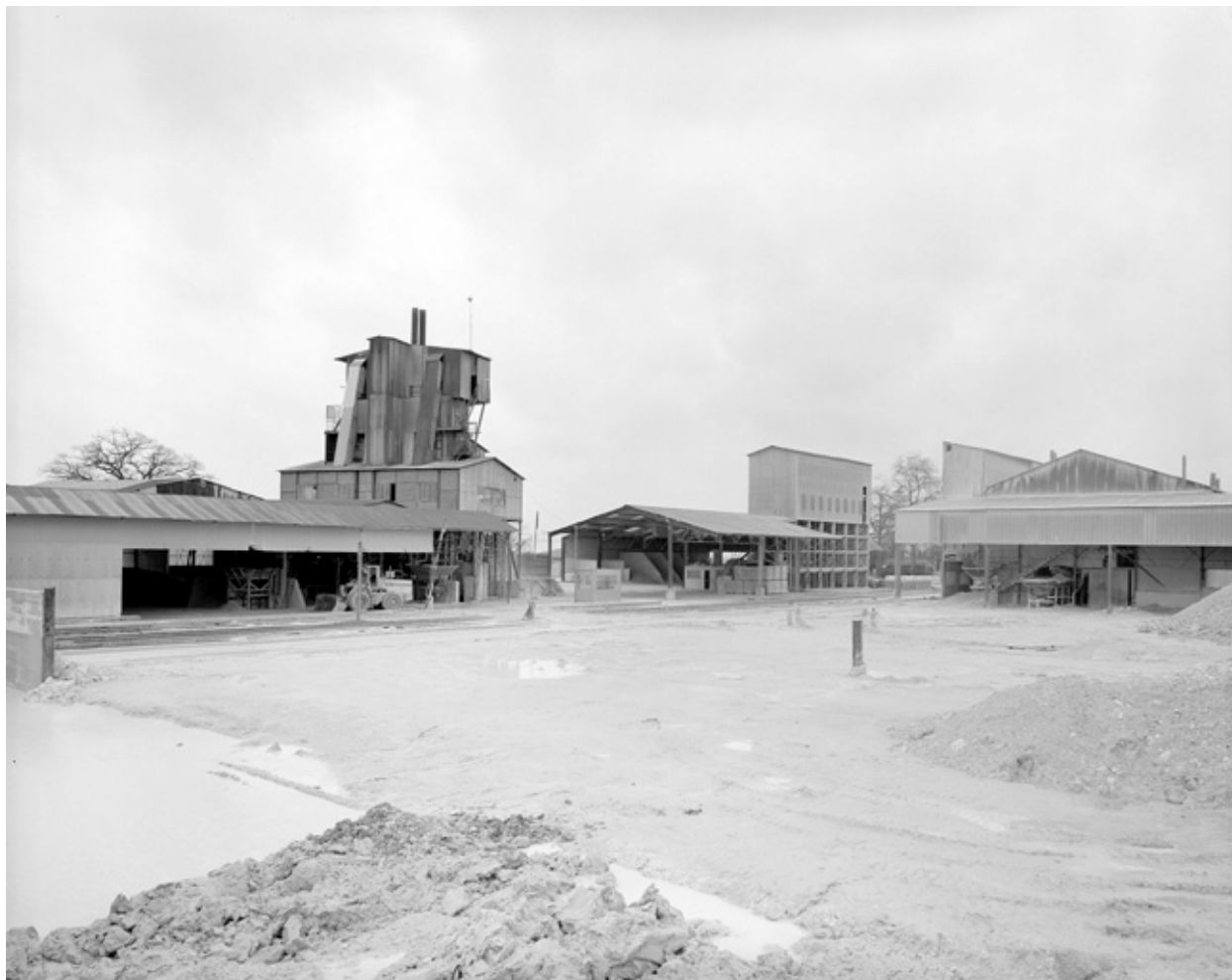
L'ensemble de l'usine : vue prise du sud-est.