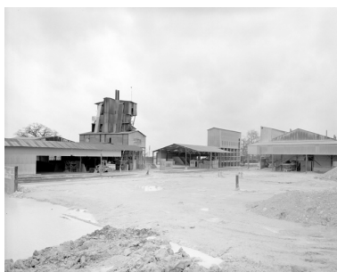
L'ensemble de l'usine : vue prise du sud-est.