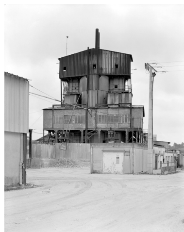
Le four de cuisson de l'argile.