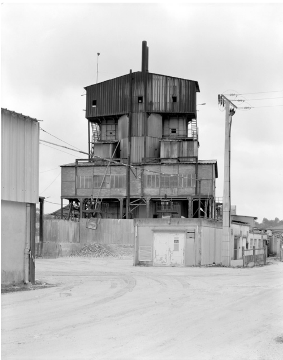
Le four de cuisson de l'argile.