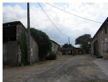
Les deux fermes au sud du hameau, vues vers le sud.

IVR54_20178601766NUCA