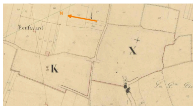
Emplacement de Peufavard sur le plan cadastral de 1840, feuille C2.

Phot. Véronique (reproduction) Dujardin, Autr. A. Joyaux, Autr. Alagille IVR54_20178601739NUCA