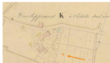
Développement du hameau de Peufavard (partie nord), plan cadastral de 1840, feuille C2.

Autr. A. Joyaux, Autr. Alagille IVR54_20178601723NUCA