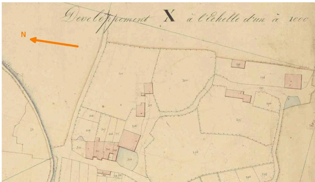
Développement du hameau de Peufavard (partie sud), plan cadastral de 1840, feuille C2.