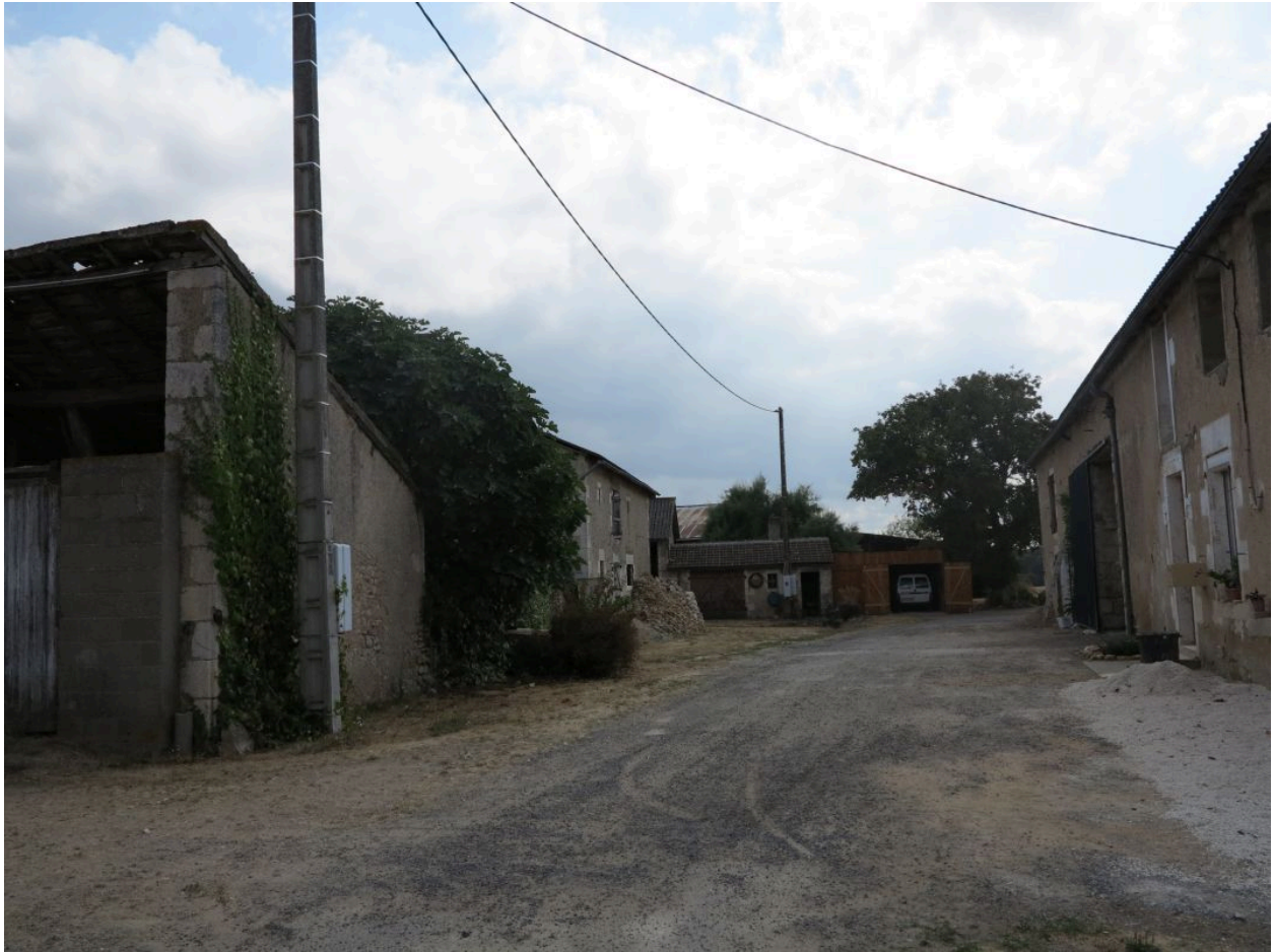
Les deux fermes au sud du hameau, vues vers le sud.