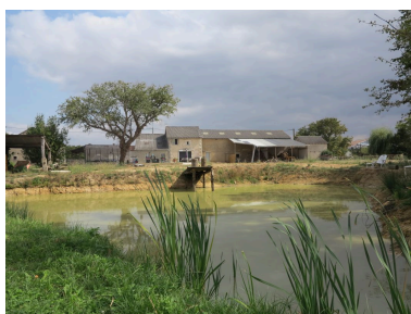
Mare à l'ouest de la partie sud du hameau de Peufavard.

Phot. Véronique (reproduction) Dujardin, Autr. A. Joyaux, Autr. Alagille IVR54_20178601741NUCA