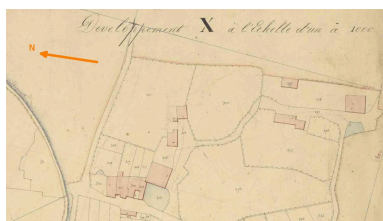
Développement du hameau de Peufavard (partie sud), plan cadastral de 1840, feuille C2.

Autr. A. Joyaux, Autr. Alagille IVR54_20178601740NUCA