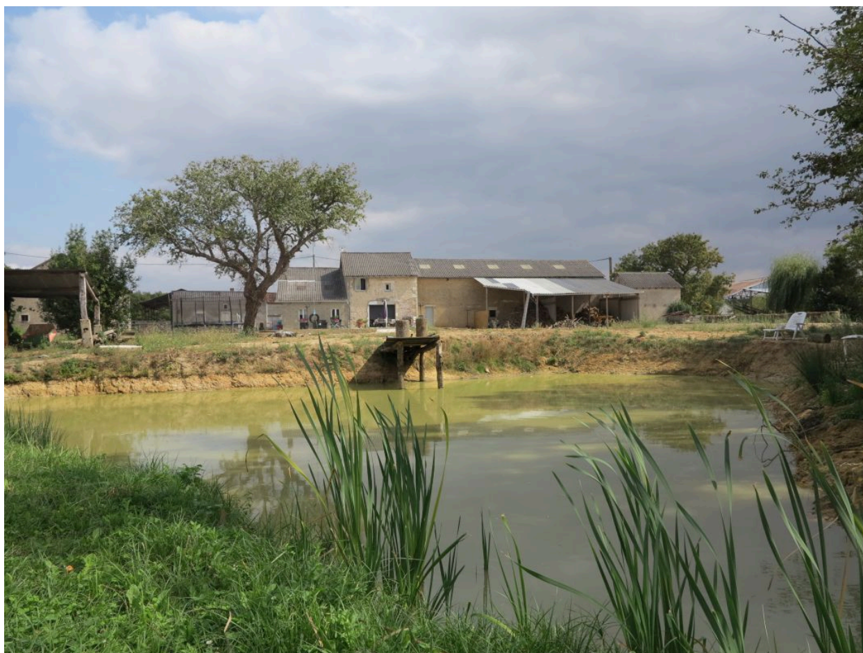
Mare à l'ouest de la partie sud du hameau de Peufavard.