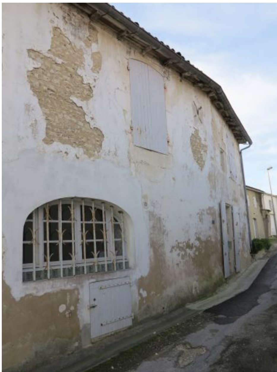
Ouvertures de l'aile nord.