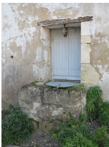
Le puits.