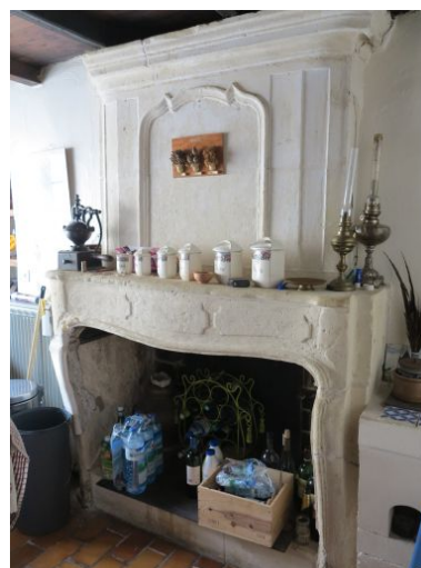
Cheminée du 18e siècle dans l'aile nord. IVR54_20131705991NUCA