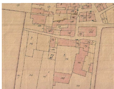
Les parcelles 128 à 130, au centre, sur le plan cadastral de 1833.