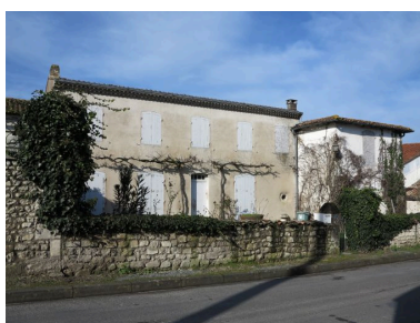
La maison vue depuis le sud-est.