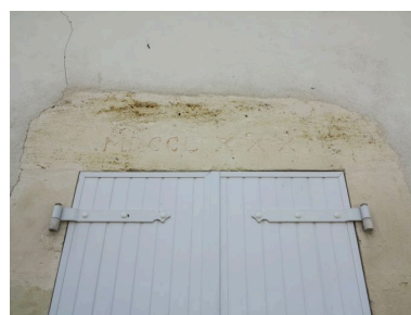
La date 1782, en chiffres romains, au-dessus d'une ouverture dans la rue des Basse coutures. IVR54_20131705993NUCA