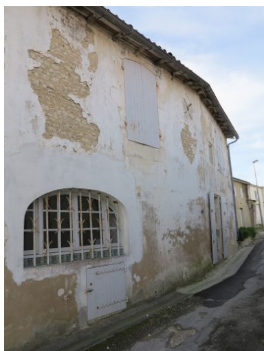
Ouvertures de l'aile nord. IVR54_20131705309NUCA