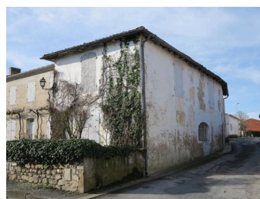
L'aile nord vue depuis l'est.