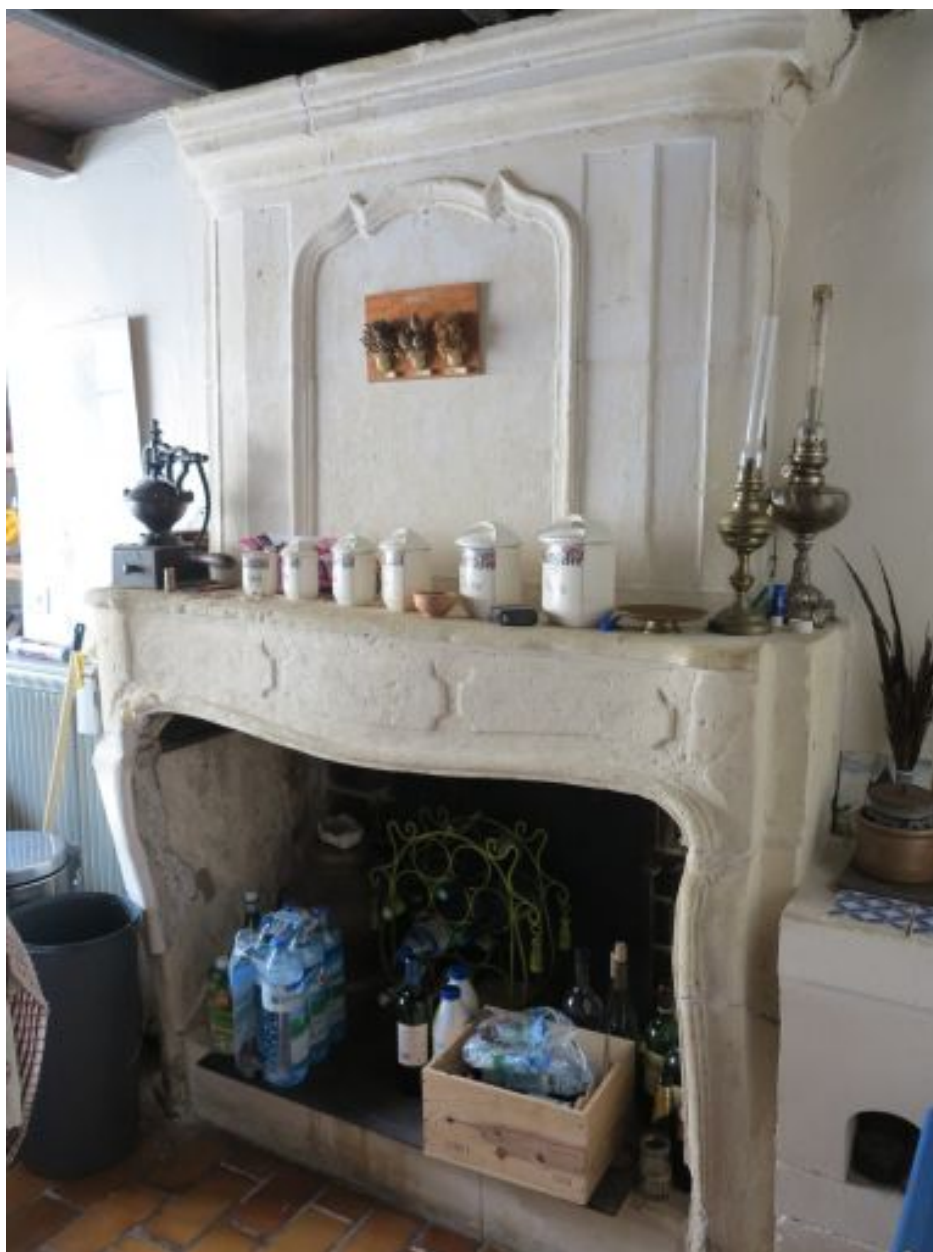
Cheminée du 18e siècle dans l'aile nord.