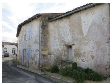
Le puits et l'aile nord vus depuis l'ouest.