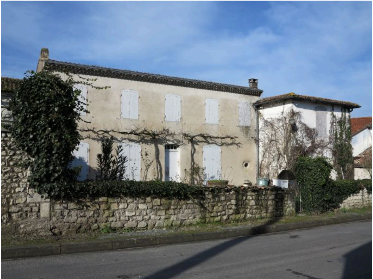
La maison vue depuis le sud-est.