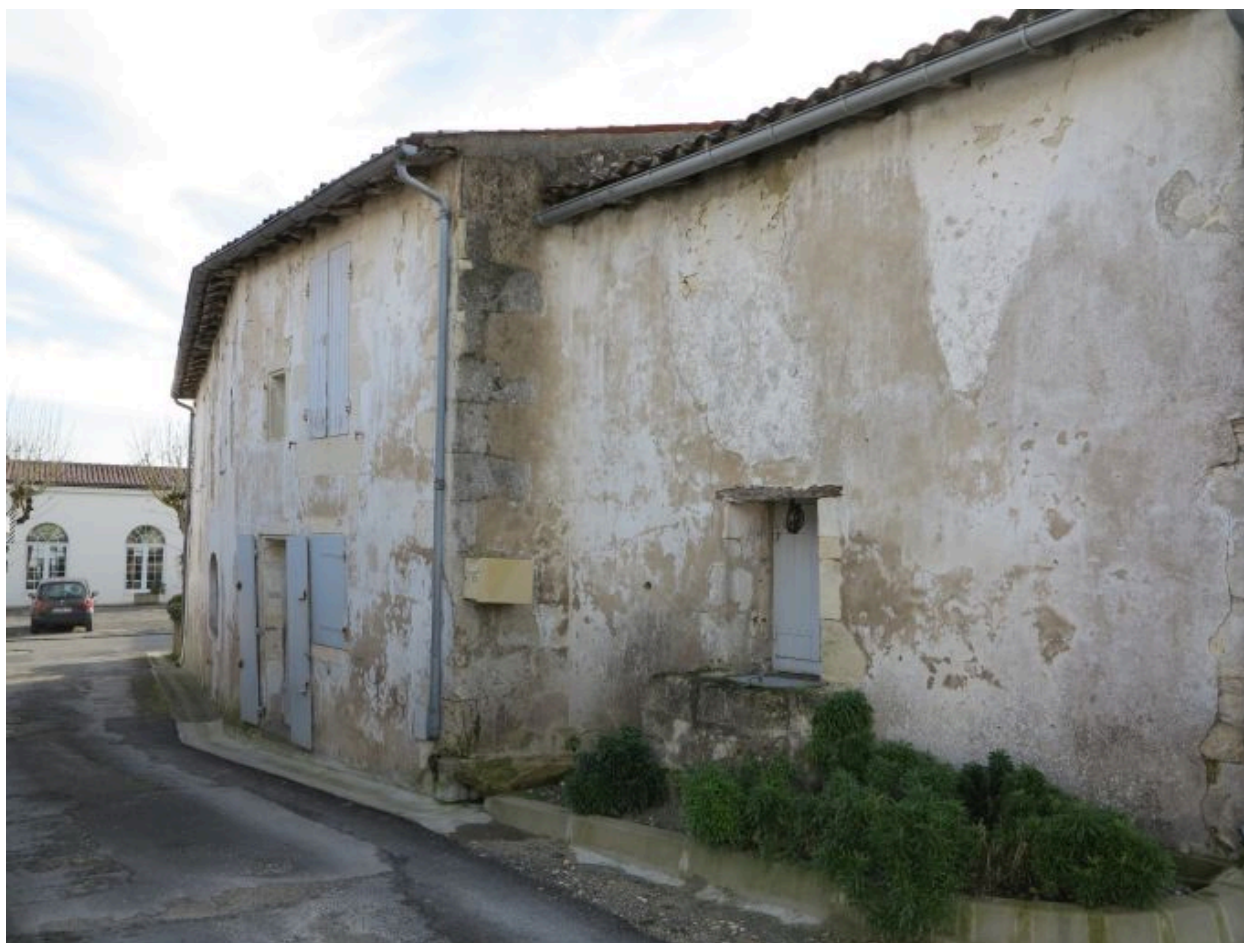
Le puits et l'aile nord vus depuis l'ouest.