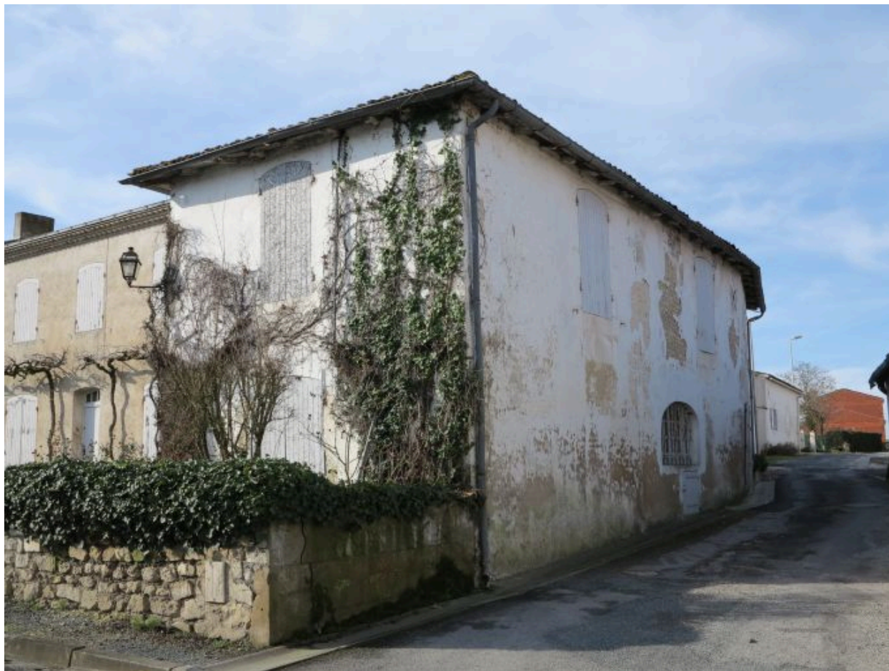
L'aile nord vue depuis l'est.