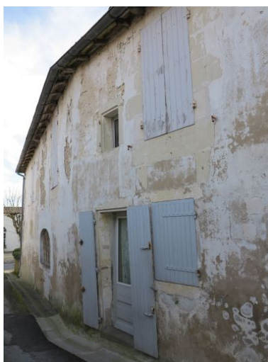
Ouvertures de l'aile nord. IVR54_20131705312NUCA