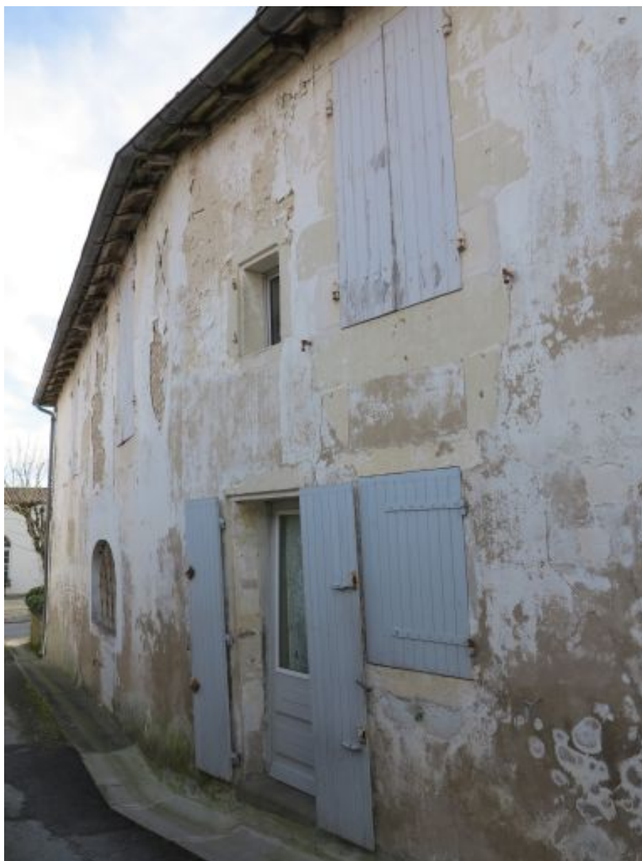
Ouvertures de l'aile nord.