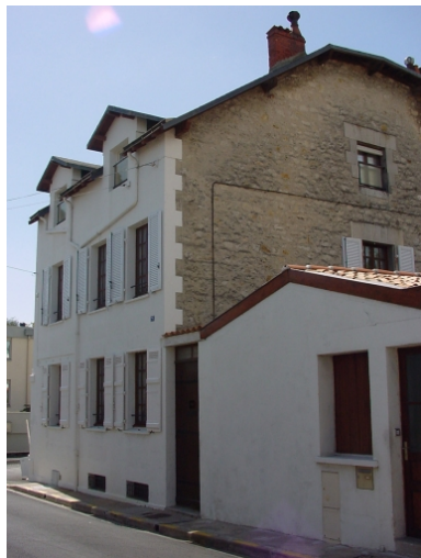
Vue générale. IVR54_20041705592NUCA