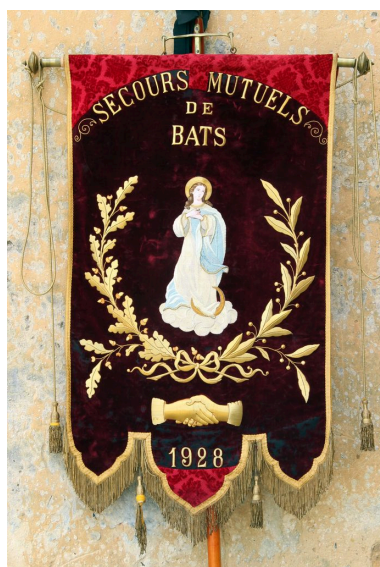
Ensemble (face). IVR72_20204001237NUC2A