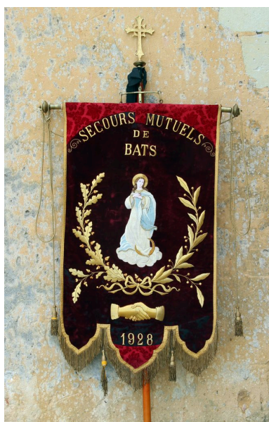
Ensemble (face) avec la hampe. IVR72_20204001236NUC2A