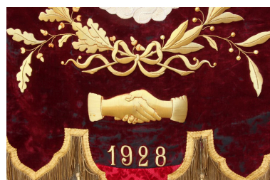
Détail du décor de la face : bonne foi et date 1928.