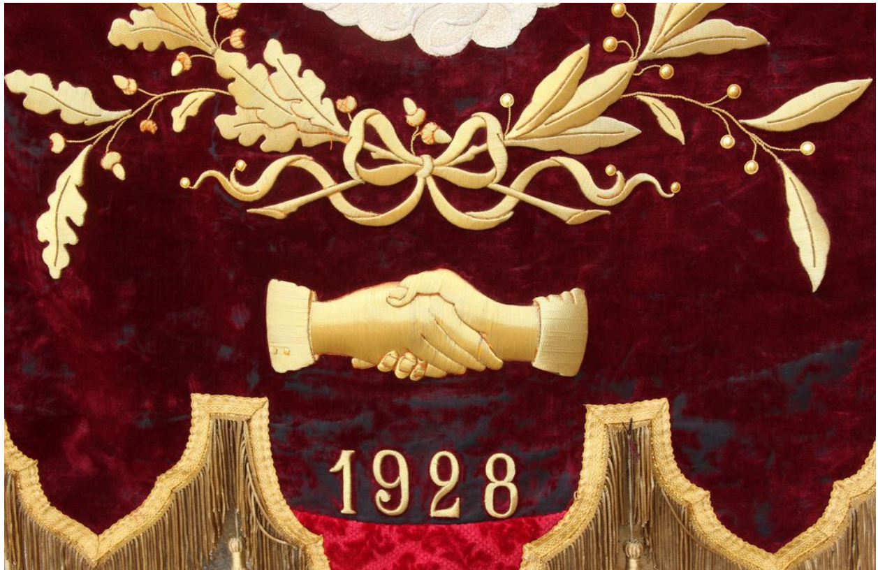
Détail du décor de la face : bonne foi et date 1928.