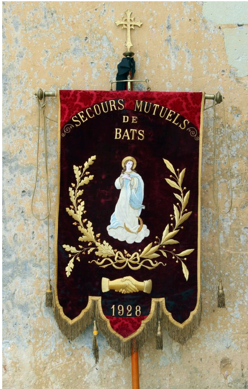
Ensemble (face) avec la hampe.