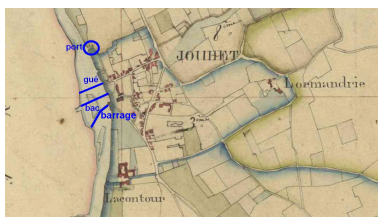
Le bac, le gué et le port de Jouhet, localisés sur le plan d'assemblage du cadastre de 1840.