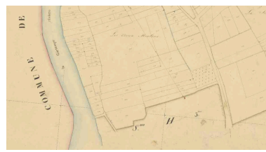
Les vieux moulins et le chemin du vieux port, plan cadastral de 1840, feuille A6. IVR54_20178601033NUCA