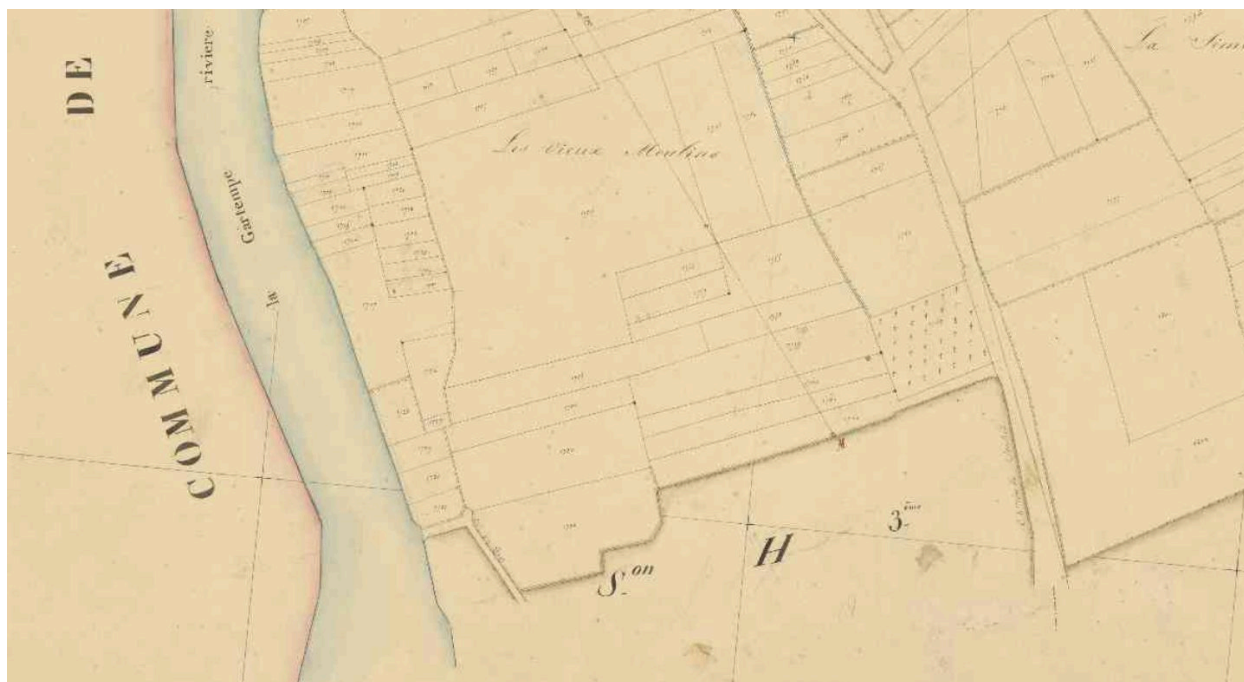
Les vieux moulins et le chemin du vieux port, plan cadastral de 1840, feuille A6.