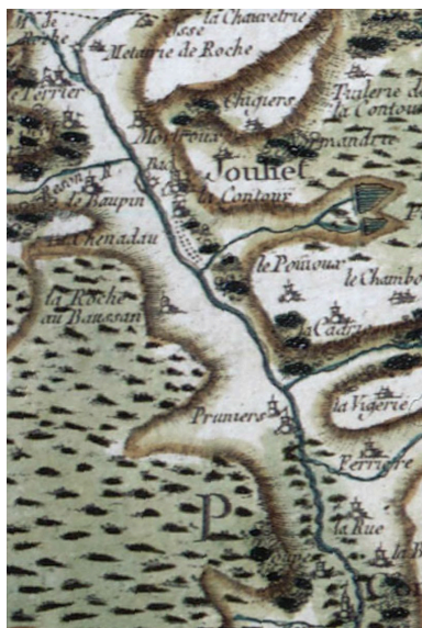
Bac de Jouhet, extrait de la carte de Cassini.