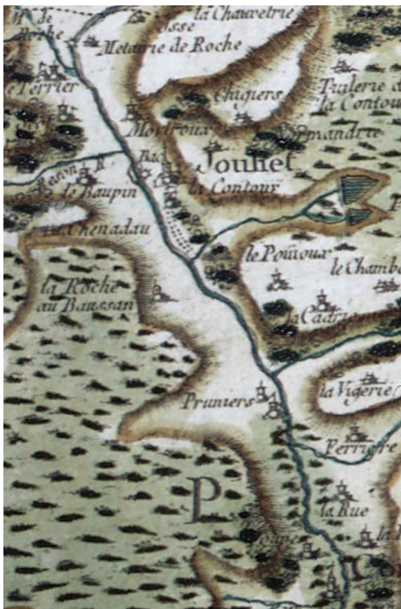
Bac de Jouhet, extrait de la carte de Cassini.