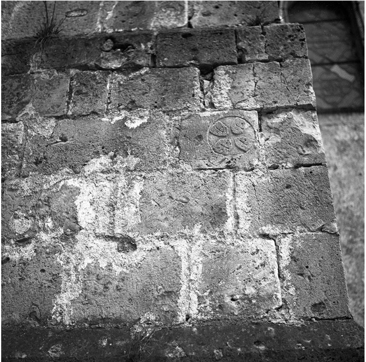
Élévation sud, contrefort, signe gravé, en 1974.