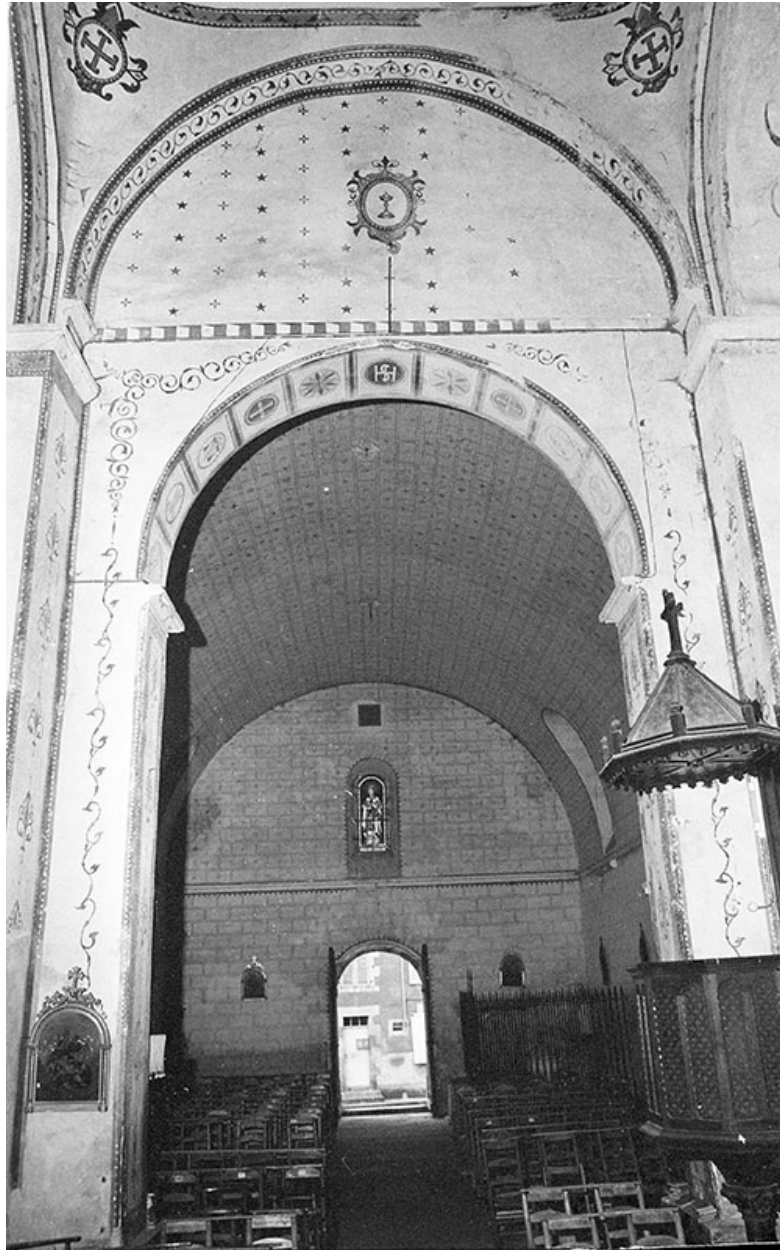
Nef, intérieur, vue vers l'entrée, en 1974.