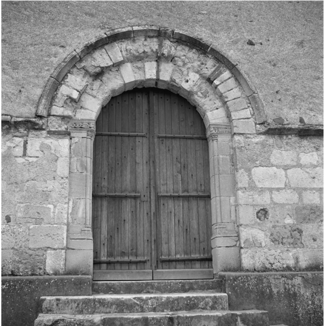
Façade occidentale, portail, en 1976.