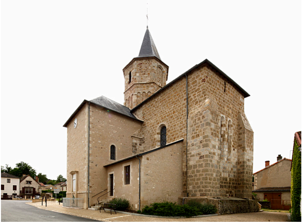
L'église vue depuis le sud-est.