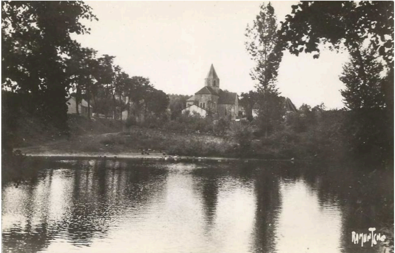
La Gartempe et le chevet de l'église, carte postale ancienne.