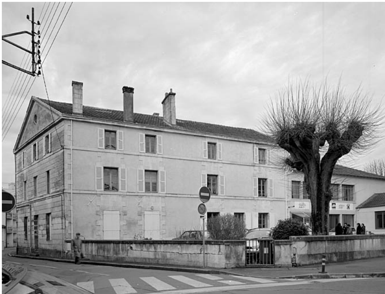
Vue d'ensemble prise du sud-est.