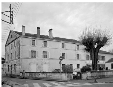
Vue d'ensemble prise du sud-est. IVR54_20017900906V