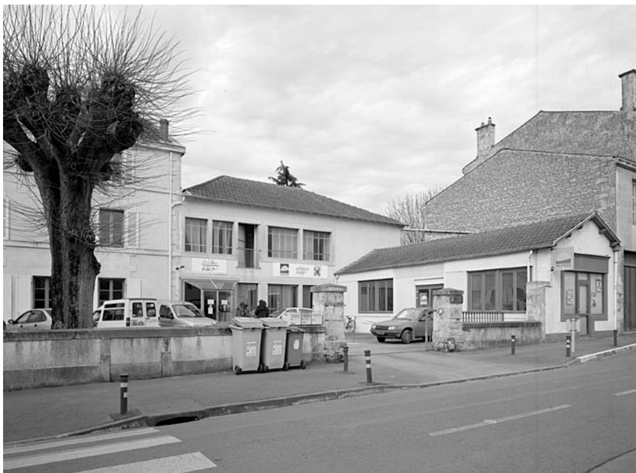
Vue prise de l'est.