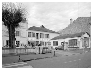
Vue prise de l'est.