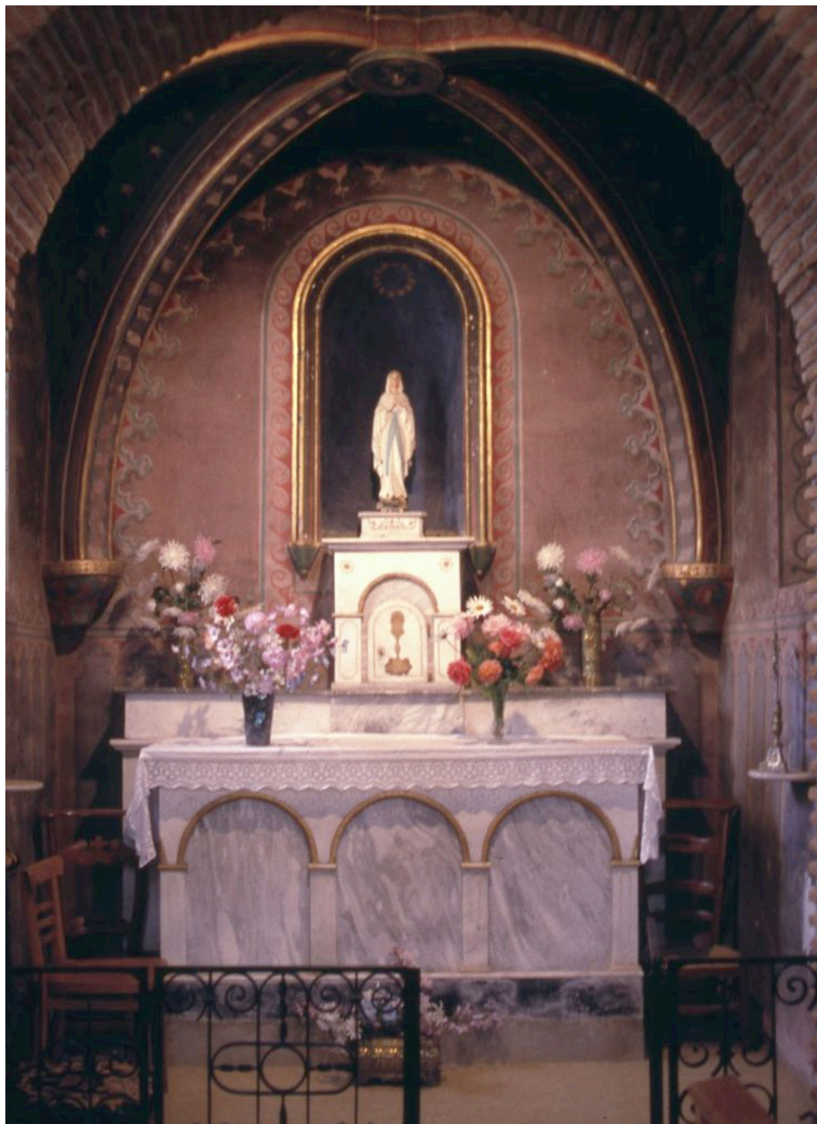
La chapelle de la Vierge en 1991, avant la suppression des peintures murales de 1870.