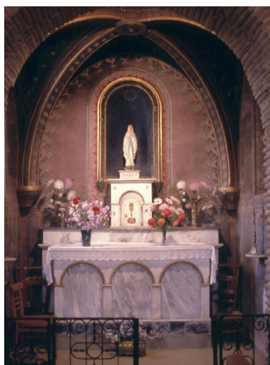
La chapelle de la Vierge en 1991, avant la suppression des peintures murales de 1870.

Repro. Jean-Philippe Maisonnave, Autr. Jean-Philippe Maisonnave IVR72_20204001483NUC1A