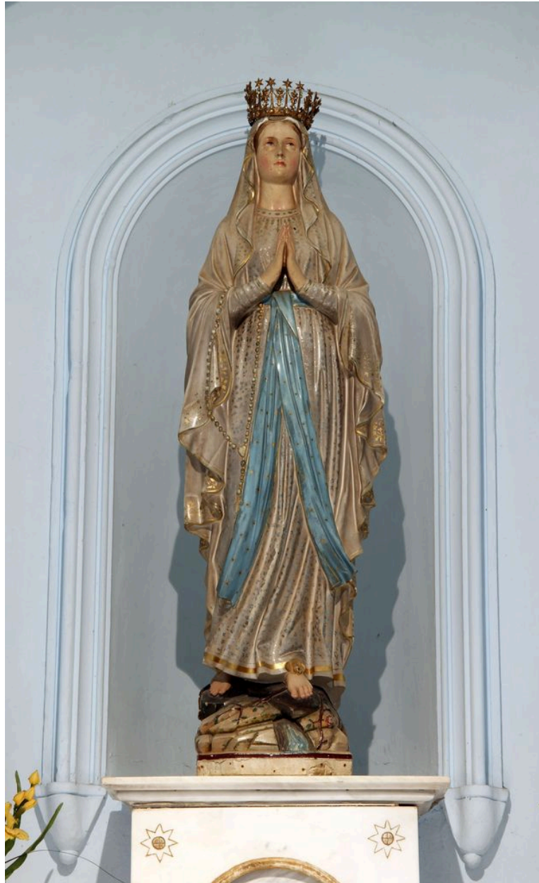
Statue de Notre-Dame de Lourdes.