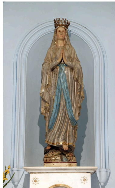
Statue de Notre-Dame de Lourdes. IVR72_20204001293NUC2A

IVR72_20204001291NUC2A