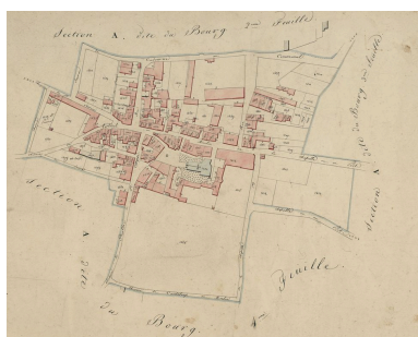
Extrait du plan cadastral de 1825 : parcelles 1533, 1534.

IVR72_20163301010NUC2A