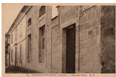
Carte postale, début 20e siècle (collection particulière) : école des filles. IVR72_20173302693NUC1A

IVR72_20163301010NUC2A