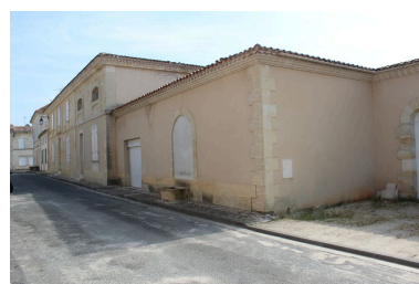
Vue d'ensemble. IVR72_20163301777NUC2A