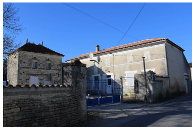
Une vue d'ensemble de l'ancienne ferme, depuis le sud-est. IVR54_20171700341NUCA