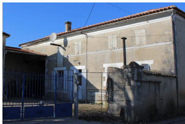
Une vue du logement de l'ancienne ferme, depuis le sud-est.