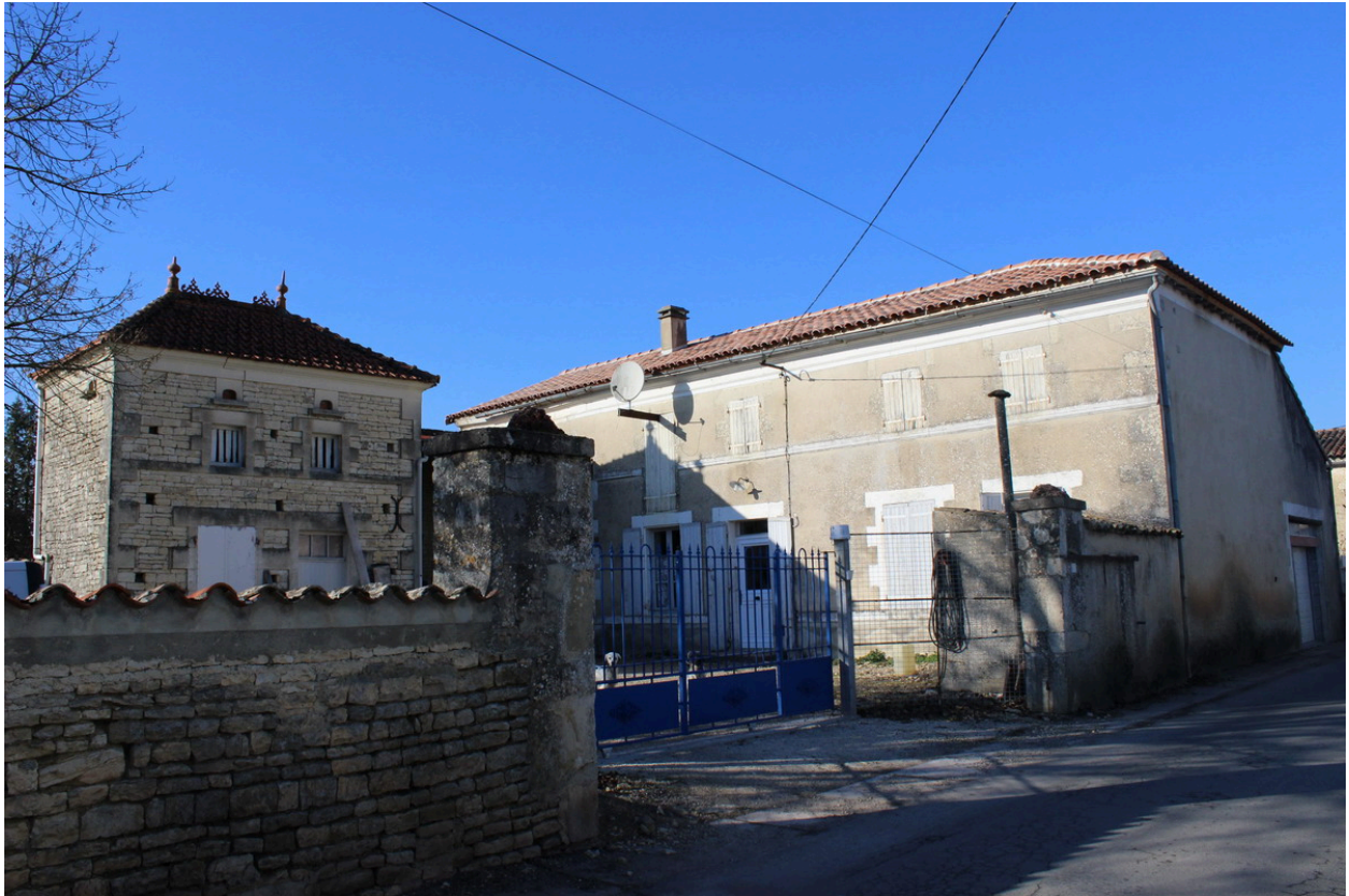
Une vue d'ensemble de l'ancienne ferme, depuis le sud-est.