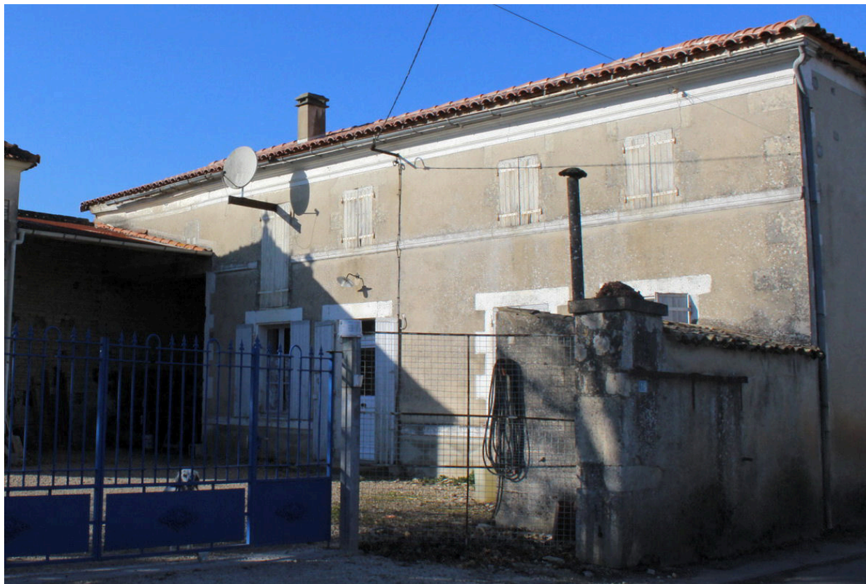
Une vue du logement de l'ancienne ferme, depuis le sud-est.