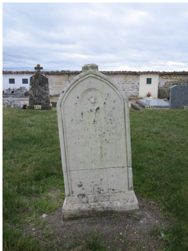
La stèle. IVR54_20131705711NUCA

Schéma de répartition des tombeaux recensés dans le cimetière d'Arces-sur-Gironde. IVR54_20131705685NUDA